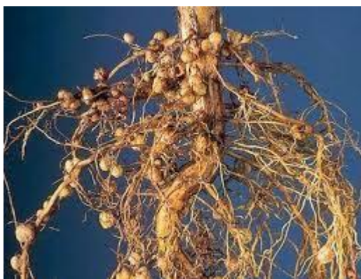
Slika 2.1. Kvržice na korijenu soje

Korijen soje sastoji se od jakog vretenastog korijena i velikog broja sekundarnog korijenja koji se razvijaju na različitim dubinama tla i velike su apsorpcijske moći. Glavni korijen dopire do 60 cm dubine, a postrano korijenje do 150 cm (Rapčan, 2014.) Ipak, glavina korijenovog sistema nalazi u gornjem dijelu tla, na dubini 15 - 30 cm (Vratarić, 1986). Na korijenu soje razvijaju se kvržične bakterije vrste Bradyrhizobium japonicum koje simbiotskim odnosom s biljkom sebi osiguravaju ugljikohidrate, a biljku opskrbljuju dušikom vežući atmosferski dušik i pretvarajući ga u biljci dostupan amonijski oblik. Najviše se kvržica razvija na glavnom korijenu i u plićem sloju. Aktivnost kvržica traje 50 - 60 dana nakon čega one odumiru. Na slici 2.1 prikazan je korijen soje s dobro razvijenim kvržicama.