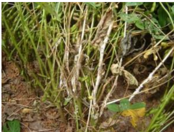
Slika 3.3 Bijela trulež korijena i stabljike