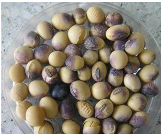
Slika 3.2 Plamenjača na sjemenu soje