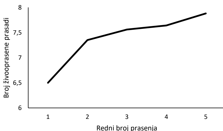
Grafikon 5.1.1. Utjecaj rednog broja prasenja na veličinu legla banijske šare svinje