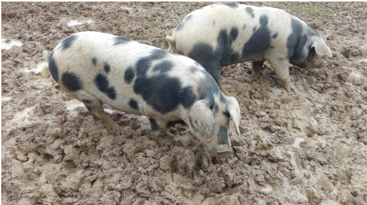
Slika 3.3.4.1. Banijska šara svinja na otvorenom

Otvoreni sustav držanja karakterističan je za ekstenzivnu proizvodnju. Sve kategorije svinja drže se na otvorenom i omogućeno im je slobodno kretanje. Grade se samo jednostavniji i jeftiniji objekti za hladniji dio godine ili za zaštitu od nepovoljnih vremenskih uvjeta (sunce, kiša, tuča). Smanjeni su troškovi smještaja i energije, a više pažnje posvećuje se očuvanju okoliša i dobrobiti svinja. Preduvjet koji je potrebno ispuniti za držanje svinja na otvorenom je posjedovanje velikih zemljišnih površina, jer naseljenost ne bi trebala prelaziti 25 krmača s prasadi po hektaru (Uremović i Uremović 1997.), odnosno 15 do 20 tovljenika po hektaru, ovisno o završnoj tjelesnoj masi tovljenika i količini dostupne hrane na otvorenom. Ukoliko se upotrebljavaju pašnjaci, iskorišteni dio treba održavati na način da se po potrebi uredi, pokosi, poravna, te pognoji (Pejaković 2002.).