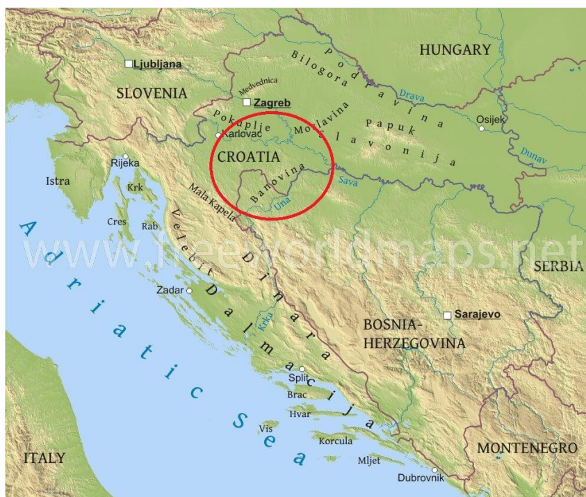
Slika 3.1.2. Područje uzgoja Banijske šare svinje