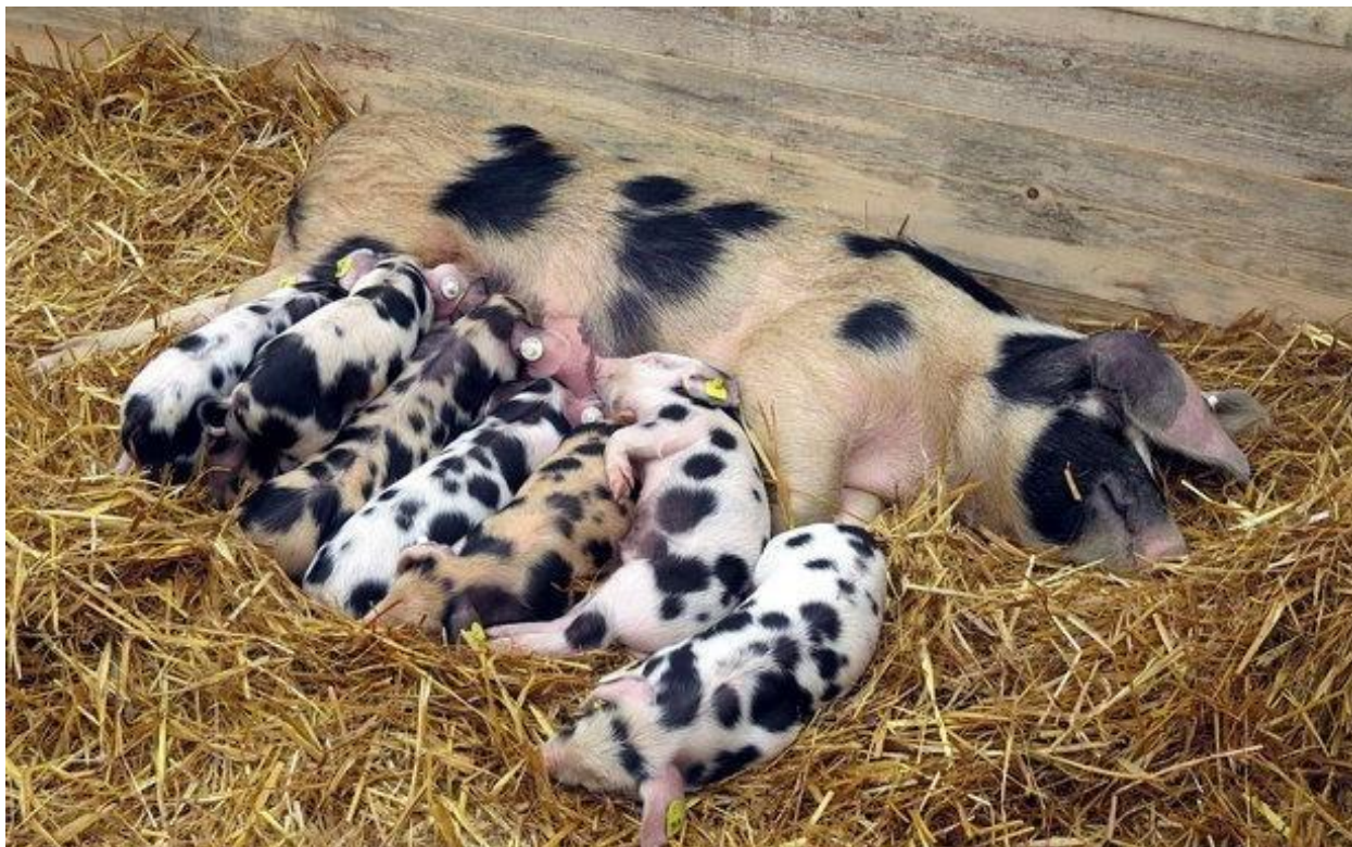
Slika. 3.1.1. Krmača banijske šare svinje sa praščićima

valjanih svinja su 2007 godine na gospodarstvu Rade Gagića u Trgovima zatekli svinje specifičnog izgleda s velikim crnim šarama. (Salajpal i sur., 2017.)