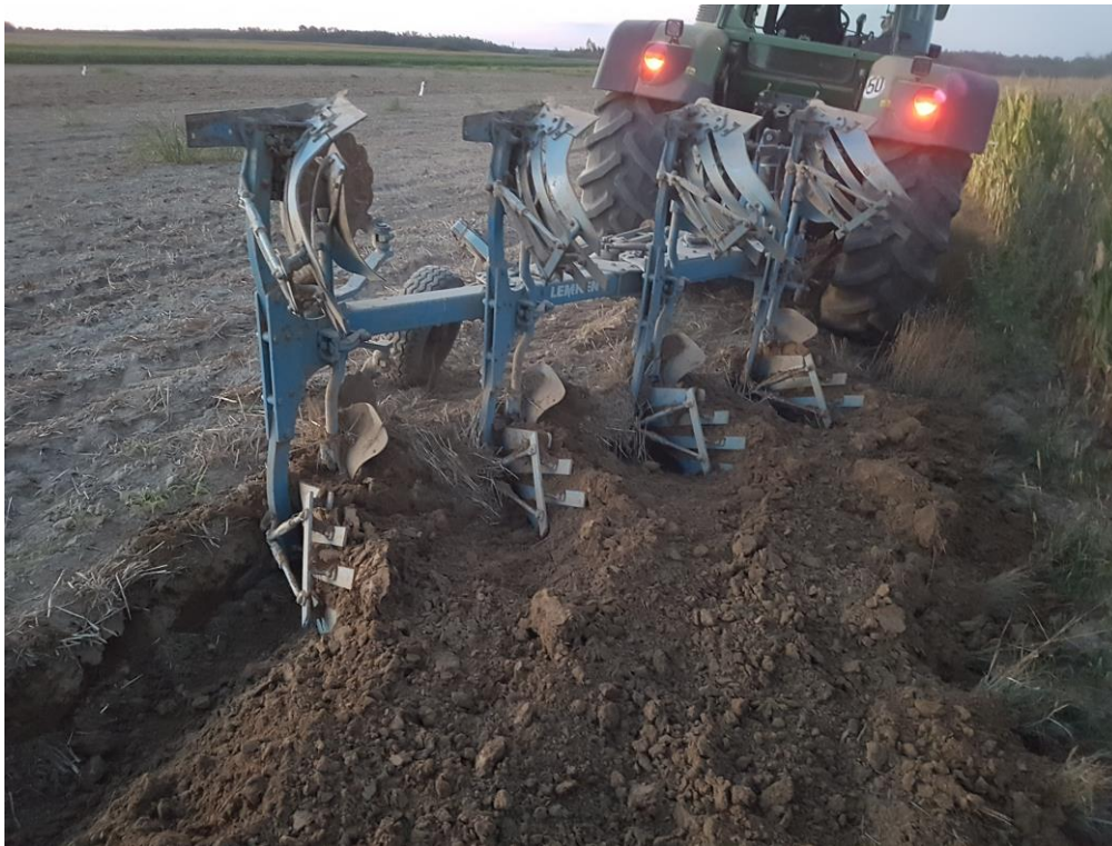
Slika 3.2. Oranje plugom premetnjakom