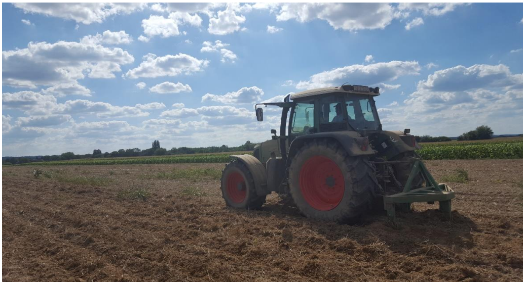
Slika 3.3 Podrivanje rovilom na dubinu od 40 - 45 cm