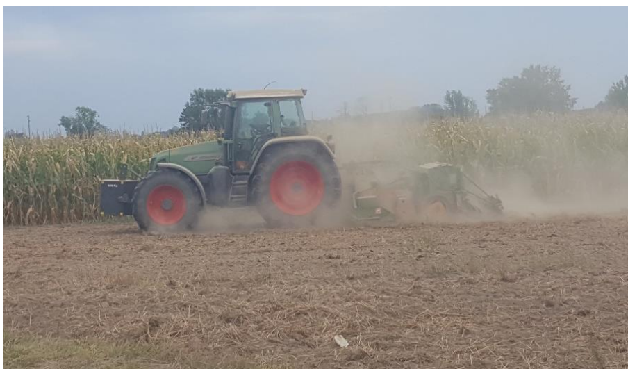
Slika 3.5. Sjetva uljane repice sjetvenom linijom „Amazona“

Za sjetvu je korišten hibrid Gordon sjemenske kuće KWS. Sjetva je obavljena 1.09.2017. sjetvenom linijom „Amazona“ (integrirani agregat roto-drljača + sijačica) na međuredni razmak od 12,5 cm (Slika 3.5.). Dubina sjetve iznosila je 2 cm.