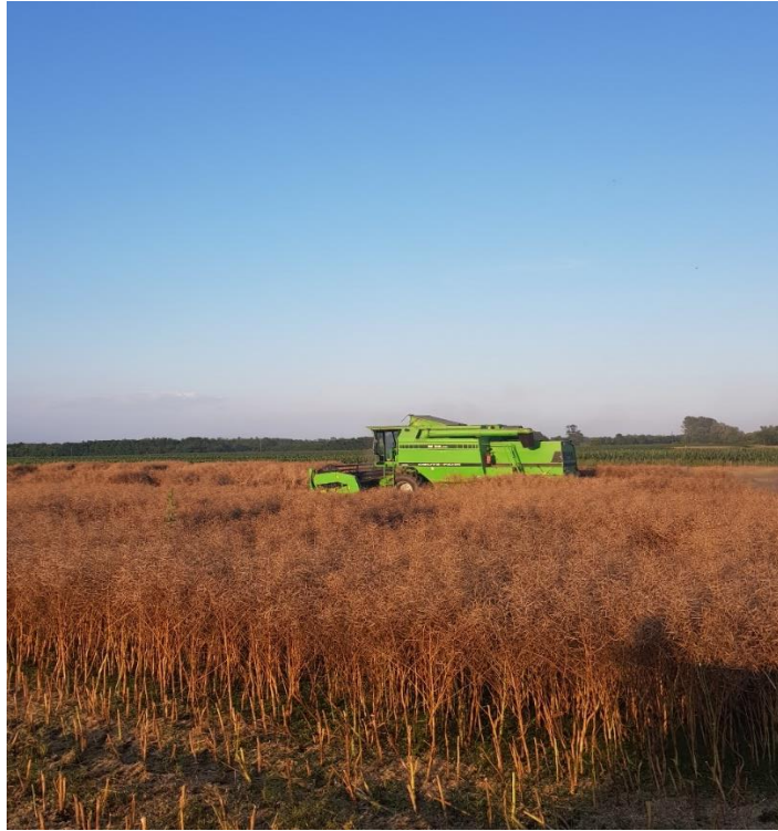
Slika 3.7. Žetva uljane repice kombajnom u fazi tehnološke zrelosti