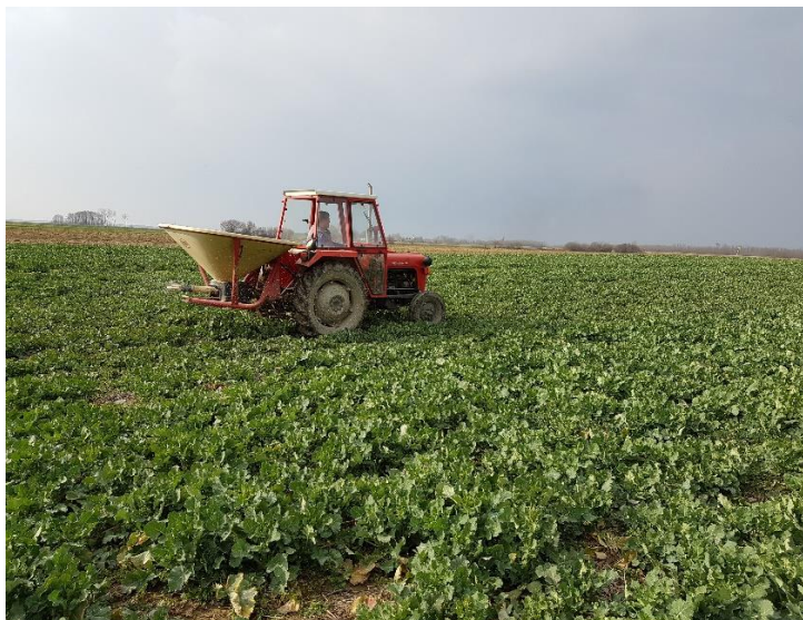
Slika 3.4 Prihrana uljane repice KAN-om prije kretanja vegetacije

Osnovna gnojidba je obavljena u dva navrata s gnojivom NPK 7-20-30 u ukupnoj količini od 200 kg/ha. Prije oranja/podrivanja primjenjeno je 2/3 gnojiva, dok je ostatak primjenjen neposredno prije sjetve. Prva prihrana uljane repice je obavljena 15.03.2018. neposredno prije kretanja vegetacije u proljeće s 230 kg/ha KAN-a (Slika 3.4), a druga 27.03.2018. godine sa 180 kg/ha KAN-a.