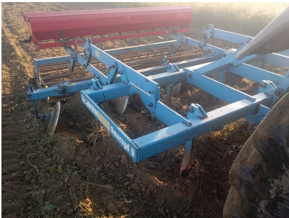
Slika 3.1 Prašenje strništa plošnim kultivatorom

U prvoj varijanti oranje je obavljeno 15.08.2017. godine na dubinu od 30 cm plugom premetnjakom (Slika 3.2.). U drugoj varijanti, umjesto oranja obavljeno je podrivanje na dubinu od 40 - 45 cm (Slika 3.3.).