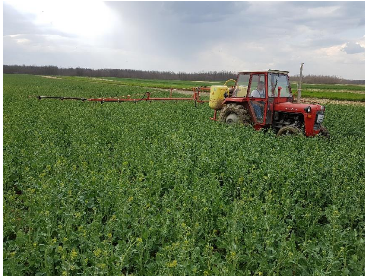
Slika 3.6. Tretiranje repičinog sjajnika

Zaštita usjeva od korova provedena je 3.09.2017. godine preparatom Teridox (Dimetaklor 500 g/l) u količini od 2 l/ha. Za suzbijanje repičinog sjajnika ( Meligethes aeneus ) korišten je preparat Karate Zeon (Lambda cihalotrin 50 g/l) u dozi od 0,15 l/ha (Slika 3.6.).