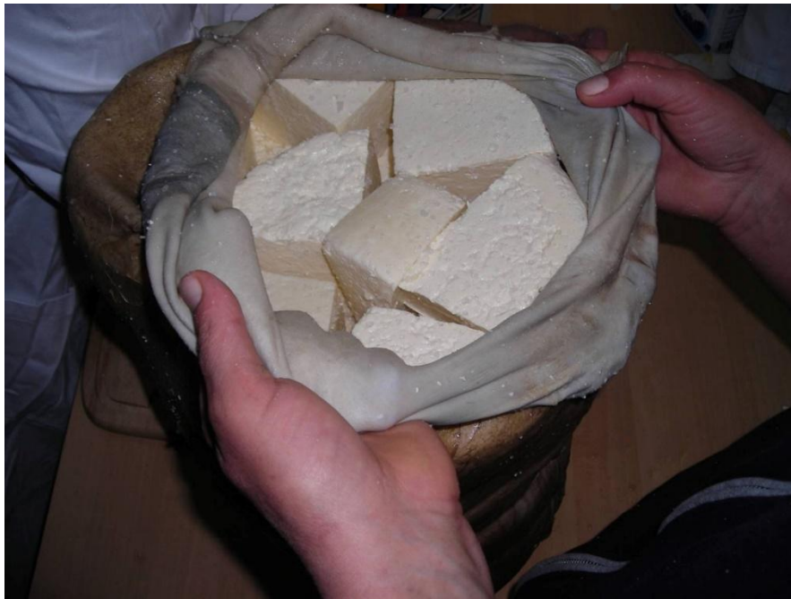
Slika 5.2.1.1. Punjenje sira u mišinu

zreli sir iz mišine pripada skupini tvrdih sireva. Mlijeko korišteno u proizvodnji sira iz mišine bogatog je kemijskog sastava s velikim udjelom suhe tvari i masti, pa stoga sir iz mišine pripada skupini masnih sireva s prosječnim udjelom masti u suhoj tvari sira 55,52% na kraju zrenja (Kaić i sur. 2008.). Sir je nakon završenog procesa zrenja čvrste konzistencije, bijele do žućkaste boje (Slika 5.2.1.2.). Boja sira najviše ovisi o vrsti mlijeka i dužini zrenja u mišini.