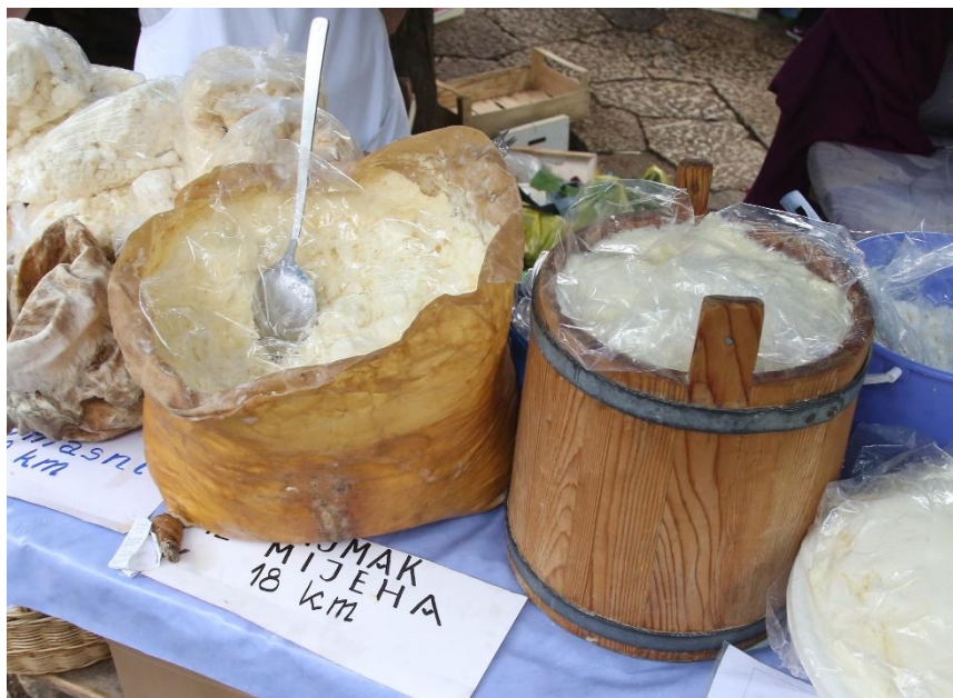
Slika 5.3.1.1. Hercegovački Sir iz mijeha

Postoje dvije varijante hercegovačkog sira iz mijeha. Jedna od varijanti proizvodi se od obranog mlijeka nakon proizvodnje kajmaka (Kalit 2016.). Kajmak je hercegovački proizvod koji 2 mjeseca zrije u drvenoj posudi „kaci“, a zatim se stavlja u životinjsku kožu (Slika 5.3.1.1.) na anaerobno zrenje (Samardžić 2009.). Nakon proizvodnje kajmaka, mlijeko ima visok udio proteina i mali postotak mliječne masti, što doprinosi nutritivnoj vrijednosti sira (Tudor Kalit i sur. 2010.). Druga varijanta proizvodnje sira iz mijeha je primjena punomasnog ili djelomično obranog mlijeka (Kalit 2016.).