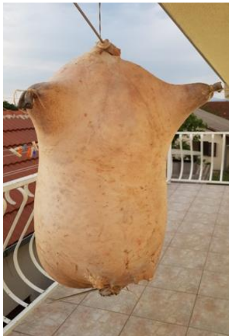
Slika 5.1.3. Napuhnuta mišina nakon sušenja