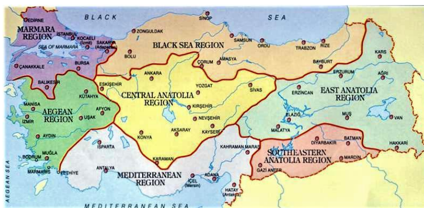
Slika 5.4.1.1. Turska regija Anatolija – područje proizvodnje tulum sira

Prema Tudor Kalit i sur. (2010.) u Turskoj postoji veliki broj sireva koji zriju u životinjskoj koži. Tulum sir najpoznatija je vrsta sira u turskoj koji zrije u životinjskoj koži. Postoji nekoliko varijanti tulum sira kao što su erzincan (savak) tulum, divle tulum i cimi tulum sir. Erzincan (savak) tulum sir najpoznatija je varijanta tulum sira. Danas se njegova proizvodnja odvija u svakoj regiji u Turskoj. Ime ovog sira potječe od plemena Savak, nomadskog naroda koji je u prošlosti obitavao na području istočne Turske, točnije u provinciji Erzincan u regiji Anatoliji (Slika 5.4.1.1.) (Ceylan i sur. 2007.). Tulum sir tradicionalno se proizvodio i prodavao na seoskim lokalnim tržnicama u Turskoj (Sert i sur. 2014.). Ceylan i sur. (2007.) navode da se proizvodnja do danas zadržala u manjim mljekarama i obiteljskim gospodarstvima korištenjem tradicionalnih metoda, dok se prema Sertu i sur. (2014.) modernim metodama proizvodnje koristi vrlo mali broj proizvođača. Riječ je o popularnoj vrsti sira u Turskoj, no tehnologija proizvodnje još uvijek nije standardizirana.