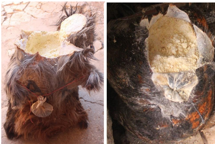
Slika 5.4.1.2. Tulum sir

Prema Tudor Kalit i sur. (2010.) tradicionalna tehnologija proizvodnje tulum sira slična je proizvodnji hrvatskog i hercegovačkog sira koji zrije u životinjskoj koži. U proizvodnji se koristi ovčje ili kravlje mlijeko, ali može se koristiti kozje i bivolje mlijeko i njihova mješavina. Prema Sert i sur. (2014.) mlijeko za proizvodnju tulum sira može biti djelomično obrano, ali u tradicionalnoj proizvodnji koristi se potpuno obrano ovčje mlijeko koje ostaje nakon proizvodnje maslaca. Kamber (2008.) navodi da je žuta boja tulum sira izraženija ukoliko se koristi punomasno mlijeko. Neki proizvođači tijekom proizvodnje dodaju jogurt kako bi okus sira bio bolji i izraženiji. Boja tulum sira varira od bijele do izražene žute boje, ovisno o vrsti mlijeka koja se koristi za proizvodnju sira (Slika 5.4.1.2.) (Kamber 2008.). Sadržava visok udio proteina, mliječne masti (ako se proizvodi iz punomasnog mlijeka), te visok udio suhe tvari (Ceylan i sur. 2007). Pripada skupini polutvrđih sireva. Tekstura mu je granulirana i sklona mrvljenju (Kamber 2008.). Karakterističnog je kiselkastog okusa, a tijekom konzumacije može se osjetiti originalni okus maslaca (Sert i sur. 2014.). Yilmaz i sur. (2005.) navode da prisustvo plijesni tijekom zrenja tulum sira utječe na stvaranje specifičnog okusa po plijesnima, dok Kamber (2008.) tvrdi da okus tulum sira također varira ovisno o regiji proizvodnje.