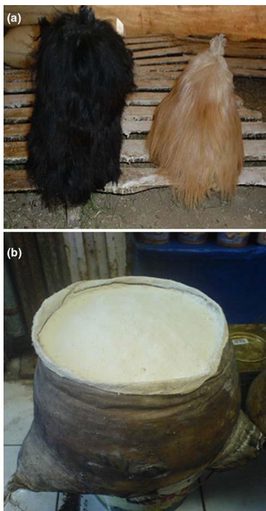
Slika 5.1.1. a) životinjska koža s dlakom prije prodaje sira, b) životinjska koža bez dlake za vrijeme prodaje