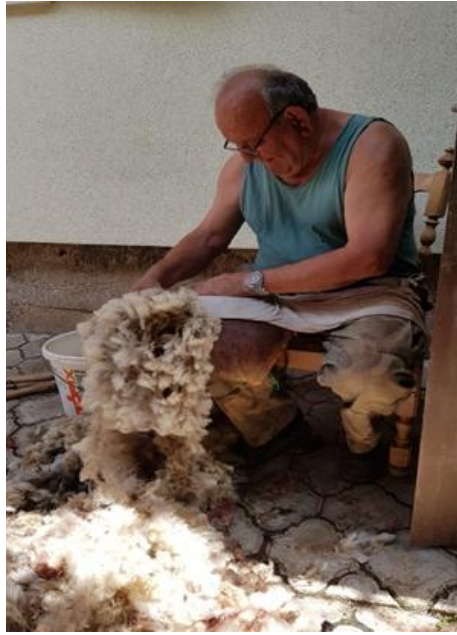
Slika 5.1.2. Obrada mišine