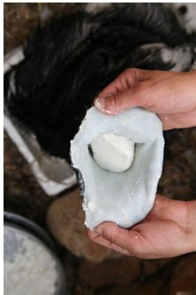
Slika 5.5.2.1. Stavljanje darfiyeh sira i arichi sira na anaerobno zrenje u jareću kožu

Darfiyeh sir i arichi sir zajedno se stavljaju u jareću kožu kroz vratni otvor na anaerobno zrenje. U kožu se slažu 2-3 sirne kuglice darfiyeh sira, a nakon toga slijedi arichi sir (slika 5.5.2.1.). Jareća koža hermetički se zatvara i pohranjuje u prirodne podrume. Sir zrije na temperaturi od 10\text{-}12\text{ }^\circ\text{C} , relativne vlažnosti zraka 85-95% oko 1-3 mjeseca. Jareća koža svaki se tjedan soli s 5 kg soli (Serhan i sur. 2010.).