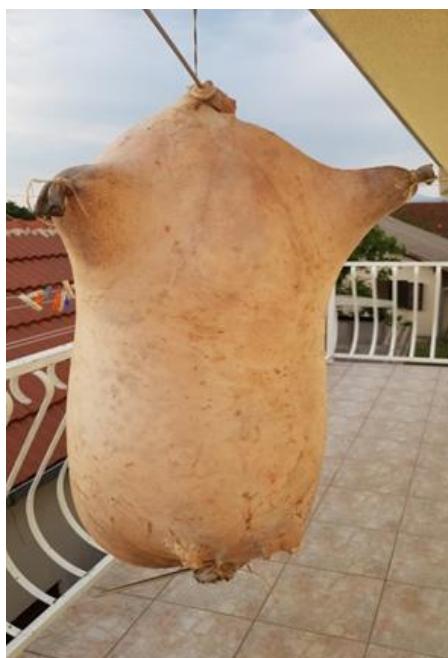
Slika 5.1.3. Napuhnuta mišina nakon sušenja