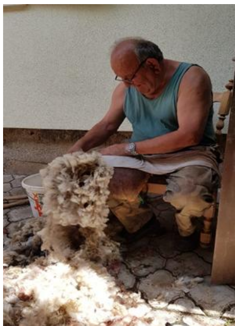
Slika 5.1.2. Obrada mišine