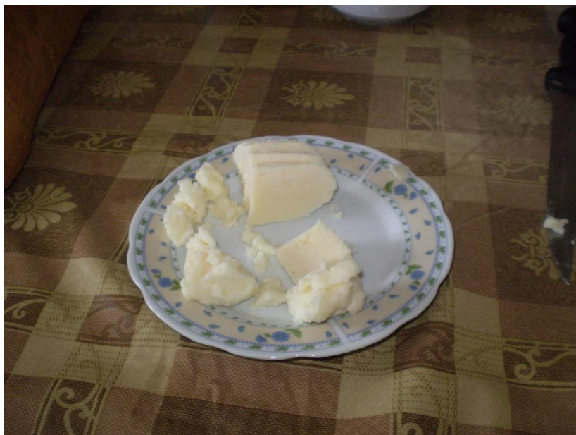
Slika 5.2.1.2. Zreli sir iz mišine za konzumaciju