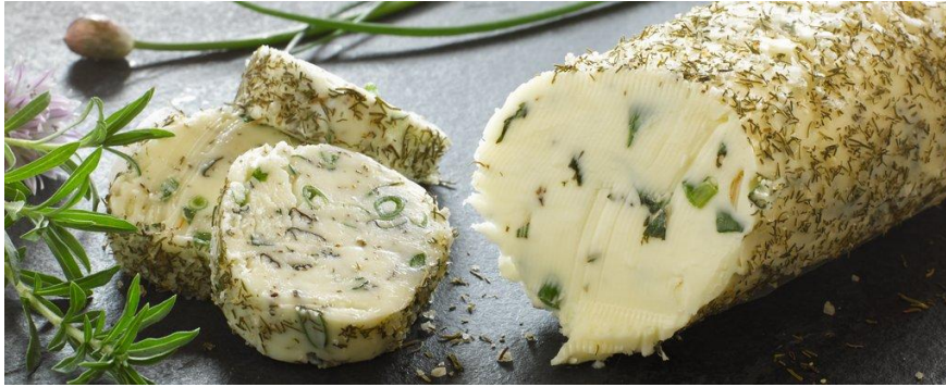
Slika 3.6. Maslac sa začinskim biljem