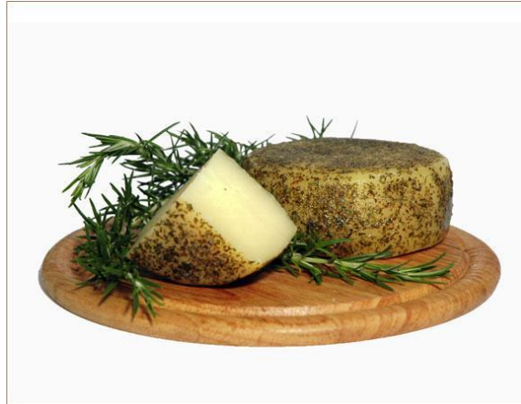
Slika 3.4. Krčki sir aromatiziran ružmarinom