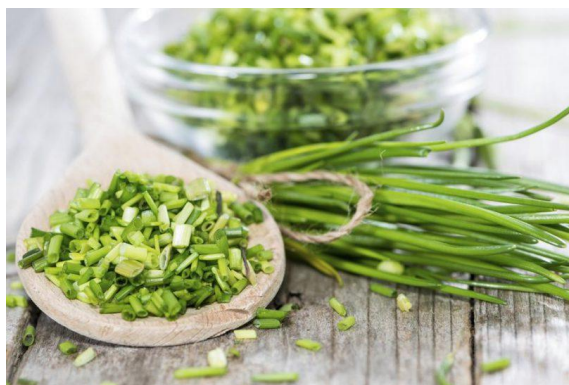
Slika 2.2.1. Vlasac