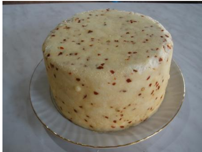
Slika 3.3. Kuhani sir sa usitnjenom crvenom paprikom

( https://www.savjetodavna.hr/vijesti/12/4266/demonstracije-izrade-sireva/ ).