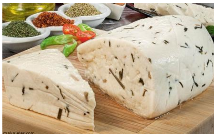
Slika 3.7. Otlu sir

Prije samog dodavanja začina i začinskog bilja u grušu, potrebno ih je preliti vrelom vodom. Nakon miješanja začina, začinskog bilja i gruša, sirnu masu je potrebno dobro ocijediti. Nakon završenog zrenja u trajanju 2-3 mjeseca pokazalo se da Otlu sir ima posebne karakteristike u vidu većeg udjela željeza te vitamina C, što se pripisuje učincima dodanih začina i začinskog bilja. Također, začini svojim antimikrobnim i antioksidativnim djelovanjima produžuju rok trajanja Otlu sira (Kalit i Tudor Kalit, 2018.).