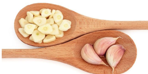
Slika 2.3.1. Češnjak

Češnjak je biljka koja pripada porodici lukova i specifičan je po svom okusu i aromi. Sastoji se od sivozelenih listova te baze sastavljene od nekoliko dijelova koja se naziva – češanjski (Slika 2.3.1.). U ljetno vrijeme biljka češnjaka proizvodi sitne glavice koje se sastoje od bijelih, crvenkasto nijansiranih cvjetova (Squire, 2008.)