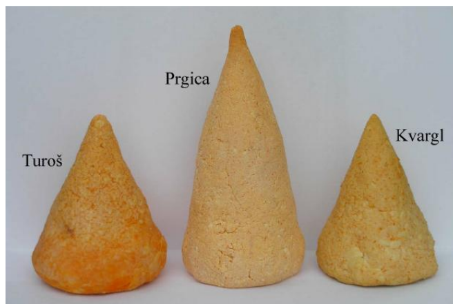
Slika 3.2. Sirevi turoš, prgica i kvargl

Valkaj (2015.) je na temelju istraživanja sira turoša, prgice i kvargla utvrdio razliku među njima. U proizvodnji turoša koriste se veće količine crvene mljevene paprike i soli, a i provodi se duže sušenje sira. (Slika 3.2.)