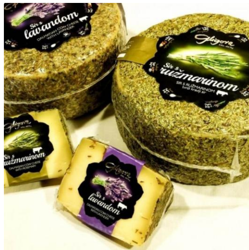
Slika 3.5. Sir od kravljeg mlijeka utrljan ružmarinom i lavandom