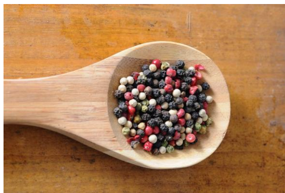
Slika 2.4.1. Zrno papra

Plodovi papra (Slika 2.4.1.) su veličine 5 mm, a nalaze se u dugim klasovima kojih na drvenastoj trajnici može biti od 20 do 30 komada. Koštunice papra, odnosno plodovi, beru se dva puta godišnje, a ovisno o terminu branja te obradi nakon branja razlikujemo zeleni, crveni, bijeli i crni papar. Za opor okus papra zaslužan je njegov glavni sastojak, piperin (Mijatović, 2014.).