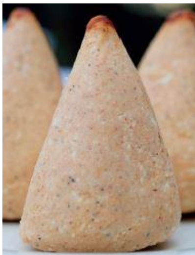
Slika 3.1. Sir prgica