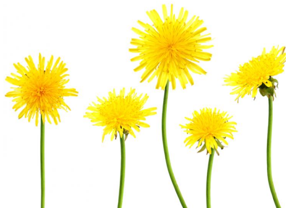
Slika 2.5.1. Maslačak

Maslačak je višegodišnja biljka koja ima vretenasti korijen i listove koji su skupljeni u rozetu. Oblik lista je različit te može imati glatki ili nazubljeni rub. Stabljika maslačaka je okrugla i na vrhu ima žutu cvjetnu glavicu koja se preko noći i za nepogodnog vremena zatvara (Slika 2.5.1.) (Omeragić A. i Hadžiabdić S., 2017).