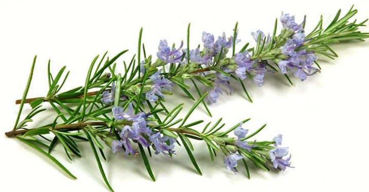
Slika 2.1.1. Ružmarin

Ružmarin je grm koji ima mogućnost samoniklog rasta na suhim područjima, kao i na velikom broju hrvatskih sunčanih otoka. Grm ružmarina može narasti 1-2 m, te cvate u proljeće. Među listovima ružmarina nalaze se cvjetovi (Slika 2.1.1.) koji mogu biti ljubičaste ili svijetlomodre boje. U svom sastavu ružmarin sadrži kalcij, eterično ulje obogaćeno pinenom, kamfor (kamforasto ulje), cineol, tanin, limunsku kiselinu, pektin i smolu (Gursky, 1978.; Kuštrak, 2014.).