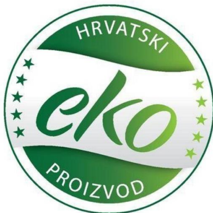
Slika 2.2.2. Hrvatska Eko oznaka