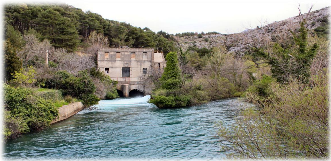
Slika 4.2.1. Rijeka Jadro izvor

Izvor rijeke Jadra koristio se još u antici za opskrbu vodom, putem akvadukta, rimske Salone i Dioklecijanove palače. Zbog njena značaja i događaja iz starohrvatske povijesti, naziva ju se i hrvatskim Jordanom. Na njoj se nalazi Gospin Otok na kojem je hrvatski povjesničar i arheolog don Frane Bulić (1846.-1934.) otkrio brojne nalaze iz starohrvatskog razdoblja, uključujući ulomke s epitafom na sarkofagu kraljice Jelene (976.), značajne za utvrđivanje kronologije srednjovjekovne hrvatske povijesti i rodoslovlje dinastije Trpimirovića ističe (Pavich, A. 2006). Odlukom Skupštine općine Split od 22.3.1984. godine gornji tok rijeke Jadro zaštićen je u kategoriji posebni ihtiološki rezervat. Površina rezervata je oko 7,8 ha, a obuhvaća vodotok i obalu rijeke Jadro od izvora do Uvodića mosta.