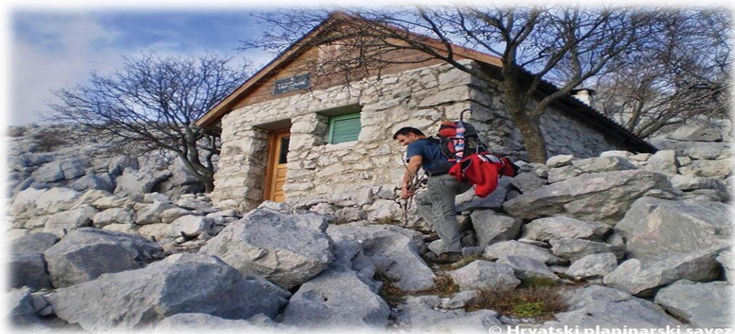
Slika 4.3.7. Planinarska kuća Trpošnjik Mosor

Planinarska kuća Trpošnjik jednostavna je zidana kućica lijepo uklopljena u krševit teren koji ju okružuje. Nalazi se na jugoistočnom rubu Mosora, u području iznad Gata. Od kuće se pruža pregledan vidik na kanjon rijeke Cetine i omiško zaleđe. Otvorena je po dogovoru. Ima kapacitet noćenja za 10 osoba.