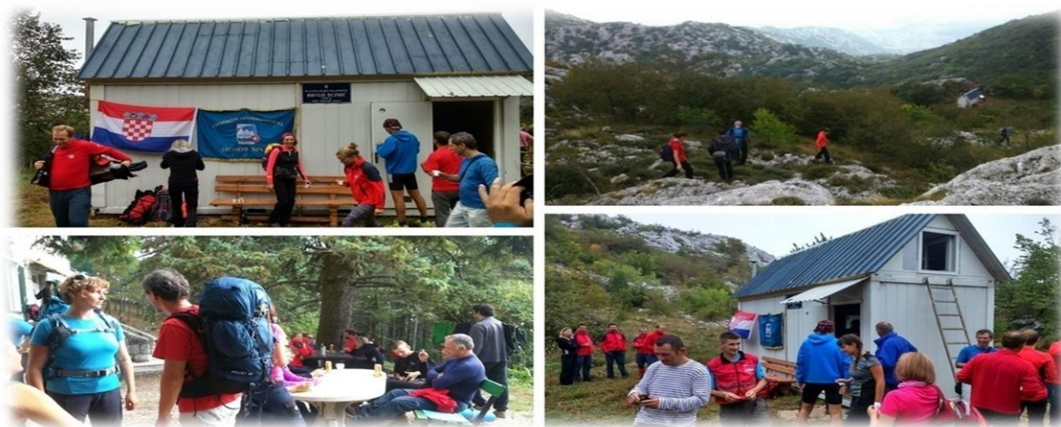
Slika 4.3.4. Planinarsko sklonište "Hrvoje Dujmić" Mosor

Planinarsko sklonište Hrvoje Dujmić nalazi se na teško pristupačnom visinskom području Jabukovca, na sjevernoj strani Mosora, ispod vrha Veliki Kabal. Sklonište je zapravo metalni kontejner, uređen za planinarske potrebe. Nalazi se na rubu slikovite travnate zaravni, uz put koji se iz Kotlenica mimo špilje Vranjače uspinje prema Velikom Kablu. Na području Jabukovca ima mnogo zanimljivih speleoloških objekata. Sklonište je nazvano po iznenadno preminulom splitskom planinaru i gorskom spašavatelju. Otvoreno je stalno. Broj kapaciteta je 10 kreveta.