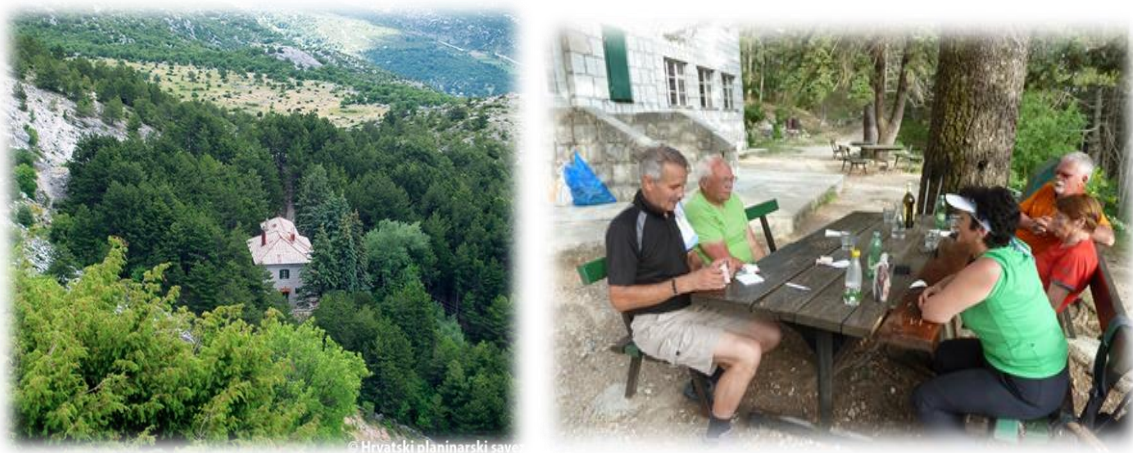
Slika 4.3.5. Planinarski dom "UmbertoGirometta" Mosor

Otvoren je vikendom, a pruža hranu i piće. Broj kapaciteta noćenja je 82 kreveta. Mosor Film Festival se održava u samom srcu dalmatinske najposjećenije planine, na prostranoj livadi Ljuvač tik pod planinarskim domom „UmbertoGirometta“(Pešić N. 2006.). Ova zelena oaza je idealno mjesto za odmor duše i tijela čak i tijekom vrućih ljetnih mjeseci. Smještena je na nadmorskoj visini od 850 m i okružena gustom šumom crnog dalmatinskog bora, dok preko livade teče potočić Ljuvač koji se vodom napaja iz istoimenog izvora, pružajući dašak osvježenja brojnim posjetiteljima. Savršen kontrast okolnom ljutom kršu Mosora.