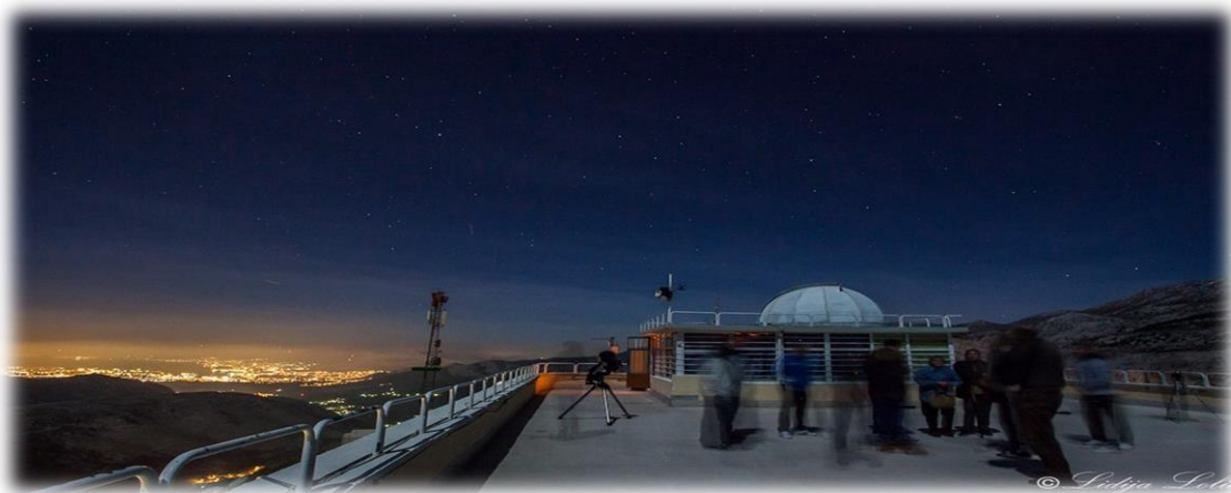
Slika 4.2.4. Pogled na Split sa zvezdanog sela Mosor

Na planini Mosor nalazi se Zvezdano selo Mosor 15 , s nekoliko teleskopa. Zvezdano selo Mosor smješteno je na brdu Makirina, na 700 metara nadmorske visine, od grada Splita udaljeno 22 kilometra. Dobri klimatski uvjeti, čist zrak i lijep pogled daju prednost u boravku i smještaju iako je objekt prvenstveno namijenjen za edukaciju mladeži iz astronomije, ekologije, povijesti, geografije, meteorologije, umjetnosti i raznih područja tehničke kulture.