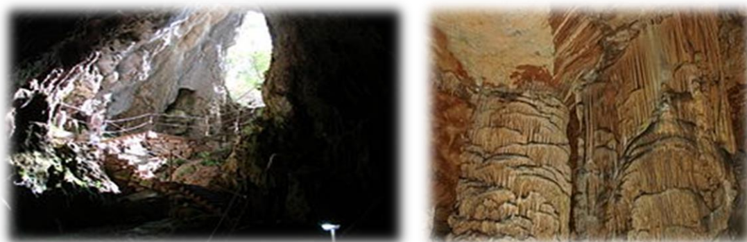
Slika 4.1. Špilja Vranjača

Špilja Vranjača ; špilja smještena u podnožju središnjeg dijela planine Mosor, s njene sjeverne strane, kod sela Kotlenice, na području Dugopolja, kraj Splita. Pristup špilji je moguć iz smjera Dugopolja, a do špilje vodi 300 metara duga makadamska cesta koja se u Kotlenicama, u zaseoku Punde, odvaja od glavne ceste kroz Kotlenice. Ulazna dvorana špilje je bila poznata mještanima Dugopolja još u 19. stoljeću. Drugu dvoranu je 1903. otkrio Stipe Punda, vlasnik zemljišta na kojem se špilja nalazi. Profesor Umberto Girometta zaslužan je za propagiranje ljepota špilje, zbog kojih je otvorena za posjetitelje 1929. godine. Špilja s sastoji od dvije dvorane. Ulazna dvorana nema sigu, a iz nje se kroz mali prirodni hodnik ulazi u drugu dvoranu, prepunu sigastih ukrasa raznih oblika i boja. Druga dvorana obiluje stalaktitima i stalagmitima. Ukupna dužina špiljskih kanala iznosi oko 360 metara objašnjava (Pešić N. 2006. ). Temperatura unutar špilje identična je u svako doba godine i iznosi 15°C. Špilja ima uređene stepenice, konope postavljene duž stepenica i staze za posjetitelje, postavljenu rasvjetu, vrata i nadzornu službu.