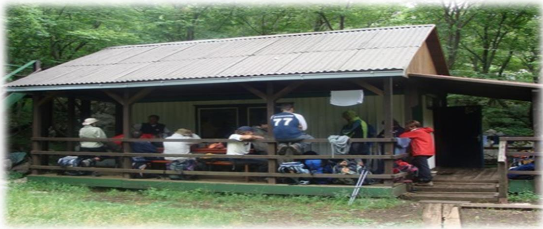
Slika 4.3.6. Planinarsko sklonište Kontejner Mosor

radnim danom zatvoren, planinarsko sklonište Kontejner postalo je važna točka, osobito za one planinare koji žele proći uzduž cijelog Mosora. Osnovu skloništa čini montažni kontejner na koji su poslije dograđeni krov i veranda. Otvoreno je stalno. Ima kapacitet noćenja za 10 osoba.