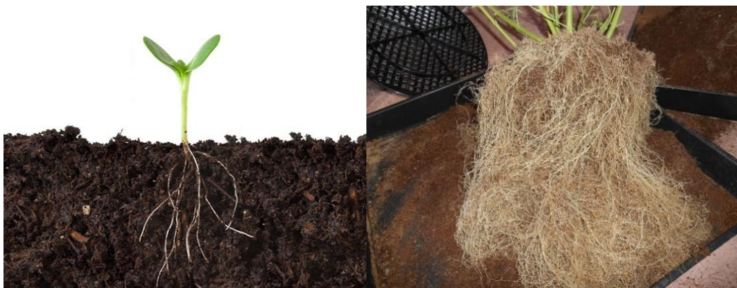
Slika 2.2.1.1. Koriijen u prvoj fazi nakon nicanja (lijevo) i vrlo razvijen koriijenov sustav (desno)