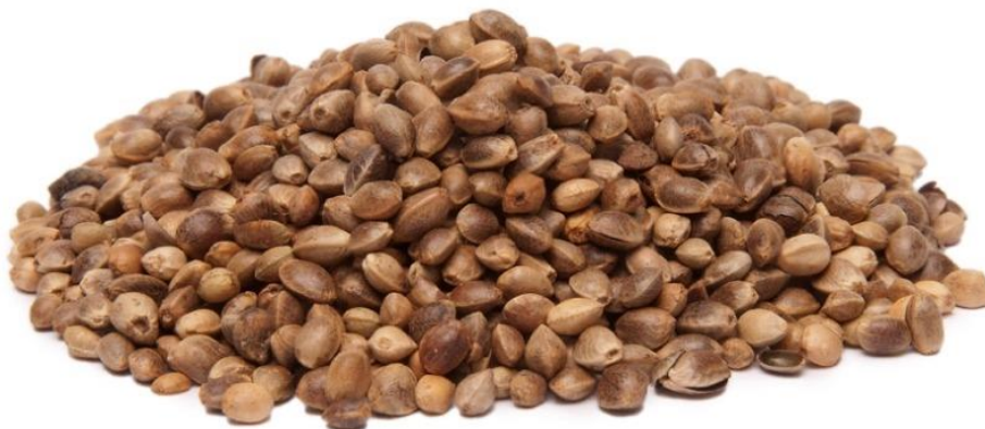
Slika 2.2.5.1. Plod konoplje

Plod konoplje je orašac (Slika 2.2.5.1.), omotan tvrdom ljuskom koja štiti sjeme pa se s agronomskog aspekta smatra sjemenom. Može biti dugačak od 2,5 – 5 mm, širok 2 – 4 mm i visok 2 – 3,5 mm, ovisno o sorti (Butorac, 2009). Plod se sastoji od ljuske ploda, sjemene ljuske, endosperma i klice. Embrio je bijele boje, povijen i potpuno ispunjava unutrašnjost sjemenke. Prema tome, endosperma ima malo ili ništa. Boja ploda ovisi o podrijetlu, zrelosti, sorti itd. Masa 1.000 sjemenki varira od 13 – 25 g ovisno o tipu konoplje (Pospišil, 2013).