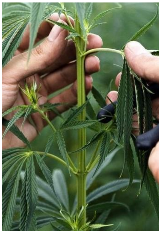
Slika 2.2.2.1. Stabljika konoplje