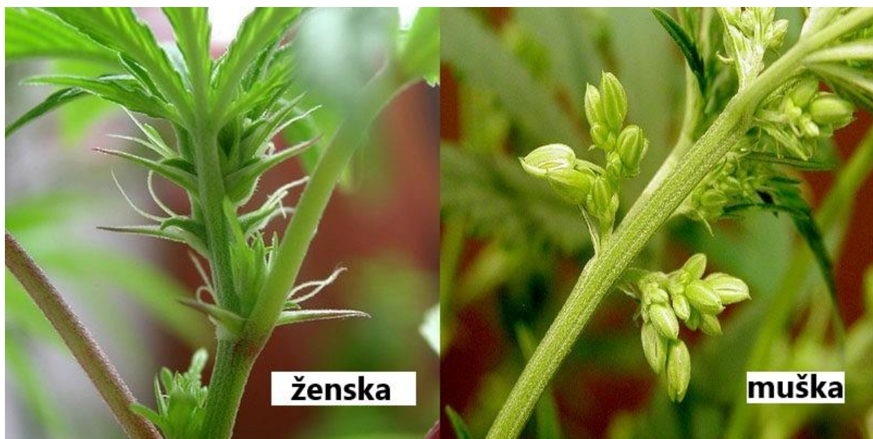
Slika 2.2.4.1. Ženski cvat (lijevo) i muški cvat (desno)

Muške se biljke zovu bjelojke jer imaju manje listova, svjetlijih su stabljika, žutih cvjetova s dugim stapkama, cvat je rahliji, cvjetovi su raspoređeni na vrhovima stabljike, a sastoji se od perigona i pet prašnika. Cvjetovi muških biljaka skupljeni su u cvat metlicu koja se nalazi na vrhu stabljike i postranih grana (Pospišil, 2013). Ženske biljke zovu se crnojke, stabljika im je intenzivnije zelene boje, cvjetovi su sjedeći i smješteni u pazušcima listova, često jedan od dva cvijeta abortira. Cvjetovi zauzimaju gornju trećinu stabljike i čine cvat, a cvijet se sastoji od ovojnog listića, perigona i tučka s dvije njuške (Butorac, 2009). Ženska cvat je robusnija, lisnatija i kompaktnija od muške cvati. U odnosu na muške biljke, ženske cvjetaju istodobno (srednjeruski tip) ili 10 do 15 dana ranije (talijanski tip). Cvjetanje muških biljaka traje 15 do 35 dana, a ženskih do 30 dana. Biljke konoplje srednjeruskog tipa u našim krajevima cvatu već krajem lipnja ili početkom srpnja, dok talijanski tip konoplje počinje cvasti krajem srpnja, a završava početkom kolovoza (Butorac, 2009).