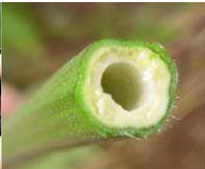
Slika 1.2.2.2. Poprečni presjek stabljike konoplje

Izvor: : https://d3atagt0rnqk7k.cloudfront.net/wp-content/uploads/2017/10/04131150/tips-for-growing-industrial-hemp-1280x800.jpg