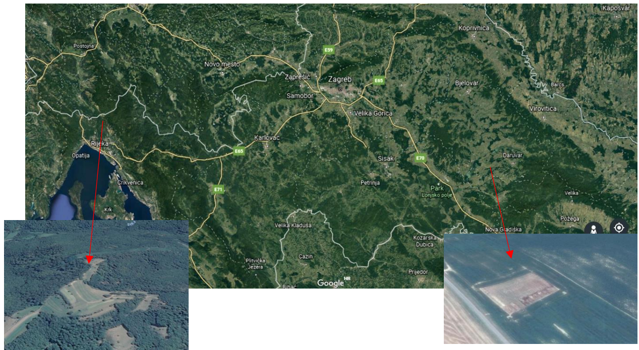
Lokacija 1 (Raša)

Istraživanja koja su korištena za izradu ovog diplomskog rada provedena su 2016. godine u otvorenom stakleniku Zavoda za opću proizvodnju bilja Agronomskog fakulteta Sveučilišta u Zagrebu. Istraživanje je provedeno kako bi se ocijenila sposobnost konoplje ( Cannabis sativa L.) da akumulira teške metale te otkrila mogućnost fitoakumulacije ili fitostabilizacije. U pokusnim posudama za uzgoj konoplje korištene su dva tipa (uzorka) tla. Prvi (alkalno tlo), uzorak tla uzet je u Raši koja se nalazi na istarskom poluotoku (N 45 ° 3', E 14 ° 2', nadmorska visina - 2 m ispod razine mora). Tlo je klasificirano kao glinovita ilovača ili glejno tlo (Bogunović i sur., 2017). Drugi (kiselo tlo) uzorak tla uzet je u blizini Daruvara (N 45 ° 33 '54 .66 ", E 17 ° 01 '43.89", na nadmorskoj visini od 133 m). Na temelju IUSS klasifikacije (2014), ovaj tip tla je definiran kao stagnirajući luvisol (Ćaćić i sur., 2018).