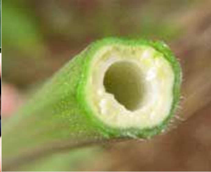
Slika 1.2.2.2. Poprečni presjek stabljike konoplje