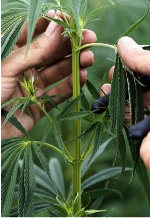
Slika 2.2.2.1. Stabljika konoplje