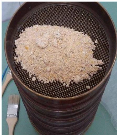
Slika 4.: uzorci smjese na sitima