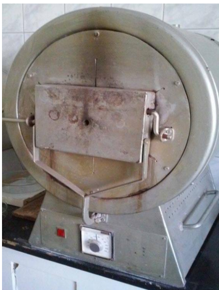
Slika 2.: mikrovalna mufolna peć Milestone, pyro tauch control

Prilikom određivanja kalcija paralelno su rađena po dva uzorka, radi provjere podudarnosti, te slijepa proba. Dobiveni rezultati preračunati su na 100% suhe tvari, te su kasnije korišteni za izračun probavljivosti kalcija.