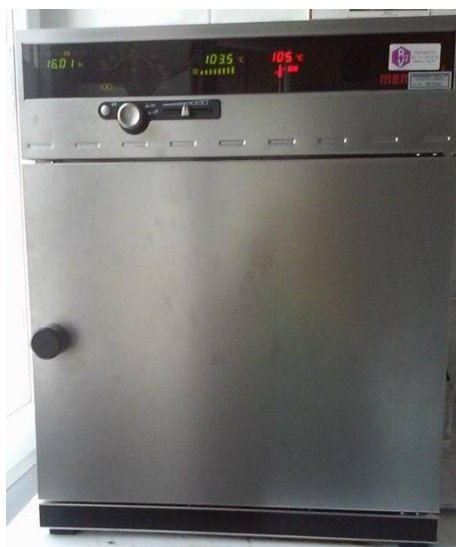
Slika 3.: FOOS Tecator sušionik