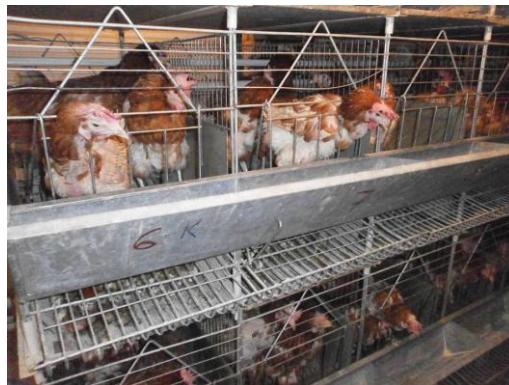
Slika 1.: smještaj nesilica

Izvor: vlastiti izvor, studentica Ivana Cafuk, prosinac 2014