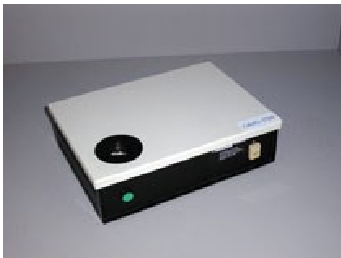
Slika 2. Kolorimetar

Boja svakog ploda je mjerena na najtamnijem te na najzelenijem mjestu ploda. Boja je mjerena pomoću kolorimetra ColorTec-PCM Plus 30mm Benchtop Colorimeter (ColorTec Associates, Inc. Clinton, New Jersey, SAD) (Slika 2.) prema CIE LAB sistemu (CIE, 2008.).