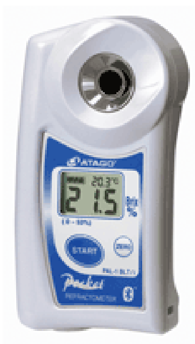
Slika 4. Digitalni refraktometar

Sadržaj topljive suhe tvari izmjeren je digitalnim refraktometrom Atago Pal-1 (Atago Co., LTD., Tokyo, Japan) (Slika 4.). Topljiva suha tvar mjerena refraktometrom je prividna i izražava se kao vrijednost šaroze te se stoga i naziva “prividnim šećerom” iako se u sastav topljive suhe tvari ubrajaju šećeri, organske kiseline, soli i aminokiseline (Voća i sur., 2011.). Postupak se temelji na fizikalnom zakonu loma svjetlosti, koji se događa na granici između dviju tvari različite gustoće. Granica se određuje odnosom brzine prolaza svjetlosti kroz zrak i tekućinu (sok breskve). Lom svjetla očitava se na ljestvici refraktometra od 0-30 %. Na prizmu refraktometra nanese se nekoliko kapi soka, te se pritiskom na gumb pokrene mjerenje. Rezultat je očitavan na zaslonu refraktometra.