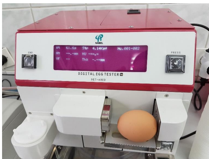
Slika 4.5.3.1. Mjerenje čvrstoće ljuske

Čvrstoća ljuske važna je za normalnu manipulaciju i rukovanje jajima. Čvrstoća ljuske očituje se u sili pod čijim djelovanjem dolazi do pucanja ljuske jajeta. Tijekom trajanja pokusa čvrstoća ljuske mjerena je pomoću automatskog analitičkog uređaja NABEL - Digital Egg Tester DET-6000 (Slika 4.5.3.1.). Uređaj mehanički djeluje silom na ljusku jajeta, sve dok ne dođe do puknuća. Sila koja je bila potrebna za lomljenje ljuske prikaže se na ekranu uređaja (kgf).