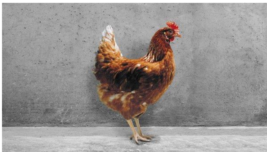
Slika 2.5.3.1. Prikaz Hisex brown nesilice

zbrinute i hranjene od perioda valjanja do nesivosti. Postizanjem idealne mase tijela za svaki tjedan života jedini je način da se dobije željeni rast kokoši i razvoj spolnog sustava. Ovaj hibrid tolerantan je na mnoge uvjete, ali najveća nesivost i kvaliteta postižu se kada se kokoš drži u optimalnim uvjetima. Ukoliko ju se smjesti u premali prostor doći će do smanjene proizvodnje jaja, a u slučaju prevelikog prostora dolazi do velike konzumacije hrane, te energetske potrošnje (Haider 2014.).