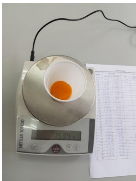
Slika 4.5.1.2. Određivanje mase žumanjka