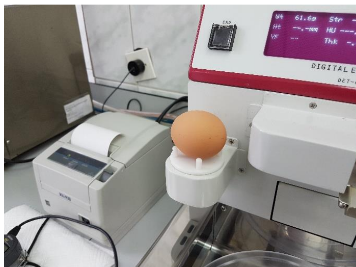
Slika 4.5.1.1. Mjerenje ukupne mase jaja na analitičkom uređaju NABEL - Digital Egg Tester DET-6000