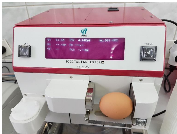
Slika 4.5.3.1. Mjerenje čvrstoće ljuske

Čvrstoća ljuske važna je za normalnu manipulaciju i rukovanje jajima. Čvrstoća ljuske očituje se u sili pod čijim djelovanjem dolazi do pucanja ljuske jajeta. Tijekom trajanja pokusa čvrstoća ljuske mjerena je pomoću automatskog analitičkog uređaja NABEL - Digital Egg Tester DET-6000 (Slika 4.5.3.1.). Uređaj mehanički djeluje silom na ljusku jajeta, sve dok ne dođe do puknuća. Sila koja je bila potrebna za lomljenje ljuske prikaže se na ekranu uređaja (kgf).