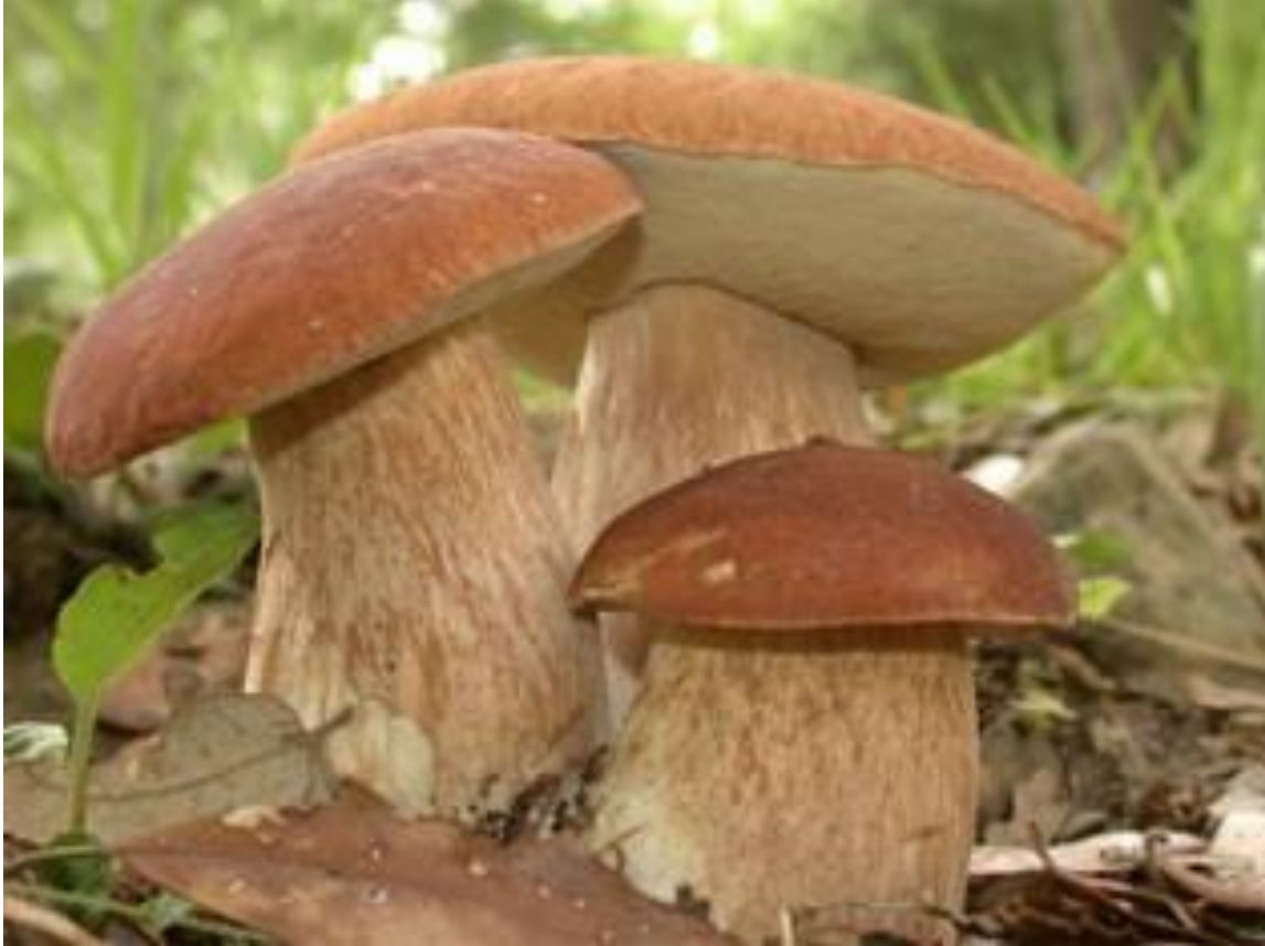
Slika 2.3.2.1. Ljetni vrganj