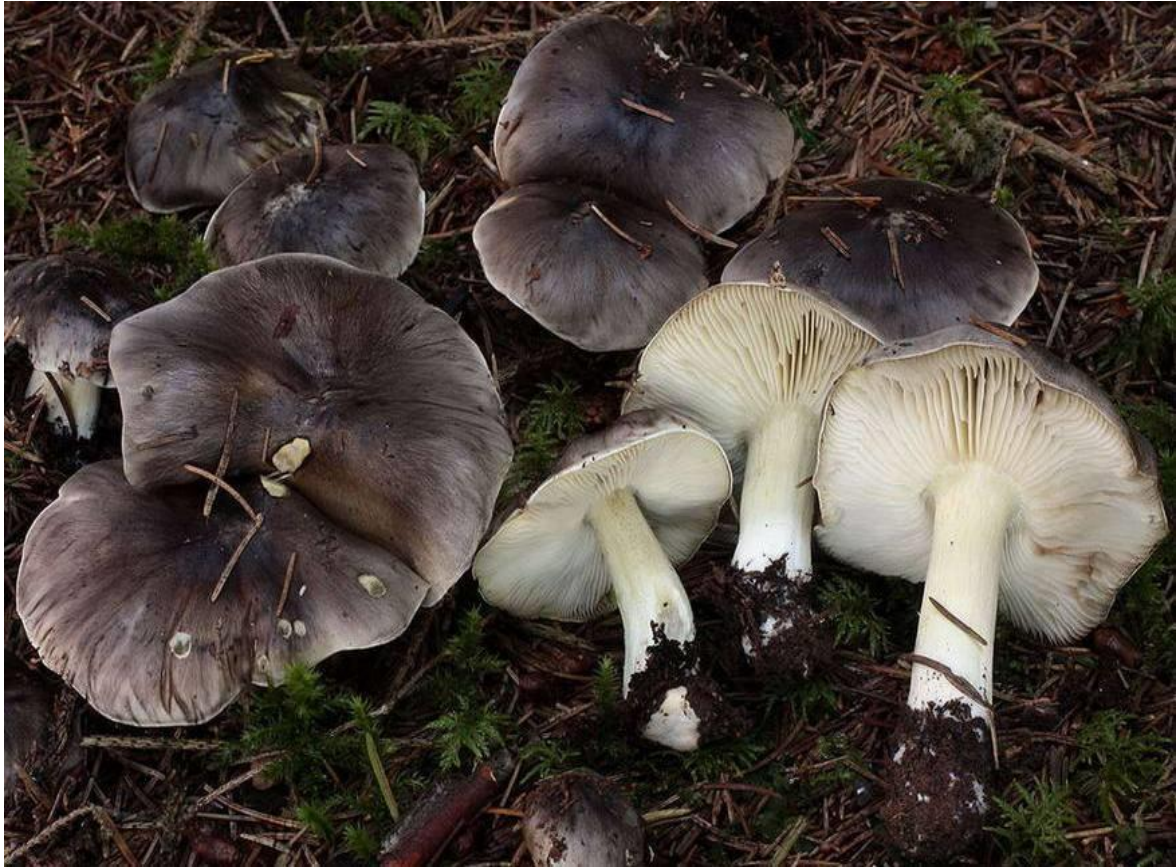
Slika 2.3.2.4. Najbolja vitezovka