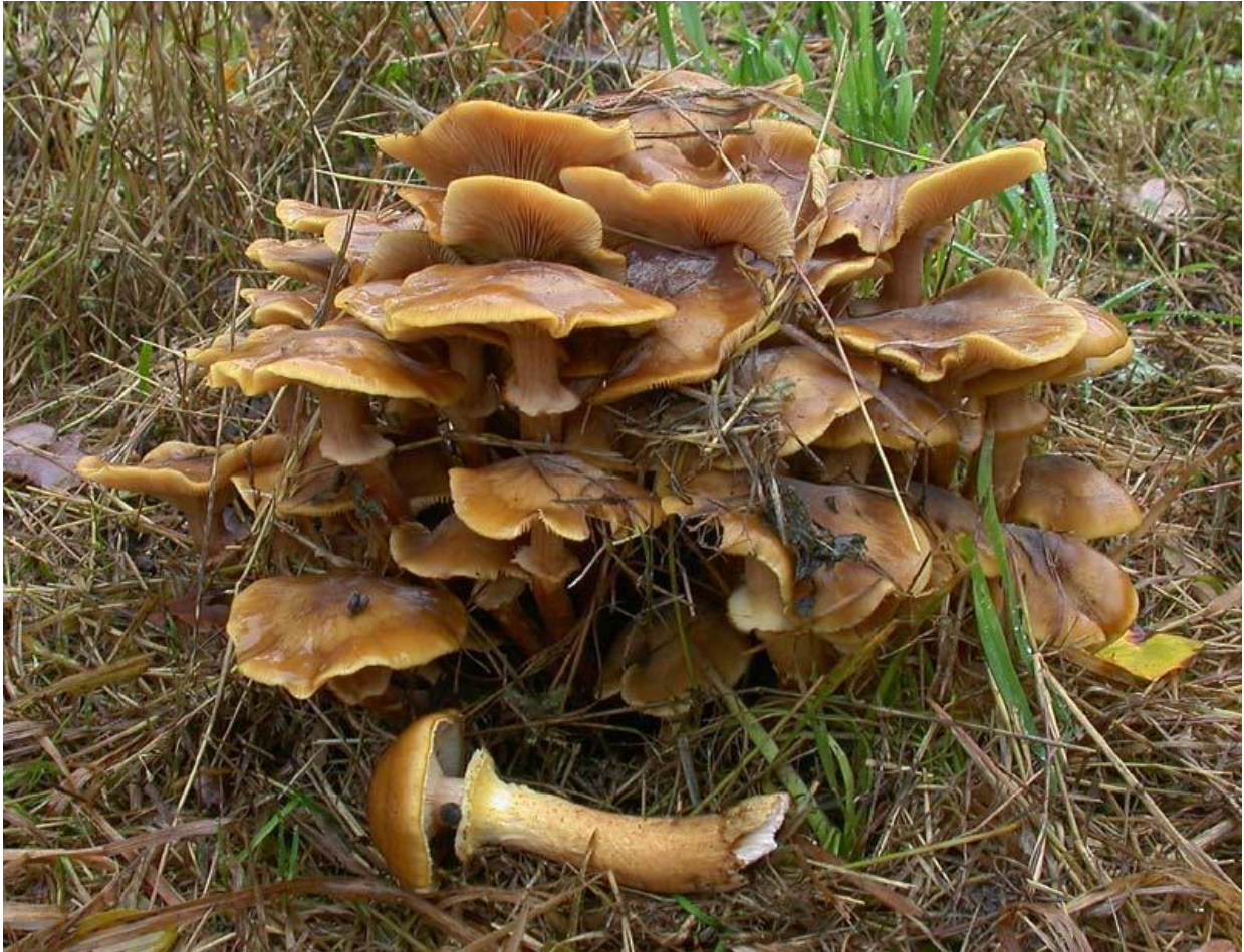
Slika 2.3.1.2. Medena puza