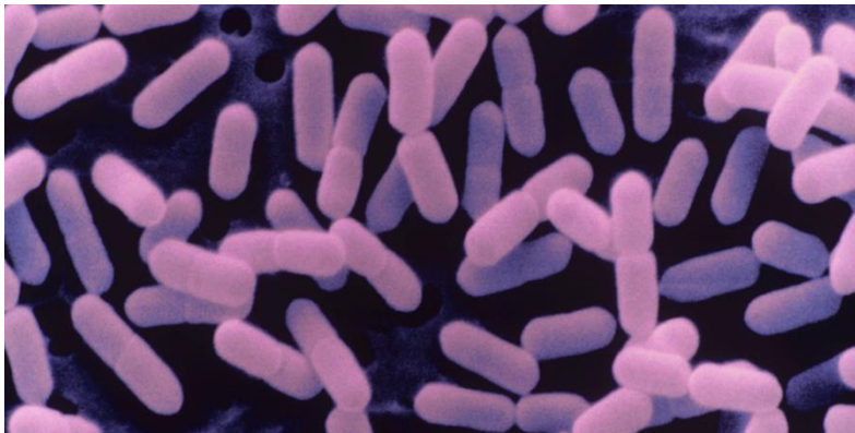
Slika 1. Listeria monocytogenes

L. monocytogenes je štapićasta, fakultativno anaerobna bakterija. Pripada skupini gram pozitivnih bakterija (Slika 1). To su mikroaerofilne bakterije koje rastu u uvjetima smanjene koncentracije kisika. Ne proizvode spore, mogu se razmnožavati unutar velikog raspona pH (4,3 – 9,6) i temperature (1 – 45 °C). Uspijeva u supstratima od blago kiselih do alkalnih pH vrijednosti, ali ne i u vrlo kiselom okruženju. Opseg vrijednosti pH u okviru kojih se može razvijati ovisi o supstratu i temperaturi.