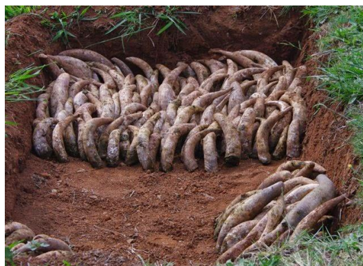
Slika 2.3.1.1. Način zakapanja rogova pri izradi biodinamičkog pripravka 500

Gnoj iz kravljeg roga važan je dio biodinamičke poljoprivrede. Izrađuje se od kravljeg gnoja kojim se puni kravljji rog te se potom ukapa u tlo, gdje se ostavlja tijekom šest mjeseci u hladnom dijelu godine. Rogovi se u tlu postavljaju uspravno (slika 2.3.1.1.) kako bi se u njima izbjeglo prekomjerno nakupljanje vlage. Nakon iskapanja rogova i vađenja preparata dobiva se tamna zrnata supstanca koja sadrži populaciju korisnih mikroorganizama u mnogo većem broju od običnog komposta ili dobrog tla. Preparat se nakon iskapanja može koristiti ili skladištiti (Waldin, 2016).