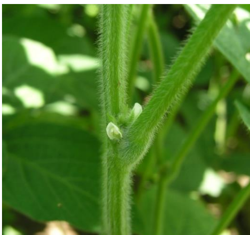
Slika 9. Sorta soje Gabriela