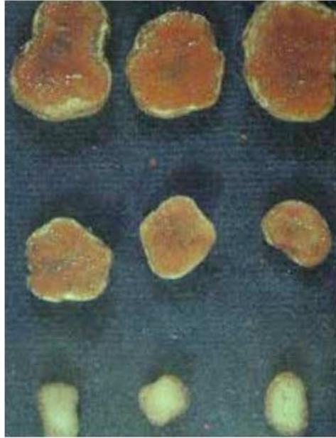
Slika 1. Učinkovite (prvi red odozgo), manje učinkovite i neučinkovite kvržice