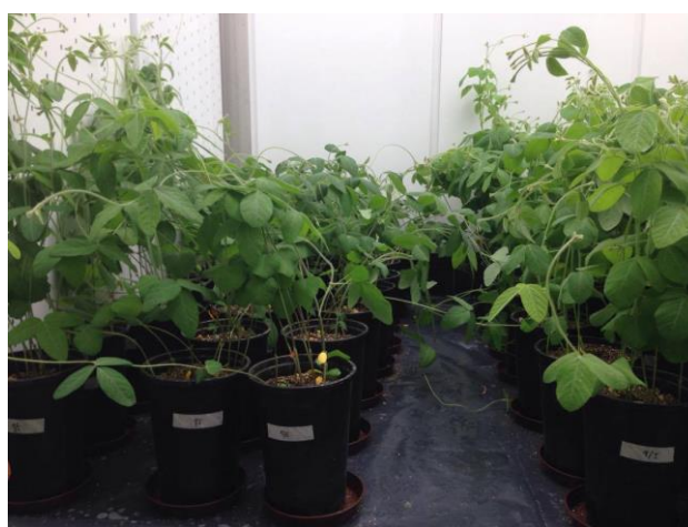
Slika 7. Vegetacijski pokus u komori rasta s inokuliranom sojom u fazi pune cvatnje (27.03.2017.)

Svi rezultati vegetacijskog pokusa statistički su obrađeni analizom varijance (ANOVA) prema modelu slučajnog blokno rasporeda dvofaktorijalnog pokusa (sorta x soj).