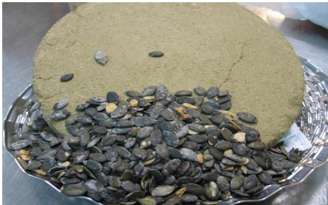
Slika 3. Bučine sjemenke i pogača (Brkan, 2013).

uče je zaštićena ljuskom. Ovisno od strukture i udjela celuloze u ljusci, postoje dvije vrste koštice: sa ljuskom i bez ljuske (golica). Kod koštice golice umjesto čvrste, bijele celulozne ljuske na jezgru prijanja tanka opna tamnozeleno boje. Oba tipa koštice koriste se u proizvodnji ulja, međutim golica je pogodnija jer daje veći prinos ulja i pogaču bolje kvalitete. Isto tako obje vrste imaju visok prinos svježeg ploda i suhog zrna, a sadržaj ulja u jezgri golice se kreće od 45 do 49%.