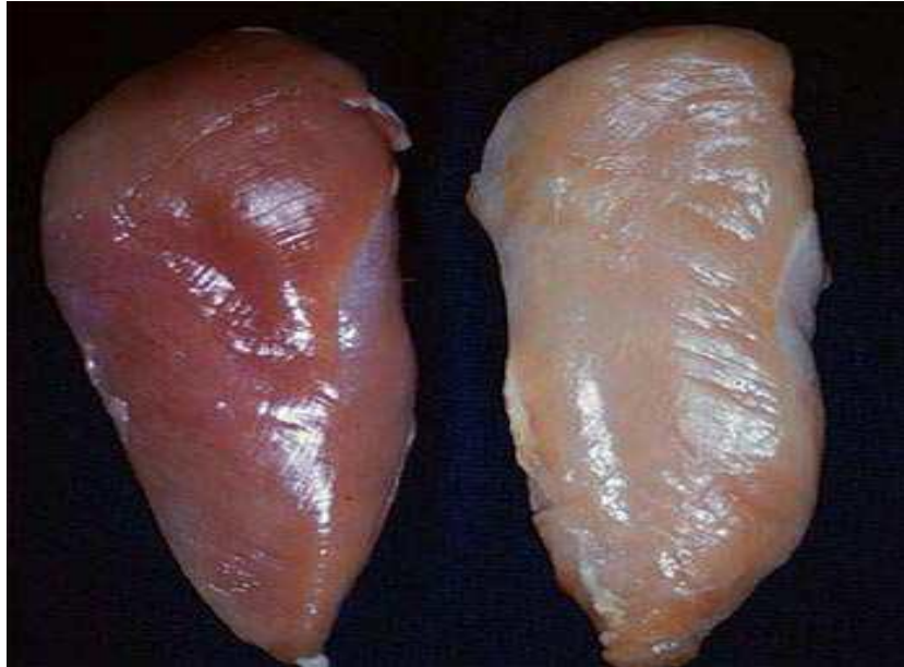
Slika 2. Tamna i svijetla boja pilećih prsa

Utjecaj pH na boju mesa se očituje u promjeni sposobnosti proteina da vežu vodu, što direktno utječe na strukturu i sposobnost refleksije svjetlosti (Allen i sur., 1998). Posebice je boja mesa bitna kod potrošača, jer svaki potrošač prvo vizualno procjeni namirnicu i to utječe na njegovu odluku o kupnji, pri čemu očekuju da svježije meso prsa ima svijetlu, blijedo ružičastu boju, a meso bataka sa zabatacima tamno ružičastu boju (Slika 2.) (Janječić, 2006). Takvi primjeri su najčešći prilikom kupovine mesnih proizvoda.