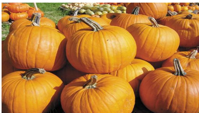
Slika 2. Plod buče (Kalšan, 2015).

Buča se obično se uzgaja kao zasebni usjev, ali se može uzgajati i kao međuusjev, najčešće u kukuruzu. Španring (1980) navodi da se u tom slučaju najveći prinosi postižu ako se buče siju uz kukuruz za proizvodnju hibridnog sjemena. Prirodni uvjeti kod nas omogućuju izvanredno uspješan uzgoj buča namijenjenih preradi u jestivo ulje. Ovako dobiveno ulje ima specifičan miris, okus, te sadrži izuzetno vrijedne kemijske i ljekovite sastojke pa se zbog toga ubraja u „ delikatesno ulje “. U Europi je značajan uzgoj buče u Austriji, Rumunjskoj, Mađarskoj, Češkoj, Slovačkoj i Sloveniji. Pred kraj prošlog stoljeća, prema statističkim podacima, u Hrvatskoj je uzgoj buče (isključivo na privatnim posjedima) sve više stagnirao kako zbog neprimjerene tehnologije proizvodnje i dorade sjemenki, tako dijelom i zbog tržišnih uvjeta (Sito i sur., 1998).