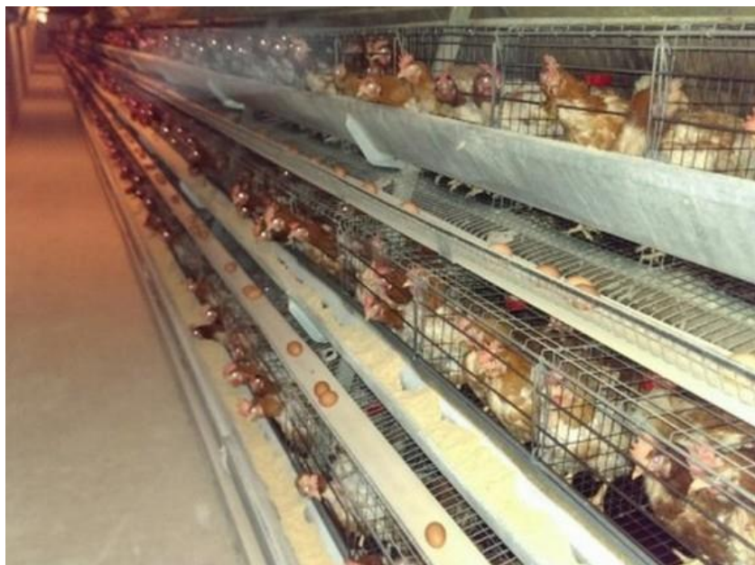
Slika 2. Kavezni način uzgoja