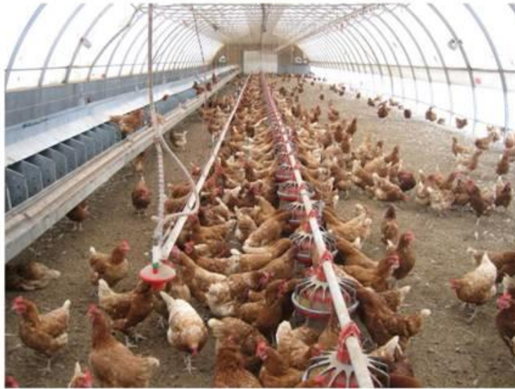
Slika 3. Podni način držanja