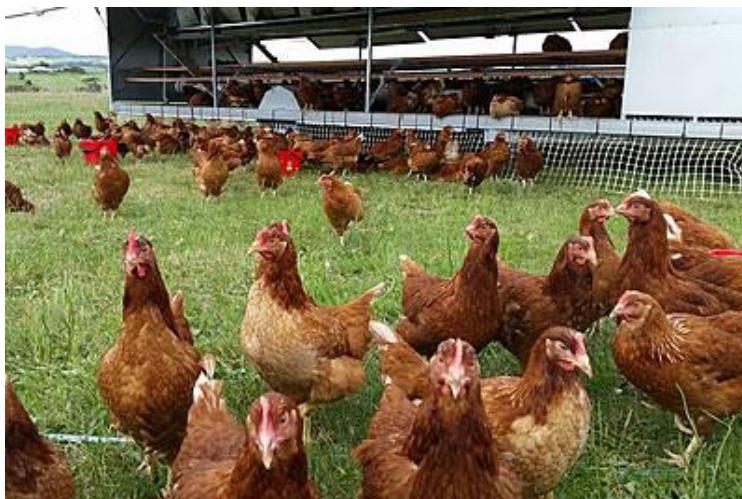
Slika 4. Slobodno držanje