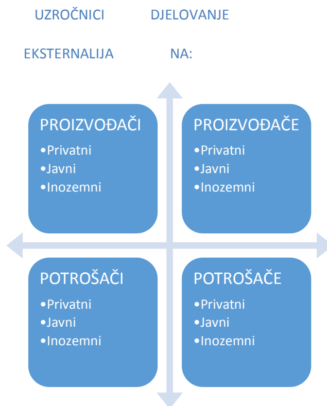
Slika 1. Uzročnici eksternalija i njihovo djelovanje

Eksternalije mogu nastati proizvođačima, potrošačima, ili potrošačima i proizvođačima. One nastaju u svim procesima proizvodnje i potrošnje, jer se inputi u procesu proizvodnje najčešće, u utrživa dobra ne pretvaraju u stopostotnom iznosu, a kućanstva opet ne mogu potrošiti sva proizvedena dobra. Glavni uzročnici eksternalije prikazani su slikom 1.