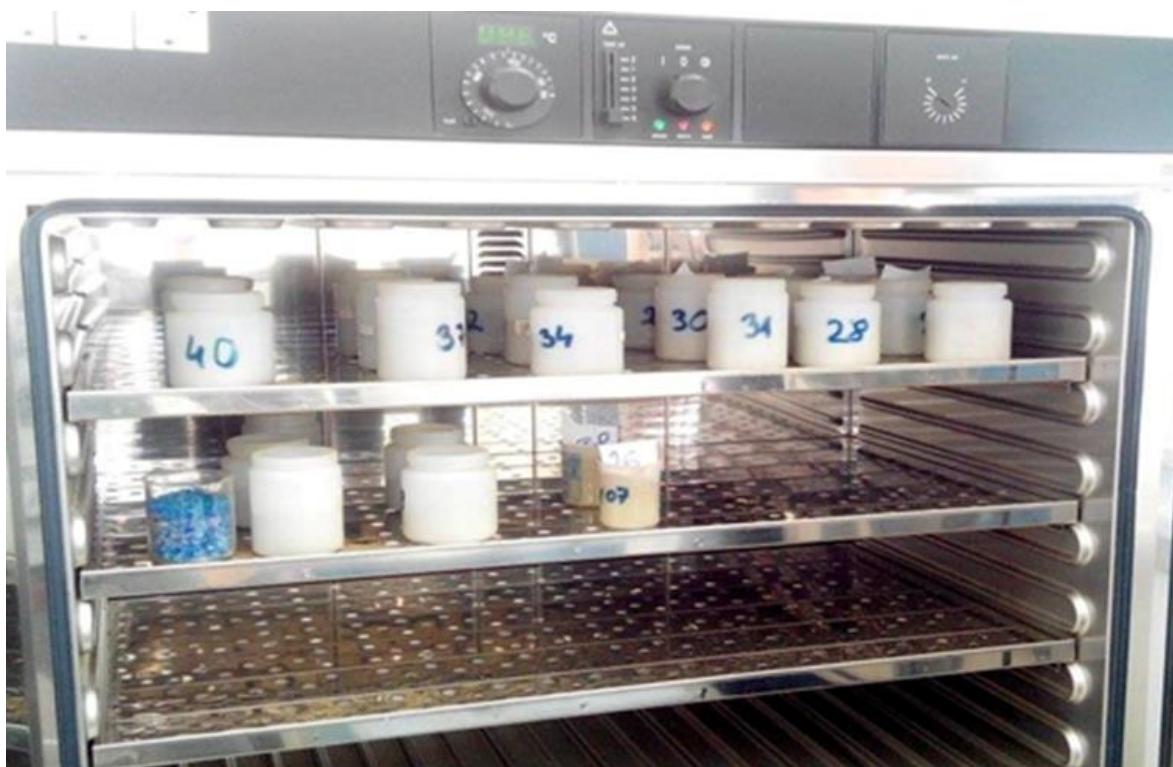
Slika 1. Uzorci za skeniranje u sušioniku

Dostavna vlaga ( \text{g kg}^{-1} svježeg uzorka) je utvrđena sušenjem uzoraka u sušioniku s ventilatorom (tvrtke ELE International) na temperaturi od 60^\circ\text{C} do konstantne mase uzoraka (slika 1). Ovako osušeni uzorci su samljeveni na veličinu čestica od 1 mm korištenjem mlina čekićara tvrtke Christy (Model 11) i dalje korišteni za spektrofotometrijsku analizu.