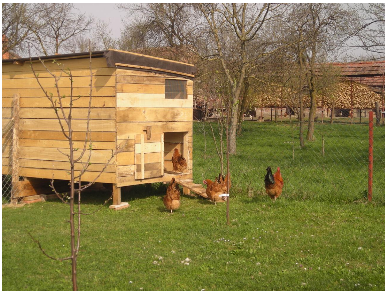
Slika 6. Izgled drvenog objekta

U istraživanju je korišteno 220 kokoši hrvatica i 22 pijetla. Istraživanje je provedeno na 11 obiteljskih gospodarstava sa područja grada Slatine. Formirana su 22 jata na način da su na svakom gospodarstvu formirana po dva jata (jedan pijetao i deset kokoši hrvatica). Na svakom je gospodarstvu bio izgrađen drveni objekt (Slika 6) za odvojeno držanje dvaju jata, a svako je jato na raspolaganju imalo i zasebnu zatravljenu površinu od 100 m 2 koja je kokošima služila za slobodno kretanje i napasivanje.