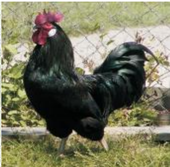
Slika 3. Crni soj

Jarebičasto-zlatni soj - Jarebičasto-zlatni pijetao ima narančastozlatni vrat i bočna pera sedlišta, dok su im leđa, gornji dio krila i letna pera sjajne tamnocrvene boje. Prsa, trbuh, rep i poprečna krilna crta crne su boje metalnozelenog sjaja. Kokoši imaju narančastozlatni vrat dok je ostatak tijela pokriven perjem koje je simetrično obrubljeno okernožutom i sivosmeđom bojom, a vrh repa crne je boje (Slika 4).