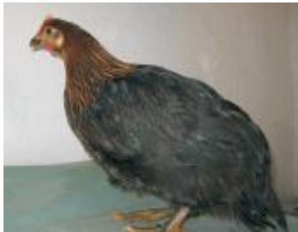
Slika 5. Crno-zlatni soj

Prepoznajući značaj kokoši hrvaticice kao izvorne pasmine peradi Sabor Republike Hrvatske donio je odluku o isplati novčanih poticaja za svaku uzgojno valjanu životinju. Djelatnici Hrvatske poljoprivredne agencije (HPA) vrše umatičavanje rasplodnih jata kojeg čini jedan pijetao i do deset kokoši istog soja, a za svaku je rasplodnu životinju moguće ostvariti novčani poticaj u iznosu od 60,00 kn. Uzgajivači su dužni umatičeno jato držati u uzgoju godinu dana, pratiti njihove proizvodne pokazatelje te ih u obliku očevidnika dostavljati u HPA. Ako na gospodarstvu ima umatičeno više jata kokoši hrvatica onda se moraju držati fizički odvojeno da bi se njihovi proizvodni rezultati mogli pratiti zasebno. U 2005. godini u Hrvatskoj je bilo oko 2000 jedinki. Tijekom 2008. godine upisano je 35 rasplodnih jata kokoši hrvaticice sa 361 kljunova, a tijekom 2009. godine registrirano je 40 rasplodnih jata s 389 kljunova. Izbor matičnih životinja provode djelatnici HPA-e, kad su životinje stare najmanje 18 tjedana. Sve rasplodne muške i ženske jedinke obilježavaju se trajnim nožnim prstenom s utisnutim matičnim brojem (HPA). U Tablici 5 prikazan je broj umatičenih kokoši Hrvatica po županijama u Republici Hrvatskoj u 2008., 2009. i 2010. godini.