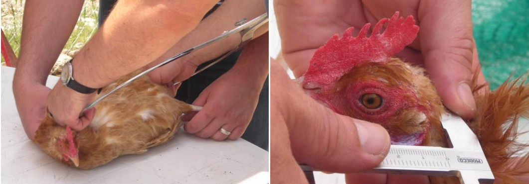
Slika 7. Utvrđivanje tjelesnih izmjera kokoši

Cost benefit analizom na kraju istraživanja određeni su ekonomski pokazatelji ovakvog načina držanja kokoši nesilica. Osim doprinosa pokrića proračunato je vrijeme povrata ulaganja, te ekonomičnost, rentabilnost i proizvodnost uzgoja na obiteljskoj farmi preporučenog kapaciteta od ukupno 250 nesilica i pijetlova. Svi dobiveni podaci obrađeni su statističkim programom (SAS, 2007).