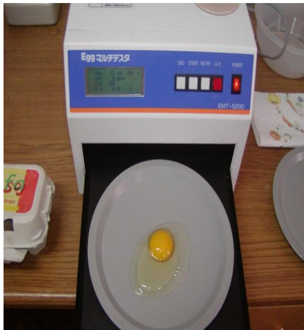
Slika 9. Instrumentalno određivanje kvalitete jaja

Radi utvrđivanja fenotipskih karakteristika utvrđene su tjelesne izmjere kokoši i pijetlova (Slika 7). Utvrđivanje fenotipskih obilježja provedeno je po metodi koju je opisao Kodinetz (1940) na način: