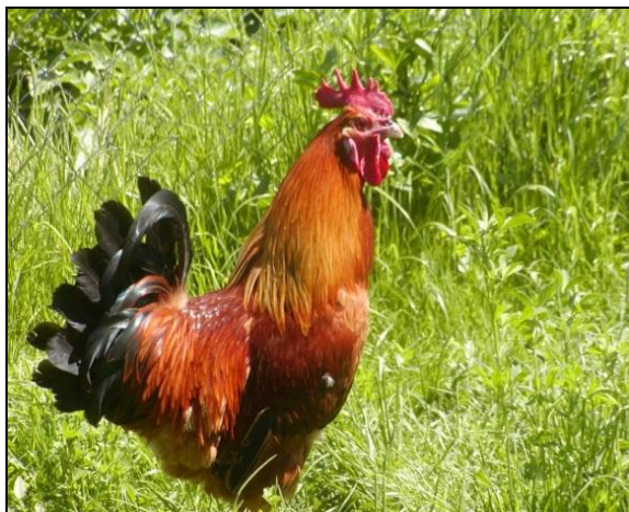
Slika 4. Jarebičasto-zlatni soj