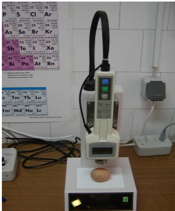
Slika 8. Uređaj za određivanje čvrstoće ljuske