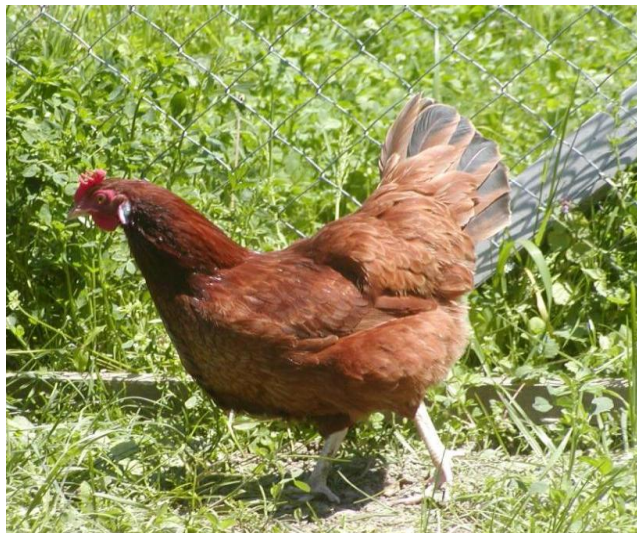
Slika 2. Crveni soj

Crni soj - Crni soj karakterizira posve crna boja perja, metalnog sjaja i kod kokoši i kod pijetlova (Slika 3).