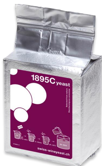
Slika 4. Kvasac 1895C