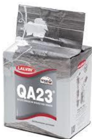
Slika 3. Kontrolni kvasac QA23