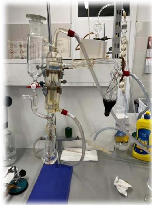
Slika 6. Metoda po Paulu (07.03.2023)

tikvici, gdje je alkohol izdvojen iz vina kao destilat, a njegova specifična težina uspoređena je s vodom na 20°C kako bi se dobila vrijednost.