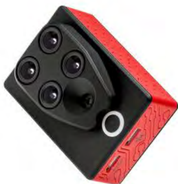
Slika 3. Multispektralna kamera Parrot Sequoia

Ovo je jedna od naprednijih multispektralnih kamera, a može se integrirati na većinu dronova. Snima u pet pojaseva (plavi, zeleni, crveni, crveni rubni i bliski infracrveni), a dobiveni se podatci mogu koristiti za analizu usjeva, kao i za donošenje odluka o vremenu žetve (COPTRZ, 2022.).