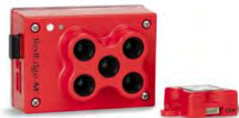
Slika 2. Multispektralna kamera MicaSense RedEdge