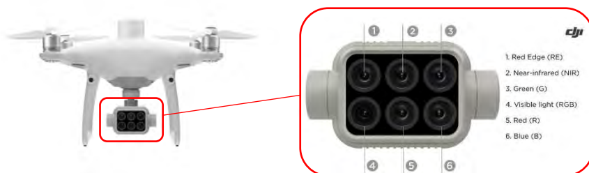
Slika 4. Dron s integriranom multispektralnom kamerom DJI P4 Multispectral

Parrot Sequoia kamera je opremljena multispektralnim i sunčanim senzorom, posebno dizajnirana za korištenje na svim vrstama dronova. Pruža točne podatke o zdravstvenom stanju biljaka i omogućuje optimalnu primjenu gnojiva i sredstava za zaštitu bilja (COPTRZ, 2022.).