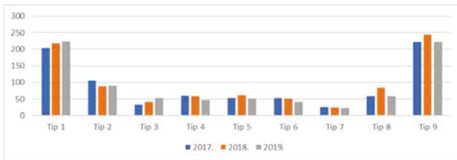
Grafikon 1. Broj gospodarstava u analiziranom uzorku