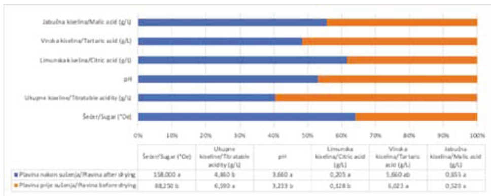
Grafikon 1. Osnovni kemijski parametri u grožđu sorte 'Plavina' prije i nakon prosušivanja Graph1. Basic chemical parameters in 'Plavina' grapes before and after drying

Osnovni kemijski parametri sorte 'Plavina' se značajno razlikuju prije i poslije sušenja, a podaci su prikazani na grafikonu 1. Uslijed prosušivanja došlo je do povećanja u sadržaju organskih kiselina i sadržaja šećera. Razlog povećanja je koncentriranje sadržaja bobice uslijed gubitka vode iz bobica.