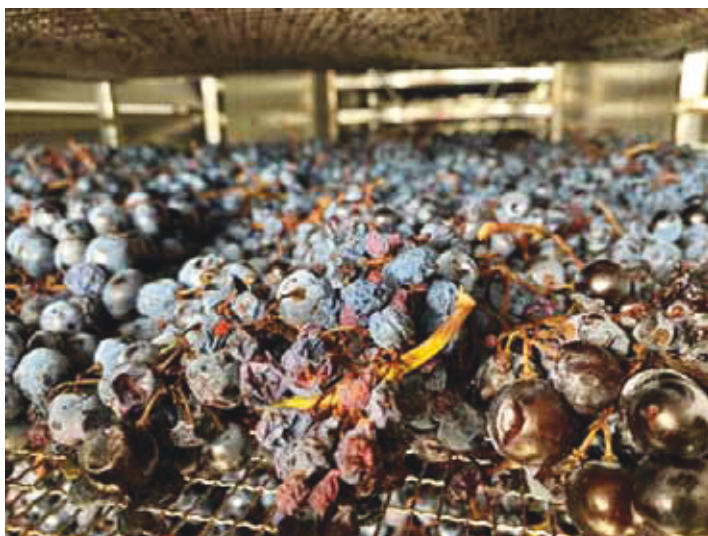
Slika 1. Prosušivanje grožđa u komorama Figure 1. Drying of grapes in chambers

Od osnovnih fizikalno-kemijskih svojstava određeni su: sadržaj šećera ( ^{\circ} Oe), ukupna kiselost (g/L kao vinska) i pH vrijednost (pH) prema OIV metodama (OIV, 2019)