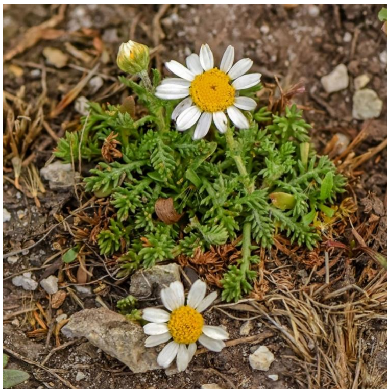
Slika 2 Chamomilla recutita (L.) Rauschert

Eterično ulje kamilice često se koristi u aromaterapiji zbog svojih sedativnih svojstava. Dodavanje nekoliko kapi ulja kamilice u difuzor može pomoći u stvaranju smirujuće atmosfere koja pogoduje meditaciji. Inhalacija pare kamilice može pomoći u smanjenju stresa i tjeskobe, čime se poboljšava sposobnost fokusiranja tijekom meditacije. Konzumacija čaja od kamilice prije meditacije može pomoći u opuštanju tijela i uma. Priprema kupke s dodatkom cvjetova kamilice ili nekoliko kapi ulja kamilice može pomoći u opuštanju mišića i smanjenju stresa. Ova praksa može biti posebno korisna prije meditacije kako bi se postiglo stanje opuštenosti. Svijeće i tamjan s mirisom kamilice mogu se koristiti tijekom meditacije kako bi se stvorila umirujuća atmosfera. Masaža s uljem kamilice također može pomoći u smanjenju stresa i tjeskobe (McKay i Blumberg 2006.).