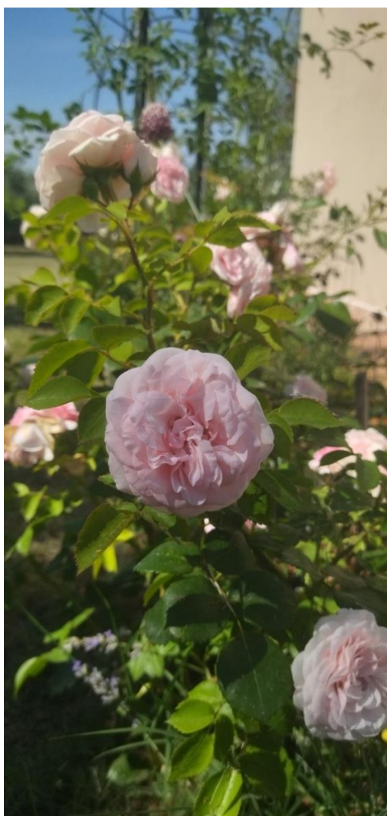
Slika 7 Rosa x damascena Mill.

Miris damask ruže često se povezuje s ljubavlju, ljepotom i duhovnom uzvišenošću. U književnosti se često opisuju meditativni rituali koji uključuju mirisne elemente poput esencijalnih ulja ili cvjetnih voda, među kojima je i damask ruža jedna od najcjenjenijih zbog svog blagog i opuštajućeg mirisa koji se koristi u meditaciji (Boskabady i sur. 2011.). Grci su zacijelo spravljali ružino ulje od latica damašćanske ruže nekoliko stoljeća prije Krista. Kasnije su rimljani naredili da se ova ruža uzgaja u ogromnim količinama u Egiptu kako bi poslužila kao dodatna atrakcija njihovim banquetima. Tijekom jedne takve gozbe nekoliko se gostiju doslovce ugušilo kad je po njima poput vodopada počelo padati mnoštvo latica (Vermeulen 2003.)