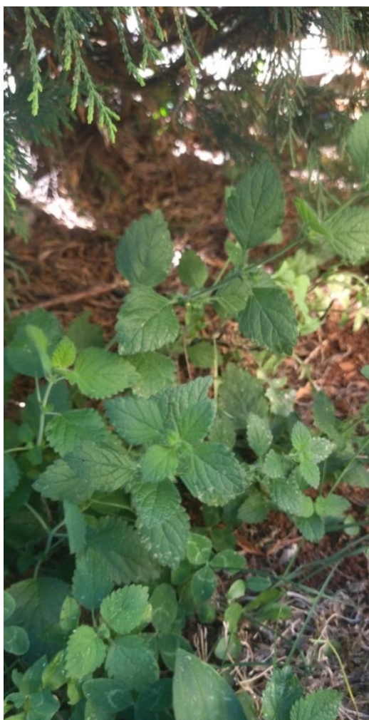
Slika 6 Melissa officinalis L.

Melisa se tradicionalno koristi zbog svojih umirujućih svojstava. Njezin miris može imati pozitivan utjecaj na koncentraciju i jasnoću uma tijekom meditacije, pomažući korisnicima da lakše uđu u stanje meditativne svijesti. Koristiti se na različite načine u meditaciji, primjerice kao mirisne štapiće, esencijalna ulja ili čaj koji se pije prije meditacije radi opuštanja (Kennedy i sur., 2004.). U povijesti melisa je bila cijenjena zbog svojih ljekovitih svojstava i smirujućeg utjecaja na živčani sustav. Stari Rimljani koristili su je kao sredstvo za opuštanje i podizanje raspoloženja, što je također vrijedno u meditativnom kontekstu (Cases i sur. 2011.).