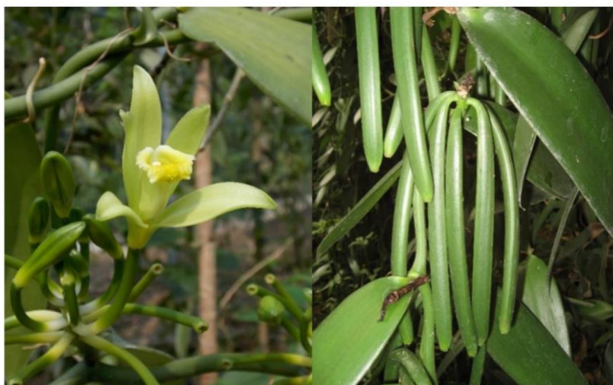
Slika 10 Vanilla planifolia Andrews.

Vanilija je posebna biljka jer njezina karakteristična aroma ne dolazi iz eteričnih ulja, već iz kristala koji se formiraju na površini mahune tijekom procesa fermentacije. Ti kristali sadrže vanilin, spoj koji daje vaniliji njezin prepoznatljiv okus i miris (Wildwood 2006.). Miris vanilije može duboko utjecati na osjetila i potaknuti osjećaje opuštenosti i ugone. U kontekstu meditacije, vanilija se može koristiti za poticanje dubokog opuštanja i fokusiranja uma. Njezina sposobnost stvaranja harmoničnog okruženja može pomoći praktičarima meditacije da postignu željeno stanje unutarnje mirnoće i koncentracije. U književnosti, vanilija se često koristi kao simbol ugodnosti i emotivnih stanja. Osim toga, vanilija ima bogatu povijest upotrebe u različitim kulturama kao simbol ljubavi, mira i duhovne harmonije, što dodatno pojačava njezinu važnost u duhovnim i emotivnim praksama (Rosean 2005.).