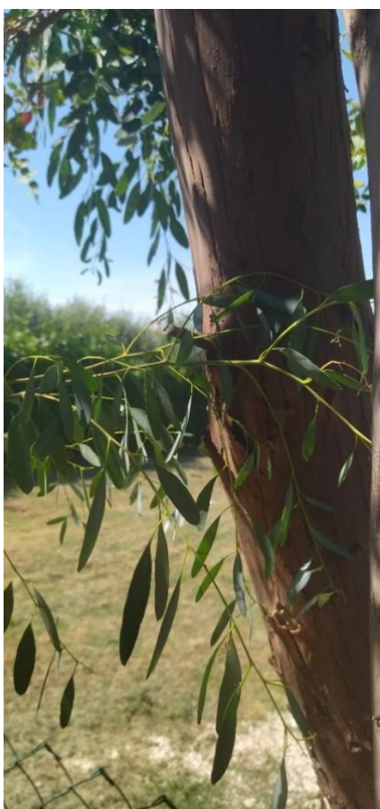
Slika 5 Eucalyptus globulus Labill.

Eukaliptusovo eterično ulja se često koristi u aromaterapiji zbog svojih svojstava koja pomažu u smanjenju stresa i napetosti. Tijekom meditacije, ovo može biti korisno za postizanje dubljeg stanja opuštenosti. Također ima i antibakterijska svojstva koja mogu pomoći u pročišćavanju zraka u prostoru gdje se meditira, što može doprinijeti boljoj koncentraciji i udobnost. Upotreba eukaliptusa u meditaciji može potaknuti osjećaj povezanosti s prirodom (Mojay 2006.).