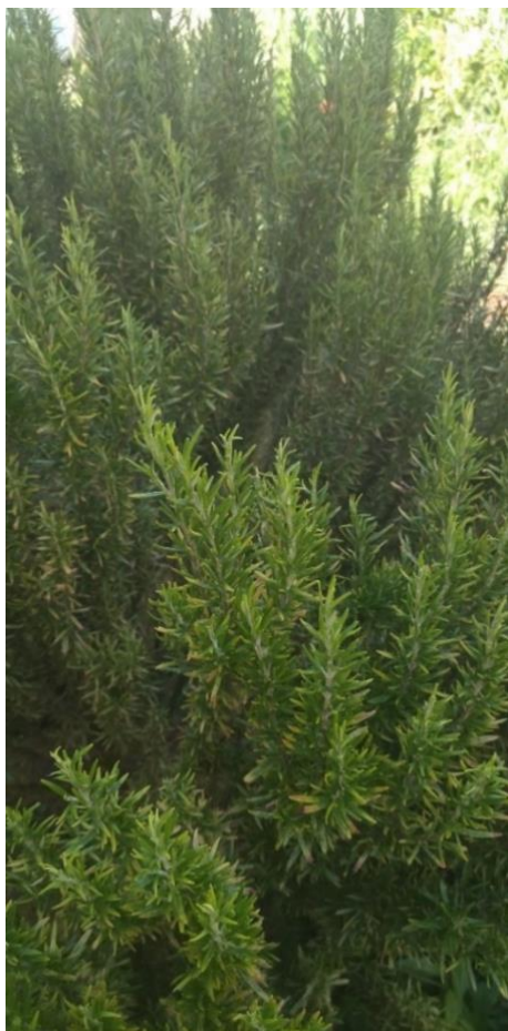
Slika 8 Rosmarinus officinalis L.

Ružmarin se tradicionalno povezuje s poboljšanjem pamćenja. U mnogim kulturama smatra se simbolom ljubavi, vjernosti, sjećanja i smirenosti, što ga čini prikladnim dodatkom meditativnim praksama. Eterično ulje ružmarina često se koristi u aromaterapiji za poticanje koncentracije i mentalne budnosti. Ove osobine mogu biti korisne tijekom meditacije kako bi se postigla dublja fokusiranost i unutarnji mir. U nekim duhovnim tradicijama, ružmarin se koristi zbog čišćenja i zaštite prostora od negativne energije. Prema nekim istraživanjima, miris ružmarina može poboljšati mentalne funkcije. Ove teorije podržavaju ideju da upotreba ružmarina ili njegovog mirisa može pomoći meditantima da lakše postignu stanje duboke koncentracije (Rosean 2005.).