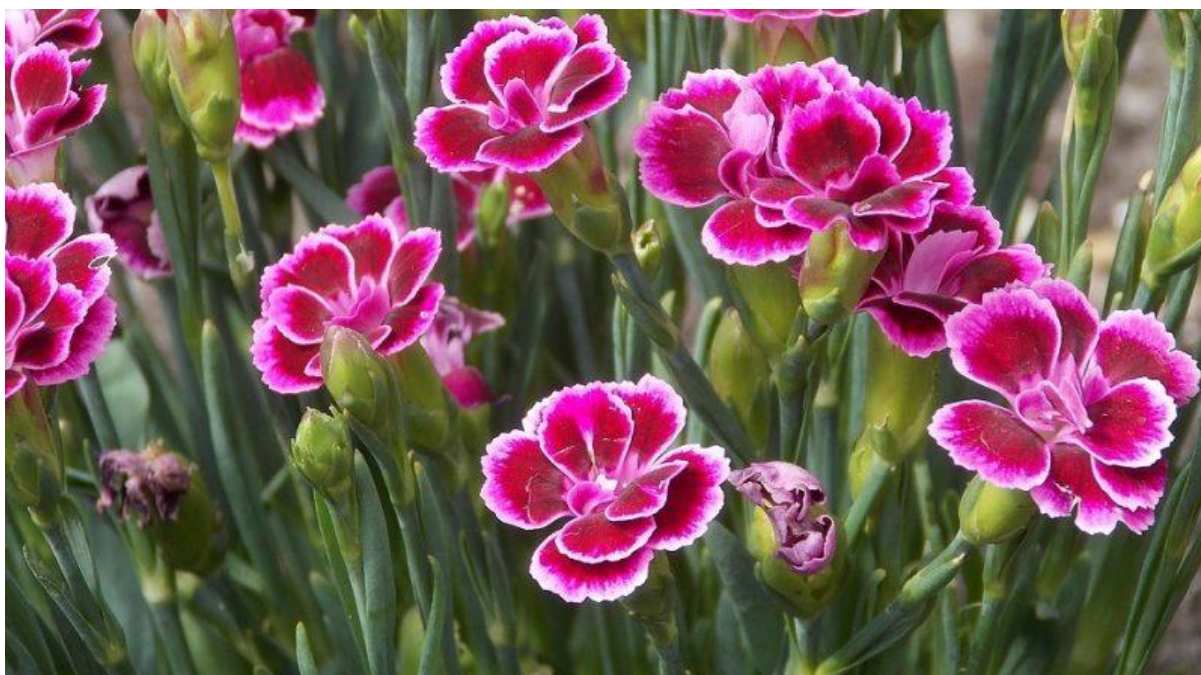
Slika 4 Dianthus caryophyllus L.

Karanfil se često povezuje s ljubavlju, čistoćom i predanošću. U meditativnim praksama, karanfil može simbolizirati srčanu čakru i pomoći u otvaranju i balansiranju emocija. U nekim kulturama, karanfili se koriste u duhovnim ritualima i ceremonijama za pročišćavanje prostora i stvaranje mirnog okruženja pogodnog za meditaciju. Njegov miris može pomoći u smirivanju uma, smanjenju stresa i tjeskobe, što je korisno tijekom meditacije. Zato dodavanje nekoliko kapi eteričnog ulja karanfila u difuzor može stvoriti mirno i harmonično okruženje za meditaciju. Korištenje karanfila kao objekta fokusa može pomoći u meditaciji. Promatranje cvijeta, njegovih boja i oblika, može poslužiti kao vježba vizualizacije, pomažući u koncentraciji i smirivanju uma. U ajurvedskoj praksi, karanfil se koristi za uravnoteženje energetskih principa (Sharma 1999.). Dok u tradicionalnoj kineskoj medicini, karanfil se koristi za poboljšanje cirkulacije i smanjenje napetosti, što može doprinijeti učinkovitijoj meditativnoj praksi (Liu i Tseng 2004.).