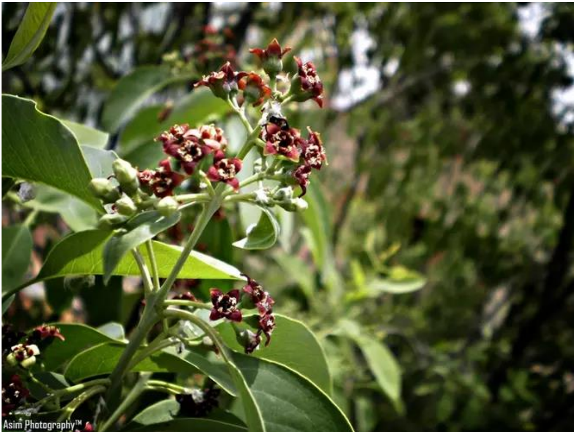
Slika 9 Santalum album L.

Santal se često koristi u obliku mirisnih štapića, ulja ili dimnih štapića (incensa) tijekom meditacije. U mnogim duhovnim tradicijama, santal simbolizira čistoću, duhovnu snagu i povezanost s božanskim. Također je poznat kao "sveto drvo" u mnogim kulturama, što ga čini idealnim izborom za duhovne prakse poput meditacije. Njegova prisutnost može podići energiju prostora i potaknuti meditativno stanje. Miris santala povezuje praktičare s duhovnim svijetom i potiče unutarnju harmoniju (Chevallier 1996.).