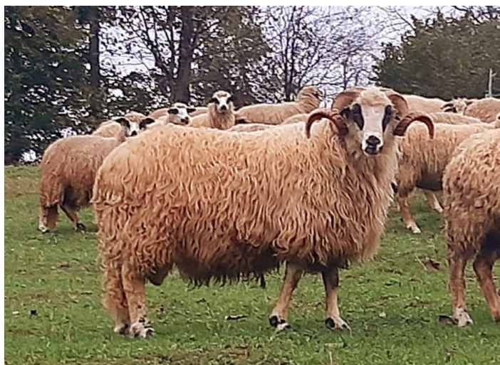
Slika 2.2.2.1. Ovan ličke pramenke u stadu ovaca