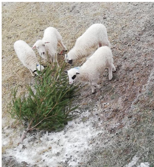
Slika 2.4.3. Janjad na ispustu nakon loših vremenskih uvjeta