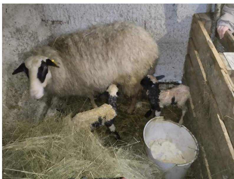
Slika 2.2.2.2. Blizanci neposredno nakon janjenja

Ovce se janje krajem zime i u proljeće, a najveći broj ovaca na području Like ojanji se u ožujku. S obzirom na vremenske uvjete u Lici potrebno je obratiti posebnu pozornost na uvjete u kojima se ovca janji kako ne bi došlo do velikih gubitaka u prvim danima života janjeta (radi hladnoće, smrzavanja janjadi i posljedično tome upale pluća). Boks za janjenje treba biti čist, suh, s dostatnom količinom svježje prostirke, odgovarajuće osvijetljen, a u staji ne smije biti propuh. Lička pramenka najčešće janji samo jedno janje, ali u uvjetima dobrog uzgoja znatan je broj blizanaca, dok je pojava trojaka doista rijetka (Mioč i sur. 2007.).