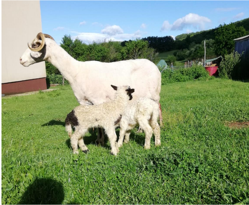
Slika 2.4.1. Sisajuća janjad