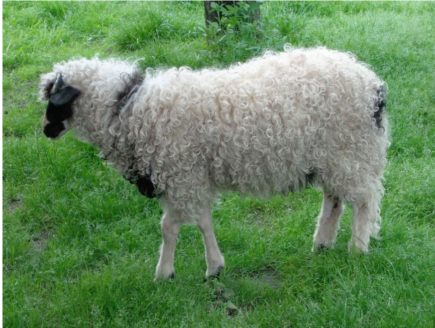
Slika 2.2.1. Ovca ličke pramenke