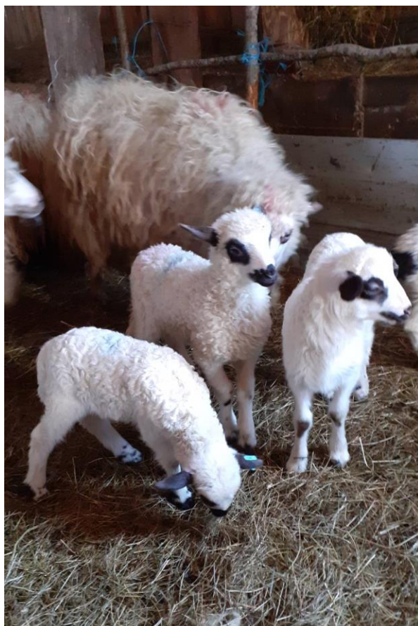
Slika 2.4.2. Janjad ličke pramenke u staji