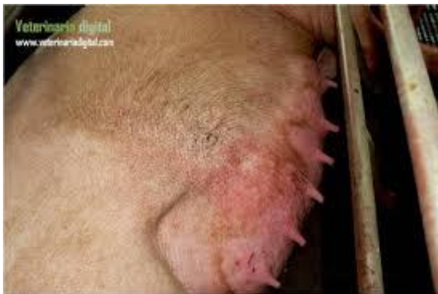
Slika 5.1. Mastitis krmače