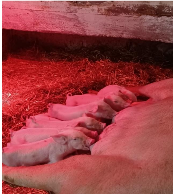
Slika 3.1. Sisajuća prasid

Prasid siše u prosjeku svakih sat vremena, a period sisanja traje oko 20 – 30 sekundi. Razlog tome je što krmače imaju posebno izraženu sposobnost kontrole otpuštanja mlijeka (Salajpal 2018.). Sisanje je intenzivnije tijekom dana (period svjetla), a nešto slabije tijekom noći. Trajanje i intenzitet svjetla također utječu na količinu proizvedenog mlijeka jer krmače koje su dulje izložnije svjetlu (oko 16h) proizvode veću količinu mlijeka. Osiguravanjem dulje izloženosti svjetlu, utječe se na bolje preživljavanje prasidi kao i veće težine pri odbiću.