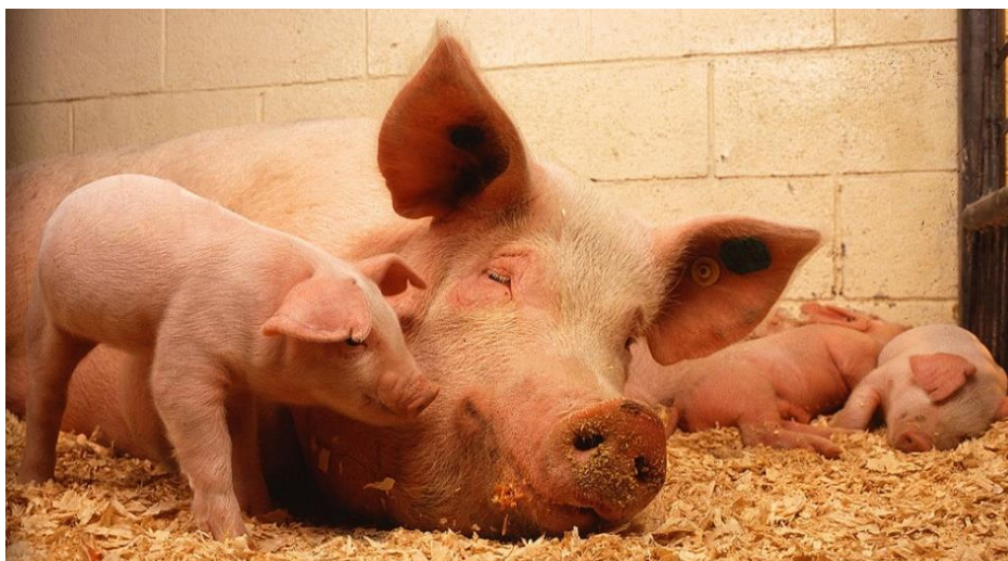
Slika 3.4. Veliki jorkšir sa prasadi

Sljedeće važno reproduktivno svojstvo je veličina legla, a ona ovisi o broju ovuliranih jajašaca, preživljavanju embrija i kapacitetu maternice (u prenatalnom razdoblju) (Garić 2015.). Postnatalno, veličina legla se klasificira na ukupan broj oprasene prasadi, zatim broj živooprasene i mrtvooprasene prasadi te broj odbite prasadi. Istraživanja su pokazala kako je ukupna veličina legla u negativnoj korelaciji s porodnom masom, a samim time i preživljavanjem prasadi (Andersen i Pedersen 2014.; Reid 2015.). Garić (2015.) je također utvrdio kako se, s povećanjem veličine legla, smanjuje prosječna porodna masa, manji je broj dostupnih sisa krmače za hranidbu prasadi, ali je povećana sekrecija mlijeka te je veći postotak pojave prasadi niske porodne mase (do 1 kg) (tablica 3.4.2.).