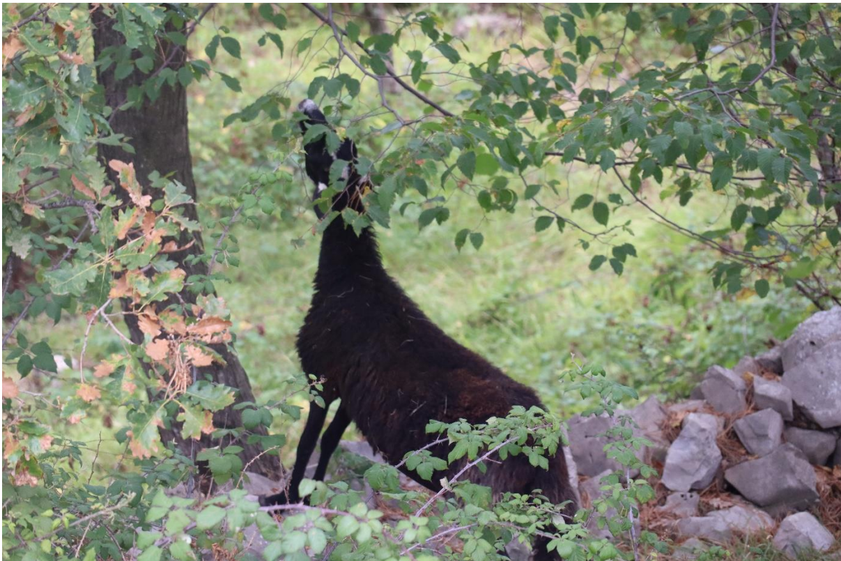
Slika 4.3.4.1. . Konzumacija lista u uvjetima silvopastorala

da hrana koju su odabrale prvi dan mijenja sastav pašnjaka, a time i naknadno dostupne izbore. Time ujedno i podupiru svojevrsnu kritiku na do tada provedena istraživanja provedena s ciljem utvrđivanja optimalnih odnosa krmiva na pašnjacima mješovitog botaničkog sastava (odnos trava i legminoza) kako znanstvenici koriste nedovoljno informativne „alate“ u procesu zaključivanja. Smatraju da je jedini način da se dođe do željenih spoznaja o složenoj međuodnosu životinje i okoliša moguće utvrditi korištenjem dinamičnih modela, uz imperativ razlikovanja selekcije od preferencije, i utvrđivanjem je li preferencija apsolutna ili parcijalna. Za razliku od čiste preferencije (sklonosti) koja predstavlja ono što životinje najradije odabiru kada su im dana minimalna fizička ograničenja; selekcija (odabir) definirana je kao preferencija modificirana okolnostima okoline.