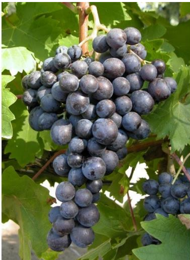
Slika 4. Grozd sorte Muškati Hamburg