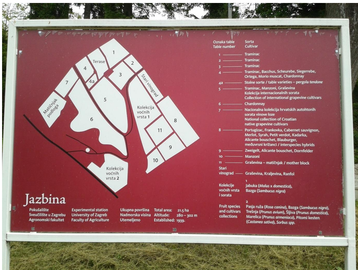
Slika 2. Tabla s prikazanim rasporedom nasada na VVP Jazbina

je antropogeni pseudoglej na matičnom supstratu pleistocenih ilovina. Po teksturi je to glina s prilično nepovoljnim fizikalno-kemijskim svojstvima. Reakcija tla je slabo do jako kisela, a humoznost slaba ili vrlo slaba. Opskrbljenost hranivima prilično je uniformna po cijeloj dubini profila, a prosječne vrijednosti su 49 mg/kg za fosfor i 149 mg/kg za kalij (Bažon i sur. 2013.). Nasad 'Muškata hamburga' nalazi se na terasama, a tamo je posađen 2016. godine. Uzgojni oblik je kordonac Moser, visina stabla je 110 cm, a razmak između trsova 150 cm.