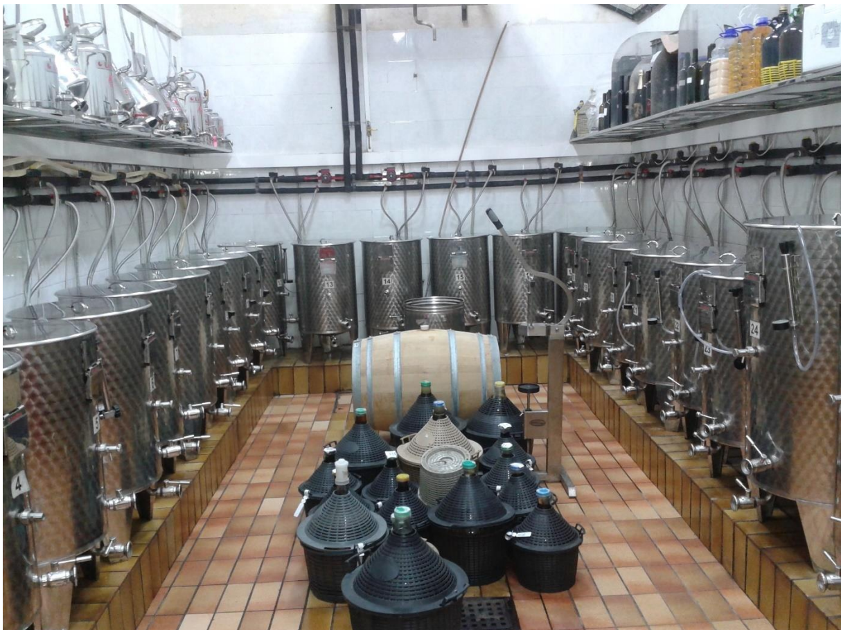
Slika 1.: Eksperimentalni podrum na VVP Jazbina

Istraživanje je provedeno na sorti 'Muškati hamsburg' u Vinogorju Zagreb 2023. godine, na vinogradarsko-vinarskom pokušalištu Jazbina. Pokušalište se nalazi u sastavu Agronomskog fakulteta od 1939. godine, a služi kao znanstveno-nastavno pokušalište iz područja vinogradarstva, vinarstva i voćarstva. Ukupna površina pokušališta je oko 20 hektara od čega glavni površine od oko 10 hektara čine vinogradi, 3 hektara čine nasadi voćaka, a na preostaloj površini se nalazi infrastruktura pokušališta. Infrastruktura se sastoji od proizvodnog, nastavnog i istraživačkog dijela. U proizvodnom dijelu nalaze se podrum kapaciteta 50 000 litara, prostorije za prihvati i preradu grožđa, prostorije za pripremu i njegu vina, prostorija za odležavanje u drvenim bačvama, prostorija s uređajem za proizvodnju destilata, mala šampanerija, skladište te garaža i spremište za vinogradarske strojeve i alate. U svrhu znanstveno-nastavnih aktivnosti koriste se učionica od 40 sjedećih mjesta, laboratorij od 20 sjedećih mjesta te eksperimentalni podrum u kojem je provedena i vinifikacija u sklopu ovog istraživanja (Agronomski fakultet, 2022.).