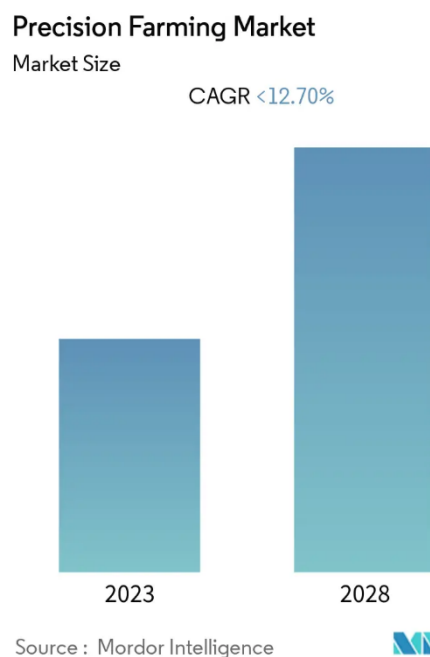
Grafikon 1. Tržište precizne poljoprivrede