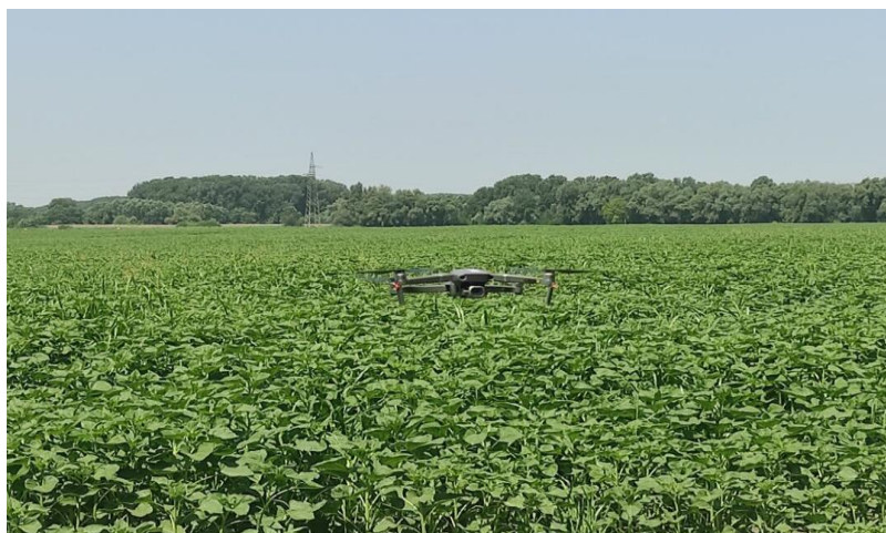
Slika 2. Kartiranje poljoprivredne površine pomoću dron letjelice