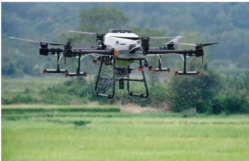
Slika 1. DJI Agras T30