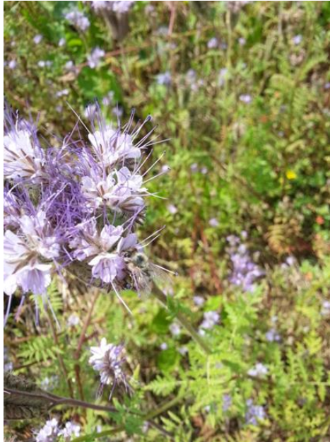
Slika 4. Cvijet facelije kao izvor nektara (Palčić, 2015)

Osobina facelije da obilno i dugotrajno cvjeta i može imati koristan učinak na povećanje broja i raznolikost vrsta insekata, jer proizvodi visokokvalitetni nektar i pelud. Uzgajanje biljnih vrsta velike nektarne vrijednosti pruža šansu za povećanje rentabilnosti pčelarstva (Puškadija i sur., 2004). Prema literaturi, produkcija nektara i koncentracija šećera u cvijetu facelije raste tijekom jutarnjih sati i dostiže svoj maksimum oko podneva, a zatim opada u poslijepodnevnom satima. Pčele najčešće posjećuju cvjetove facelije između 11.00 i 16.00 h. Međutim, prema istraživanju Williams i Christian (1991) koje je provedeno u Engleskoj najveći broj solitarnih pčela na faceliji utvrđen je u razdoblju od 9:00 do 11:00. Učestali posjeti solitarnih pčela faceliji mogu biti uzrokovani prelaskom medonosne pčele na lipovu pašu.