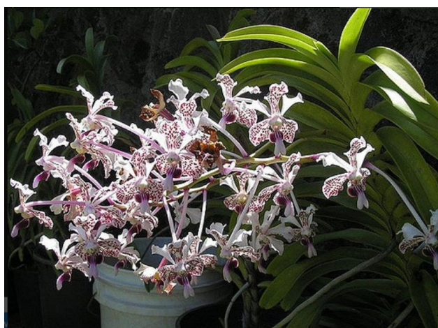
Slika 20. Cvjetna stabljika Vande tricolor

Vanda tricolor ili vanda trobojnica dolazi iz područja oko Laosa i Balijsa. Listovi su duguljasti i zakrivljeni, a cvijet kao što i ime navodi karakterizira prisutnost 3 boje. To su najčešće kombinacije bijele, ljubičaste i žućkaste boje. Cvjetovi su veličine od 5 do 7 cm, a na jednoj cvjetnoj stabljici može biti od 7 do 9 cvjetova (Slika 20. i 21.). Dobro uspijevaju na poluosunčanim mjestima s visokom relativnom vlagom zraka (Orchid Species, 2007.).