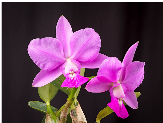
Slika 24. Cattleya walkeriana