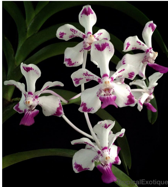
Slika 23. Vanda luzonica

Vanda luzonica dobila je ime po otoku Luzonu na Filipinima. Zaštićena je vrsta jer se u prirodi nalazi vrlo malo primjeraka ove vrste. Može narasti i do visine 1 m, a listovi su veliki od 20 do 50 cm. Na prvi pogled cvjetovi izgledaju slično kao kod vrste Vanda tricolor , ali nisu toliko gusto zbijeni već su rjeđe raspoređeni. Latice cvjetova su bijele boje sa ljubičastim obojenjima pri vrhovima. Cvatnja počinje u proljeće, a cvjetovi su jakog mirisa i na površini su prekriveni voštanom prevlakom (Orchid Species, 2007.).