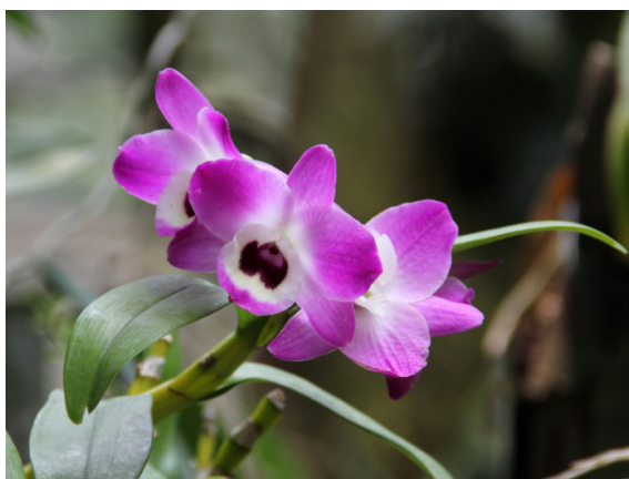
Slika 29. Dendrobium nobile

Dendrobium nobile dolazi iz Azije. Nalazimo ih na području Himalaja u Kini, Indiji, Nepal, Tajlandu i Laosu u šumama na vapnenastom tlu od 200 do 2000 m nadmorske visine. Raste u polusjeni na drveću, a tolerira niske i visoke temperature. Cvjeta zimi i na proljeće, a cvjetovi su različitih boja, no najzastupljenije su bijela, ružičasta i ljubičasta (Orchid Species, 2007.) (Slika 29.). Stabljike su duge i nose listove oblog oblika sa 2 do 4 cvjetne stabljike na kojima se razvijaju cvjetovi veličine do 7,5 cm. Cvjetovi vrste Dendrobium nobile koriste se u kineskoj narodnoj medicini za izradu Shi hu - a (石斛) koji hladi organizam i smanjuje upale gastrointestinalnog trakta i bubrega (Wing Joo Loong, 2023.).