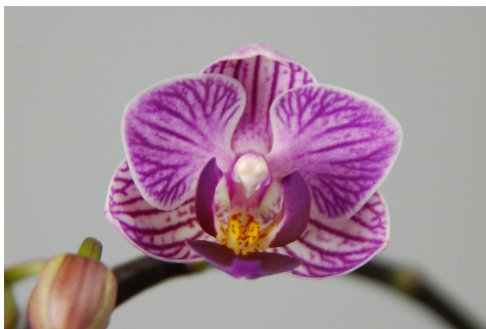
Slika 15. Doritaenopsis 'Sogo Vivien'