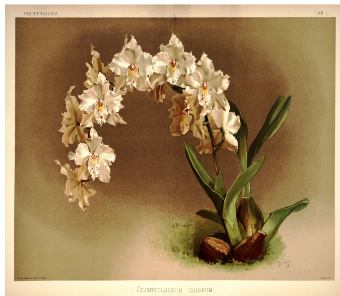
Slika 1. Sanderova ilustracija orhideje Odontoglossum crispum

Najveći utjecaj imali su znanstvenici Frederick Sander, Spencer Cavendish, Joseph Banks i John Lindley. Frederick Sander je imenovan "kraljem orhideja" jer je prvi počeo zapisivati imena križanaca i njihove roditelje (Sander's list of Orchid Hybrids) (Slika 1.). Uz orhideje Sander je uvezio i druge tropske biljke iz cijeloga svijeta i čuvao ih u svojim 60-ak staklenika (Jevšnik, 2006.). Spencer Cavendish iz Devonshire-a bio je sakupljač po kojem su neke vrste dobile ime npr. Cymbidium devonianum i Oncidium cavendishianum . Imao je staklenik dužine 91m i visine 18m koji je u to vrijeme sadržavao najveću kolekciju orhideja u svijetu.