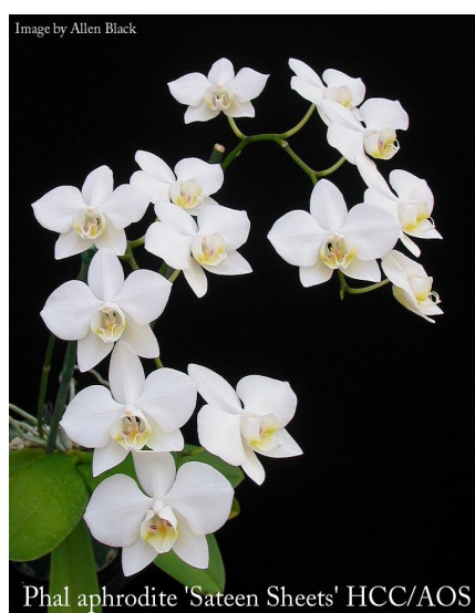
Slika 11. Phalaenopsis aphrodite

Phalaenopsis aphrodite porijeklom je iz jugoistočnih dijelova Azije npr. Nova Gvineja, Filipini, Malezija i Indonezija. Raste na drveću u tropskim šumama i tako prima vodu i druge hranjive tvari. Cvjetovi rastu od siječnja do lipnja i prisutni su do prosinca, a najčešće dolaze u bijeloj boji (Slika 11. i 12.). Moguća su i blaga ružičasta obojenja na labellum -u ili na gornjim laticama. Cvjetovi su srednje veličine, a maksimalno iznose do 7,5 cm. Raste i uspjeva u sjeni na područjima s visokom relativnom vlažnošću zraka (Orchid Species, 2007.).