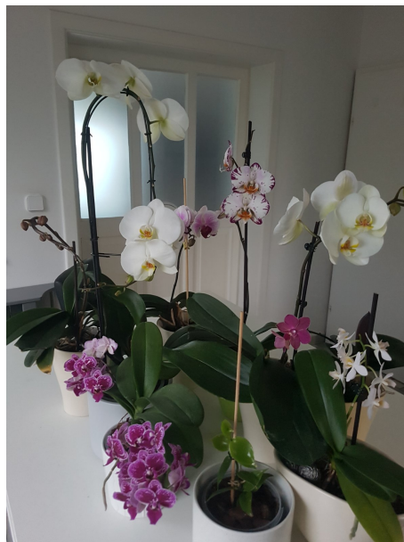
Slika 36. Unos boje u prostor (vlastiti izvor)

Minimalizam je stil u kojem se orhideje idealno uklapaju. Minimalizam karakteriziraju bijeli zidovi, malo namještaja, puno dnevnog svjetla i zelenilo. U jednostavno uređenom prostor orhideje daju dinamičnost i boju prostoru (Slika 36.), ali i dalje održavaju prozračnost i harmoniju (Petrova, 2020.).