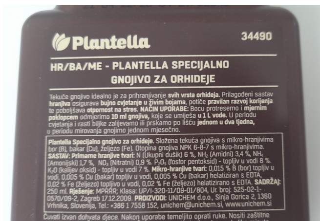
Slika 10. Sastav tekućeg gnojiva za orhideje