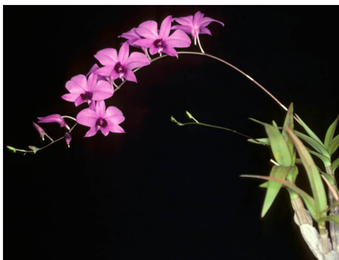
Slika 30. Dendrobium bigibbum

Vrsta Dendrobium bigibbum je rasprostranjena na sjevernom dijelu Queenslanda u Australiji i Novoj Gvineji. Na engleskom nosi naziv „Cooktown Orchid“. Raste kao epifit i litofit na semiaridnim tlima i niskim nadmorskim visinama do maksimalno 400 m (Orchid Species, 2007.). Stabljike su zelene i ljubičasto - crvene boje koje nose 3 do 12 listova ovalnog oblika (Gardenia, 2023.). Cvate sve od ljeta do zime. Na cvjetnoj stabljici razvija 5 do 20 cvjetova koji su promjera 5 cm. Cvjetovi su ljubičaste boje (Slika 30.). Vrsta Dendrobium bigibbum je 1959. g. postala cvjetni amblem Queenslanda. U prirodi ih je zabranjeno sakupljati, a za komercijalni uzgoj se treba osigurati suho, sunčano mjesto. Orhideje nije potrebno previše zalijevati te je najvažnije da temperature ne padnu ispod 13°C.