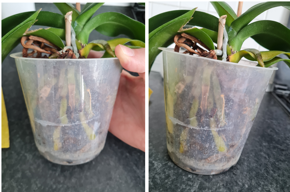
Slika 3. Izgled korijena orhideje

Korijenje orhideje je dugo, izlazi iz baze pseudolukovice. Površina kod većine orhideja je dlakava tj. na njoj se nalaze korijenove dlačice koje imaju strukturu sličnu rizoidima. One služe za crpljenje hranjivih tvari i vlage iz tla. Korijenje služi za pričvršćivanje orhideje za stabla u prirodi ili za supstrat u lončićima. Postoji nekoliko vrsta korijenja. Kod epifitskih orhideja korijenje izlazi iz donje strane pseudolukovica dok kod terestričkih orhideja ne izlazi iz pseudolukovica već iz kuglastih gomolja s tankim korijenjem ili nakupina mesnatog korijenja (Squire, 2008.).