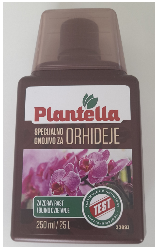
Slika 9. Tekuće gnojivo za orhideje

U pravilu orhideje nemaju velike potrebe za gnojidbom. Većina biokemijskih procesa koji se dešavaju u biljci osigurava dovoljnu količinu hranjivih tvari. Orhideje mogu imati jedino manjak dušika, fosfora, kalija ili kalcija. Od njih je najznačajniji dušik jer biljke nemaju sposobnost vezanja dušika iz zraka pa se dušik apsorbira preko korijena i listova. Preporučljiva je folijarna gnojidba tj. prihrana bilja preko listova biljke. Kod primjene folijarnih gnojiva moramo obratiti pozornost da gnojivo ne sadrži klor i natrij. Folijarnom gnojidbom se makro- i mikroelementi ne gomilaju u supstratu kao što bi se akumulirale da smo ih gnojili klasičnom metodom (otopina gnojiva u vodi i aplikacija u supstrat). Povećana koncentracija gnojiva u području korijena može uzrokovati njegovo odumiranje i truljenje (Jevšnik, 2006.). Znakovi pretjeranog gnojenja su uveli listovi i zaustavljen rast izdanaka i korijenja. Najzastupljenija su NPK gnojiva te specijalna gnojiva za orhideje u tekućem obliku (Slika 9. i 10.). Specijalna gnojiva sadrže mikroelemente kao što su bor (B), bakar (Cu) i željezo (Fe), ukupni dušik (N) dušikove spojeve kao što su amidni (NH 2 ), amonijski (NH 4 ) i nitratni (NO 3 ) te fosforov pentoksid (P 2 O 5 ) i kalijev oksid (K 2 O).