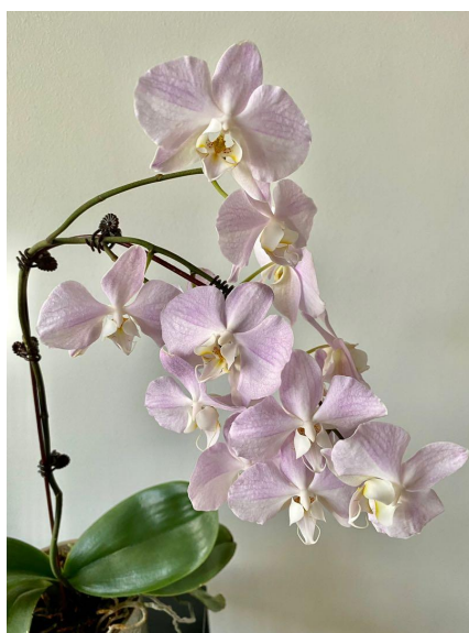
Slika 13. Viseći izgled cvjetne stabljike

Vrsta Phalaenopsis sanderiana porijeklom je iz Filipina. Cvjetovi i cvjetna stabljika padaju okomito prema dolje i time stvaraju viseći oblik (Slika 13.). Ova vrsta orhideja se često koristi u križanju i stvaranju hibrida. Za razliku od drugih pripadnika roda Phalaenopsis ova vrsta podnosi velike količine sunčeve svjetlosti. Stoga se ovu vrstu orhideje preporuča držati na dobro osunčanom mjestu. Orhideje se sklanjaju sa sunca jedino za vrijeme ljetnih mjeseci i to oko podneva kada je sunčeva svjetlost najintenzivnija. Minimalne temperature koje podnosi su od 15° do 18°C, a idealna temperatura za rast i razvoj kreće se od 23° do 29°C (Orchid Resource Center, 2021.). Cvjetovi vrste Phalaenopsis sanderiana su bijele, ružičaste i ponekad ljubičaste boje, a cvjeta sredinom do kraja proljeća što je atipično za orhideje iz roda Phalaenopsis .