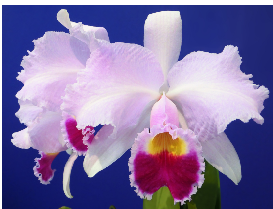
Slika 25. Cattleya trianae - bijeli cvijet

Cattleya trianae zove se još „Flor de Mayo“ (Svibanjski cvijet) i „Christmas Orchid“ (Božićna orhideja). Endemska je vrsta iz Kolumbije, a proglašena je nacionalnim cvijetom 1936. g (Orchid Species, 2007.). Uspijeva na poluosunčanim mjestima na visokim i niskim temperaturama u rasponu od 15° do 32°C. Pseudobulbusi nose jedan par listova koji se u potpunosti formiraju zimi, a izrastu do dužine od 30 cm. Listovi su sukulenti, zadržavaju vodu i time hrane biljku. Razvije se i do desetak cvjetnih stabljika koje nose do 5 cvjetova promjera 20 cm (Orchid Species, 2007.). Cvjetovi dolaze u različitim bojama, a najznačajnije su bijela (Slika 25.), žuta i ljubičasta (Slika 26.).