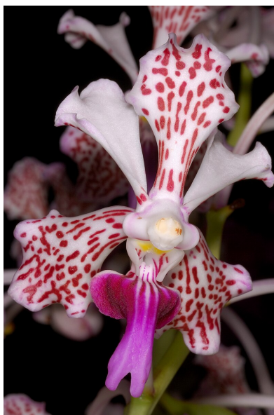
Slika 21. Cvijet Vande tricolor