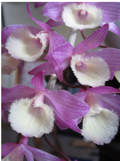
Slika 32. Dendrobium aphyllum