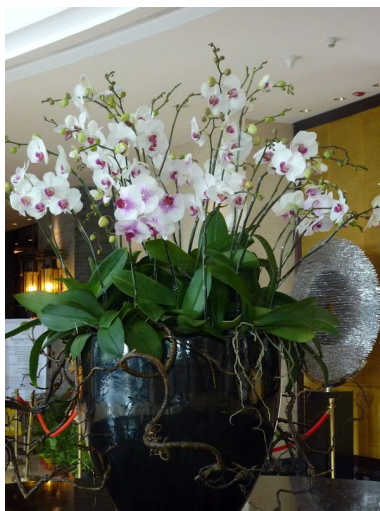
Slika 33. Orhideje kod recepcije hotela

Najčešća je primjena orhideja s bijelim cvjetovima. Bijela boja uklapa se u svaki prostor i neutralna je pa se može kombinirati sa drugim biljnim vrstama. Često se primjenjuje tehnika kontrasta gdje se u tamniji prostor stavi akcent bijele boje što daje živahnost i dinamičnost prostoru (Petrova, 2020.). U kuhinjama ili kupaonicama gdje se zna zadržavati vlaga orhideje mogu uspješno rasti uz prisutnost sunčeve svjetlosti npr. na prozorskim klupčicama (Slike 34. i 35.).