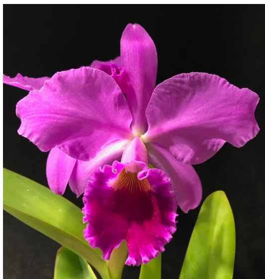
Slika 27. Cattleya labiata

Cattleya labiata otkrivena je u Brazilu 1818. g., a nosi naziv „Crimson Orchid“ (Grimizna orhideja). Danas ju možemo naći na područjima Venezuele i Brazila. Mogu narasti do različitih visina ovisno o staništu iz kojeg dolaze. Orhideje iz Pernambuco (unutrašnjost Brazila) imaju manje cvjetove koji su ljubičaste boje, sa tamnijim središtem, a orhideje iz Alagoasa (istočna obala Brazila) su više i razvijaju velike cvjetove (Orchid Species, 2007.). Uspijevaju na poluosunčanim mjestima na temperaturama do 30°C. Cvjeta u jesen i ranu zimu, a cvjetovi mogu narasti do 17 cm. Prevladavaju bijela i ljubičasta boja (Slika 27.).