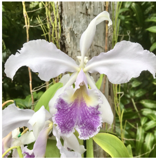
Slika 28. Cattleya warszewiczii

Ova vrsta dobiva ime po botaničaru Jozefu Warszewiczu koji ju otkriva u Kolumbiji 1848. g. U Kolumbiji raste na nadmorskoj visini od 500 do 1700 m nm na vrhovima drveća gdje je osunčanost najveća. Razvija duge i debele pseudobulbuse koji iznose 20 - 40 cm dužine. Cvjetne stabljike su duge i do 45 cm i nose velike cvjetove veličine do 28 cm. Na jednoj cvjetnoj stabljici raste 4 - 7 cvjetova koji mirisom podsjećaju na ljubicu ( Viola odorata ) (Orchid Species, 2007.). Cvjeta ljeti kada ima najviše svjetlosti, a boja može biti bijela (Slika 28.), ljubičasta i ružičasta.