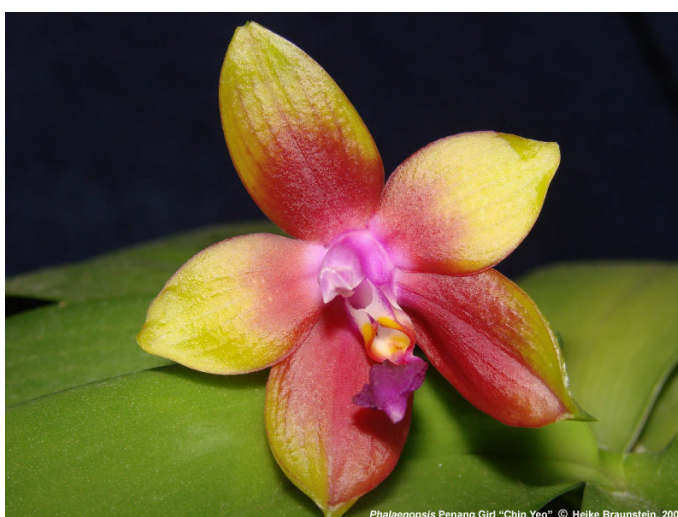
Slika 17. Hibrid 'Penang Girl'