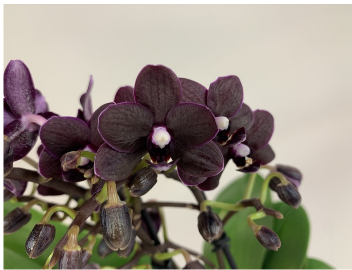
Slika 14. Doritaenopsis 'Black Beauty'

Ovaj hibrid je prvi put opisan 1935. g. u Francuskoj, a prvi križanac zabilježen je 1950. križanjem vrsta Phalaenopsis pulcherrima i Phalaenopsis equestris . Kasnije se križao rod Phalaenopsis i Doritis i tako je nastao službeni križanac Doritaenopsis . Kada se uspoređuje sa svojim roditeljima hibrid Doritaenopsis sadrži više cvjetova koji imaju intenzivnije obojenje (Orchid Species, 2007.). Postoji mnogo vrsta sa različitim bojama cvjetova koja variraju od žute, ljubičaste, bijele i tamnocrvene (Slika 14. i 15.). Za uspješan rast i razvoj poželjno ih je držati u polu sjenovitom i toplom prostoru. Mogu se gnojiti u malim količinama svakih 14 dana, a treba pripaziti da korijen nikad ne bude pretopljen vodom. Zbog rasta i razvoja biljke trebalo bi ih presađivati u veće lončice svaku godinu do dvije godine.