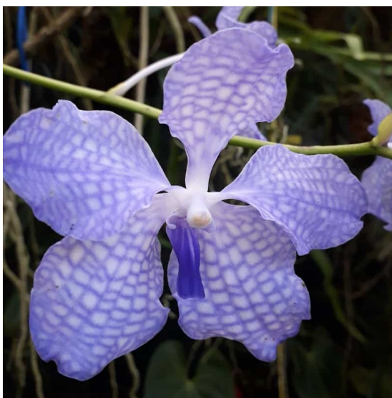
Slika 18. Vanda coerulea

Vanda coerulea , koju još zovemo „plava orhideja” ili „plava vanda”, dolazi iz sjevernog dijela Indije uz granicu s Kinom. Ima karakteristično plavo bijele cvjetove koji su u promjeru veći od 10 cm i nemaju miris (Jevšnik, 2006.) (Slika 18.). Cvjetovi su skupljeni u uspravne aksilarne grozdove koji mogu iznositi i do 40 cm dužine i cvjeta dva puta na godinu (Slika 19.). Mogu narasti i do 1 m u visinu. Zbog zračnih korijena poželjno ih je posaditi u lončice u visećim košarama kako bi što više bile izložene sunčevoj svjetlosti (Orchid Species, 2007.).