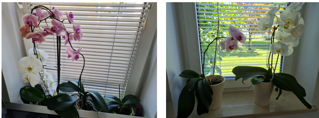
Slike 34. i 35. Orhideje na prozorskoj klupčici u kuhinji