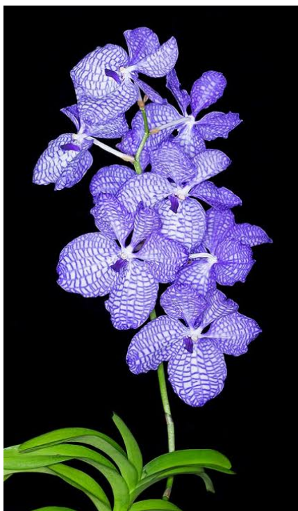
Slika 19. Cvjetovi na stabljici