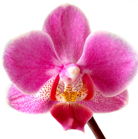
Slika 2. Izgled cvijeta orhideje

Svaka orhideja ima tri latice koje su u boji (Slika 2.). Donja latica je u obliku usne pa ju nazivamo labellum . Kod nekih orhideja ta latica tvori vrećicu dok kod drugih može biti plosnata ili udubljena oblika. Ona je najsloženiji, ali i najdekorativniji dio cvijeta jer svojom bojom i oblikom privlači kukce oprašivače. Labellum se uvijek nalazi nasuprot reproduktivnim organima te omogućava najlakši pristup cvjetnom prahu. Gornje dvije latice jednakog su oblika i veličine. Kod nekih cvjetova su uske i blago padajuće, a kod drugih su šire i vodoravne te stvaraju izraženu pozadinu za donju laticu ( labellum ) (Squire, 2008.).