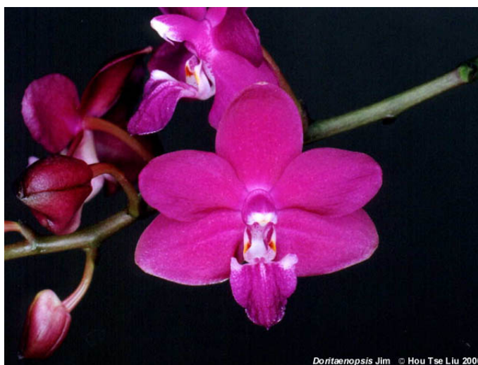
Slika 16. Hibrid 'Jim'

Phalaenopsis venosa je vrsta orhideje koja je pronađena na području Indonezije. Raste u sjenovitim područjima šuma na visinama od 450 m do 1000 m nm, a optimalna temperatura za rast iznosi od 20° do 24°C. Cvate od zime do proljeća, a cvijet ima veličinu do 4 cm. Ako se uzgaja u teglicama potrebno ju je zalijevati svakih 7 dana, a sam promjer lončića mora iznositi 9 cm. Koristi se u križanju i stvaranju novih hibrida, a ima ih preko 30 (Shim & Fowlie, 1983.). Prvi hibridi zabilježeni su 1985. g. pod nazivima 'Ambonosa' ( Phalaenopsis venosa x Phalaenopsis amboinensis ), 'Jade Gold' ( Phalaenopsis gigantea x Phalaenopsis venosa ), 'Jim' ( Phalaenopsis pulcherrima x Phalaenopsis venosa ) (Slika 14.), 'Penang Girl' ( Phalaenopsis violacea x Phalaenopsis venosa ) (Shim & Fowlie, 1983.).