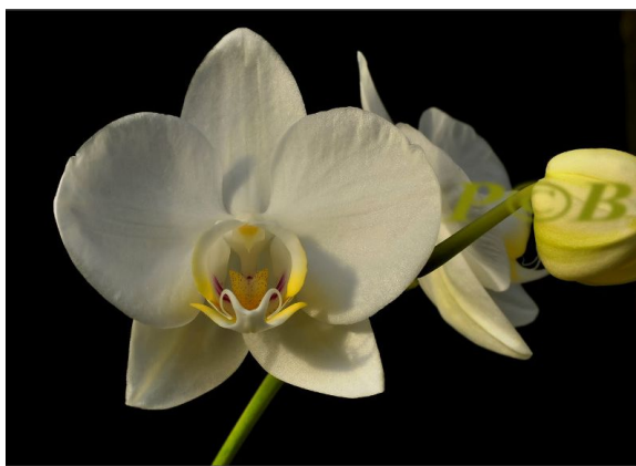
Slika 12. Izgled cvijeta Phalaenopsis aphrodite