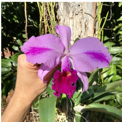
Slika 26. Cattleya trianae - ljubičasti cvijet