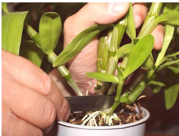
Slika 6. Uzimanje reznica nožem