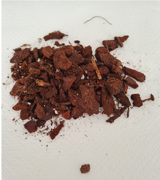
Slika 7. Izgled supstrata