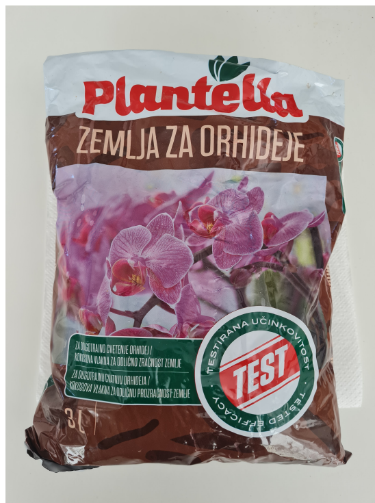
Slika 8. Pakiranje supstrata