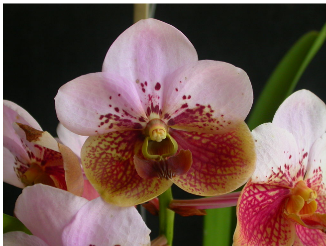
Slika 22. Vanda sanderiana

Vanda sanderiana ili Ejante endemska je vrsta orhideje Filipina, a raste na jugoistoku otoka Mindanao. Uspijeva na drveću u blizini voda na nadmorskoj visini od 500 m nm (Orchid Species, 2007.). Filipinci ju još zovu „Waling-Waling“. Monopodijalna je sa izduženom stabljikom, a listovi su duguljastog oblika i veličine do 40 cm (Travaldo, 2017.). Cvjetovi su veliki, najčešće od 8 do 11 cm te su prisutne dvije boje kod latica. Gornji dio je najčešće bijele boje dok na donje dvije prevladavaju tamnije nijanse crvene i smeđe boje (Slika 22). Cvate u jesen. Optimalne temperature za rast iznose od 28° do 30°C danju, a noću ne smiju pasti ispod 19°C. Na otvorenom relativna vlaga zraka mora iznositi od 80 do 85%, a u kućnom uzgoju može iznositi od 65 - 70% (Travaldo, 2017.).