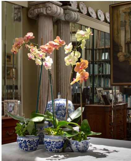
Slika 35. Orhideje u dekorativnim vazama

Koristeći orhideje u uređenju interijera moramo uzeti u obzir cjelokupnu kompoziciju prostora. Orhideje s velikim cvjetovima privlače pogled pa time postaju centar i glavna točka prostora. Ako se u prostoriji nalaze biljke, slike, vaze ili neki drugi elementi oni mogu vizualno smanjiti prostor. Time bi se činio prenatrpan, a to nije poželjno u uređenju prostora. Orhideje stvaraju harmoniju u prostoru. Najčešće se stavljaju na elemente jednostavnog oblika npr. stolovi, police, ormari. Vaze u kojima izlažemo orhideje ne bi trebale biti predekorativne da ne odvrću pažnju od same biljke (Slika 35.) (Petrova, 2020.).