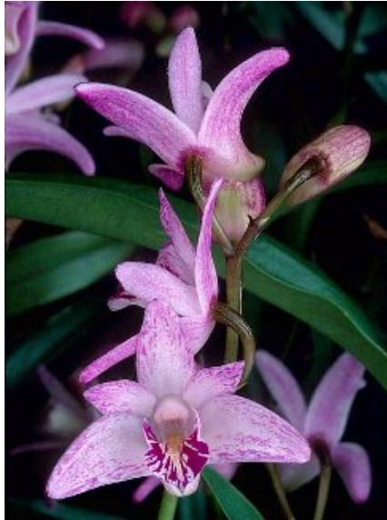
Slika 31. Dendrobium kingianum