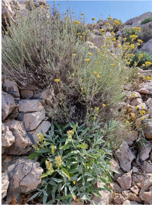
Slika 12: Ocvala kadulja i smilje u početku cvatnje Autor: Derenčinović L., 2023.