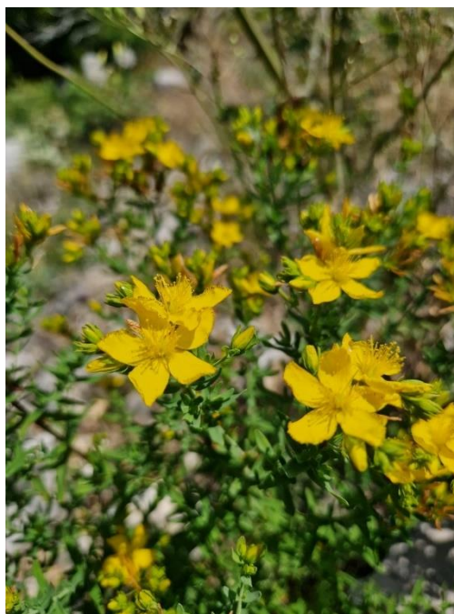
Slika 10: Cvijet gospine trave

Gospina trava u narodu jedna je od najučestalije korištenih ljekovitih biljaka i to u kontekstu kantarionovog ulja – crvenkastog macerata (Slika 11) cvjetova gospine trave u maslinovom ulju. Koristi se kao antiseptik za liječenje rana i opeklin, a također je odavno poznato njeno sedativno i diuretičko djelovanje pri liječenju neuroloških bolesti, proljeva, bolesti urinalnog trakta, čireva, gastritisa i sl. Osim toga, najtraženija je i najviše istraživana je biljna vrsta u pogledu korištenja antidepresiva, a novija ju istraživanja potenciraju u liječenju AIDS-a i drugih virusnih bolesti (Lyles i sur, 2017.).