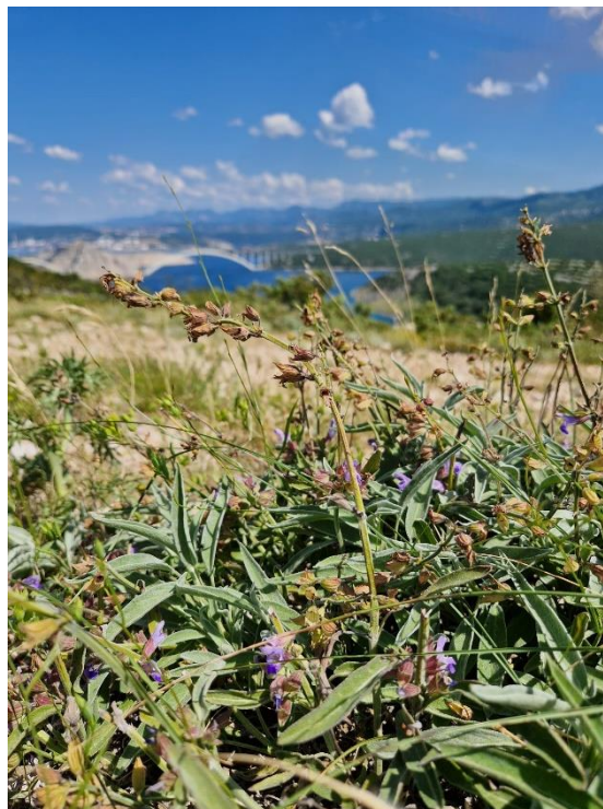
Slika 13: Posljednji ovogodišnji cvjetovi kadulje s pozadinom Krčkog mosta

svim tlima, osim na močvarnim. Ipak, najbolje rezultate daje na rastresitim, propusnim i hranjivim tlima kakva karakteriziraju otok Krk i gotovo čitavu istočnu jadransku obalu. S obzirom na duži životni vijek, u nasadima se uzgaja i preko 10 godina tako da se ne koristi u plodoredima. Njega nasada obuhvaća prorjeđivanje i popunjavanje praznih mjesta u redovima, međurednu kultivaciju, okopavanje, prihranjivanje te zaštitu od bolesti i štetočina. Razmnožava se sjemenom direktnom sjetvom i presadnicama ili diobom busena. Gustoća sklopa je, ovisno o načinu razmnožavanja i razmaku, između 40 000 – 50 000 bilj./ha. Žetva se obavlja nakon cvjetanja, kada listovi dobiju srebrnkastu boju. Bere se zelen na visini od 10 cm koji se suši, a zatim odvaja list. Sušenje se provodi prirodno ili u sušarama, prvih 3 h na 55 °C, a zatim na 40 – 45 °C. Osim zbog lista, kadulju možemo uzgajati za sjeme i za eterično ulje. Prinosi ovise o starosti nasada, ali u prosjeku se po 1 ha kreću: 2 000 – 3 000 kg suhog lista, 400 – 600 kg sjemena i 30 – 50 kg eteričnog ulja (Stepanović i sur., 2009.). Prinos meda i peludi na divljoj paši kadulje ovisi o padalinama u tekućoj godini, a u nasadima se dnevno može dobiti do 6 kg meda, po košnici 70 kg, a na površini od 1 ha može se prikupiti i do 600 kg meda (Lušić i sur, 2010.)