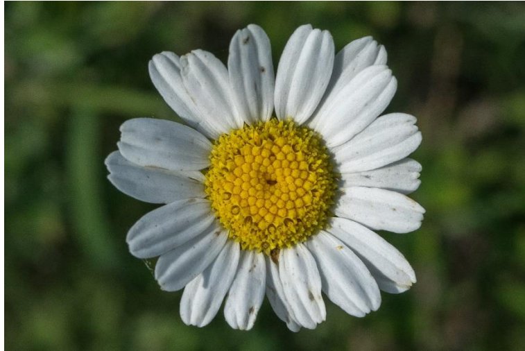
Slika 8: Cvijet buhača

Prema usmenim svjedočanstvima generacija rođenih 30-ih i 40-ih godina prošlog stoljeća, jedna je od ljekovitih biljaka koja se aktivno skupljala i prodavala otkupljivačima. Dalmatinski buhač je kao autohtona insekticidna biljna vrsta zbog svojeg insekticidnog djelovanja bio aktivno sakupljan s prirodnog staništa sve do pojave sintetskih pesticida poput DDT-a (Slika 9) (Ožanić, 1955.).