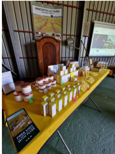
Slika 5: Direktna prodaja kozmetičkih proizvoda Autor: Derenčinović L., 2023.

zaradu nego prodajom ulja otkupljivačima (Slika 5). Osim eteričnog ulja proizvodi i hidrolat kao nusproizvod, a njih kasnije prerađuje u kreme, ulja, sapune, zubne paste i sl.