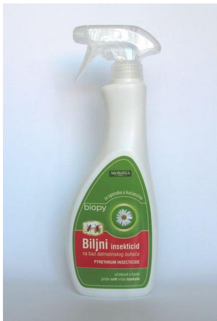
Slika 9: Insekticid na bazi buhača

Izbor lokacije za uzgoj buhača vrlo je važan. Postoji narodna izreka kako buhač voli gledati more. To potvrđuje i istraživanje Ambrožič-Dolinšek i sur. iz 2007. provedeno na buhaču uzgajanom na Cresu i u Ljubljani. Istraživanjem je utvrđeno kako se sastav piretrina nezamjetno razlikuje, međutim bitno se razlikovao omjer glavnih sastavnica piretrina I i II, o kojem ovisi insekticidna aktivnost ekstrakta.