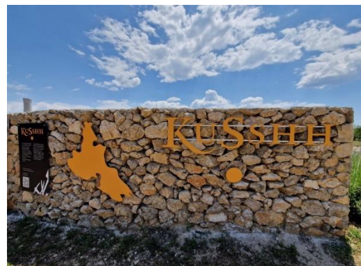
Slika 7: Nasad Kusshh Autor: Derenčinović L., 2023.