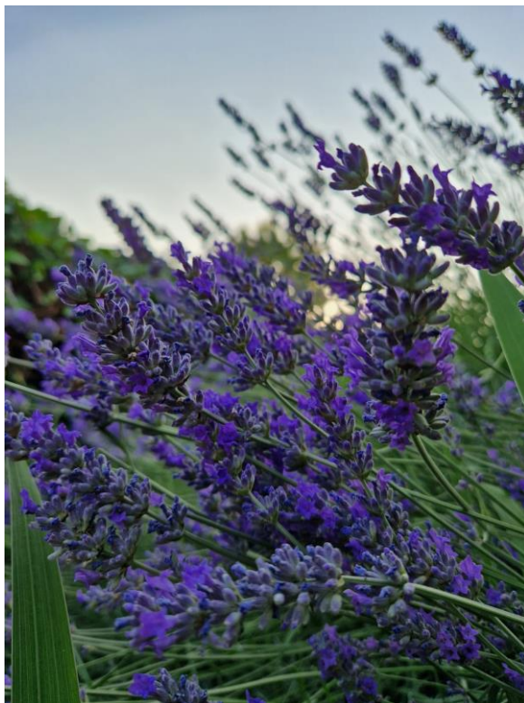
Slika 14: Cvat lavande

Sastav: eterično ulje (linalilacetat, linalol, geraniol, kamfor)