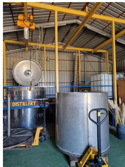
Slika 4: Destilerija u sklopu nasada

U razgovoru s vlasnikom nasada otkrivene su prednosti i nedostaci bavljenja ovim načinom poljoprivrede na Krku. Prvi problem s kojim se vlasnik susreo bio je dobivanje državnog zemljišta u zakup te sama investicija. Zatim se nakon par godina otkupna cijena smilja drastično smanjila zbog naglih porasta nasada pa je time i sama opstojnost bila upitna. Ipak, veliku važnost u ovoj situaciji odigrao je turizam. Nasad ima vrlo dobru lokaciju koja se nalazi nedaleko glavne prometnice pa je vlasnik odlučio uvrstiti nasad u turističku ponudu u kojoj organizira vođene ture na svom nasadu, predstavljanje procesa proizvodnje i prerade, a samim time prodaje i mnogo proizvoda koje proizvodi u krugu obitelji te na taj način postiže veću