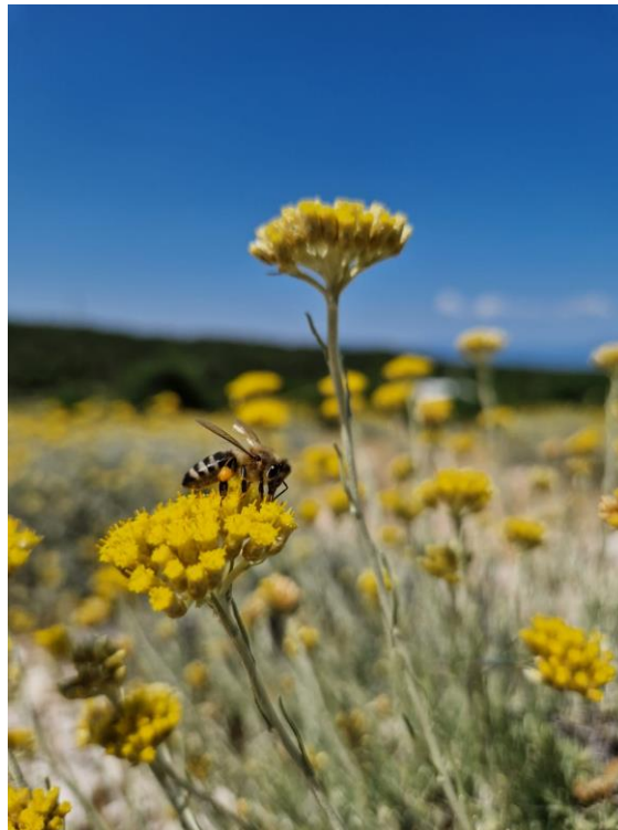
Slika 16: Cvat smilja

Sastav: flavonoidi, narinengin, helikrizin, apigenin