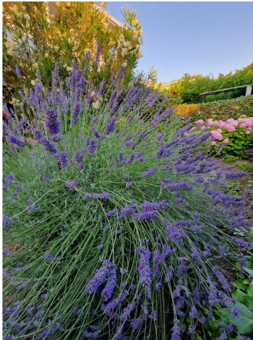
Slika 15: Lavanda kao ukrasna biljka u jednom od mnogih vrtova Autor: Derenčinović L., 2023.

karminativ te pomaže u zacjeljivanju rana. Osim u te svrhe, lavanda je također vrlo medonosna biljka. S obzirom na ljepotu, korisnost i miris, lavanda se nerijetko uzgaja u javnim i privatnim vrtovima (Slika 15) te je jedan od simbola Mediterana. U Hrvatskoj se najviše lavande, odnosno lavandina ( Lavandula x hybrida Reverchon), proizvodi na otoku Hvaru gdje joj pogoduje visoka insolacija, a godišnje se proizvede 60 – 80 t (Šilješ i sur., 1992.).