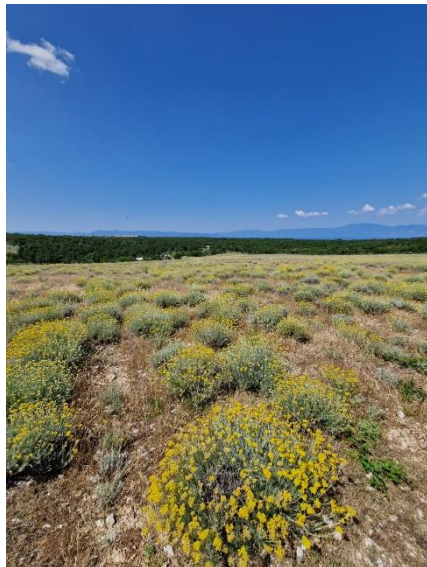
Slika 3: Nasad smilja pokraj Omišlja Autor: Derenčinović L., 2023.

Prvi takav nasad nalazi se u samoj blizini Krčkog mosta. Sastoji se od 8 ha zasađenog smilja na kojem se nalazi 360 000 biljaka, a sam nasad podignut je 2016. g (Slika 3 i 4). Teren karakterizira niska šikara koja je mehanizacijom uklonjena, a nakon nje je izvedena obrada tla mljevenjem kamena kako bi se dobilo plodnije i obradivo tlo. Uz sam nasad nalazi se i montažni objekt u koji je smještena vlastita destilerija te se ujedno u sklopu nje odvijaju predstavljanja proizvodnje i proizvoda. Smilje se uzgaja prema ekološkim principima, a njega usjeva se djelomično obavlja prirodno. Prirodno na način da na nasadu boravi par ovaca koje inače ne jedu smilje pa na taj način uklanjaju međuredne korovne vrste, a ujedno i gnoje tlo. Berba se odvija jednom godišnje i to u prosincu kada se bere zelen zbog toga što je praksa pokazala da ta berba daje više ulja nego berba cvijeta i zeleni u lipnju, a odvija se motornom kosačicom.