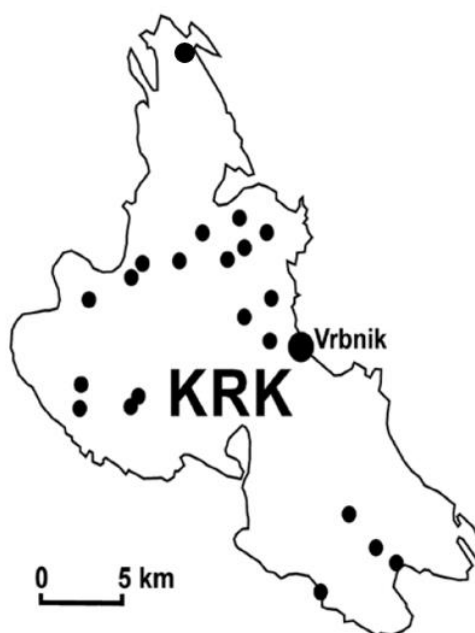
Slika 2: Prikaz istraživanih lokacija na otoku Krku

Podaci u tablici uvršteni su temeljem osobnog zapažanja u prirodi te relevantnih istraživanja u sljedećim autorstvima: Trinajstić i Lovrić (1970), Orlić (2015), Dolina i sur., (2016). koji se referiraju na vlastita zapažanja te zapažanja Žica iz 1900. (one biljne vrste koje je detektirao isključivo Žic označene su samo njegovim prezimenom, iako se rad referira na radove autora Dolina i sur. (2016.) te Łuczaj i sur. (2019). Podaci o korištenju određenih biljnih droga pronađeni su u navedenim istraživanjima, diplomskom radu Fabris (2022), web stranici Plantea (2014). te također iz osobnih zapažanja.