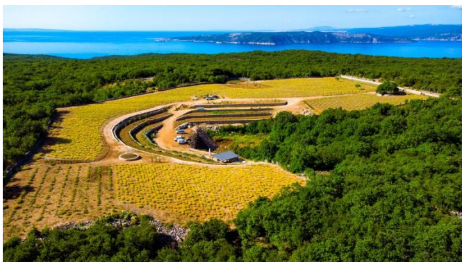
Slika 6: Nasad Kusshh

Drugi nasad sličnog karaktera nalazi se nedaleko grada Krka, a podignut je 2015. g. u suradnji dvije prijateljice – Monike i Nives. Nasad, kao i istoimeni brend, pod nazivom Kusshh zauzima površinu od 3,1 ha s 85 000 biljaka različitih biljnih vrsta (oko 40) koje se prerađuju u tridesetak proizvoda (Slika 6 i 7). Neke od ljekovitih biljnih vrsta koje se ondje uzgajaju jesu smilje, kadulja, lavanda, lavandin, lovor, ružmarin i bazga. Proizvodi i prerađevine navedenih biljaka su kozmetičke i prehrambene naravi pa se tako u ponudi mogu pronaći eterična ulja, hidrolati, kreme, balzami i sl., ali također i rakije, likeri i sirupi. Osim toga, jedan dio proizvoda posvećen je i zaštiti kućnih ljubimaca od nametnika poput buha i krpelja. Prodaja samih proizvoda, osim na web shopu, prodaje se lokalno u gradu Krku i Vrbniku pa su na taj način također uvršteni u autentičnu turističku ponudu otoka.