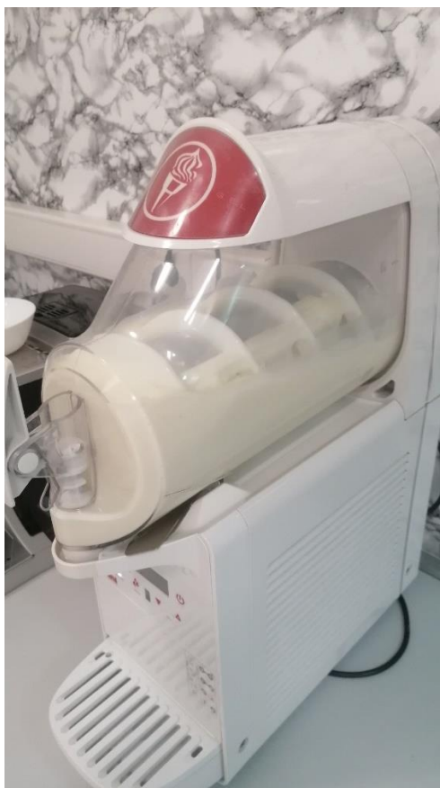
Slika 3.1.3. Sladoledna smjesa prije početka smrzavanja

Nakon završenog zrenja sladoledne smjese slijedio je postupak proizvodnje sladoleda (slika 3.1.3.) koji obuhvaća smrzavanje sladoledne smjese uz istovremenu inkorporaciju zraka (slika 3.1.4.) u uređaju Ugolini MiniGel Plus (Italija). Postupak proizvodnje sladoleda trajao je oko 1h odnosno do postizanja temperature smrzavanja od -7,5\text{ }^{\circ}\text{C} kada se punio u plastične čašice (slika 3.1.5.). Senzorska svojstva sladoleda ocijenjena su odmah po završetku proizvodnje sladoleda.