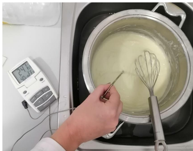
Slika 3.1.2. Mjerenje temperature smjese