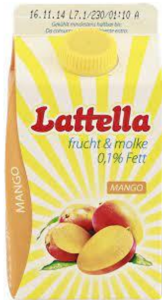
Slika 2.2.2 Lattella

Tekuća sirutka se koristi u proizvodnji napitaka još od 460 godina prije Krista. Otac suvremene medicine Hipokrat preporučao je sirutku u terapiji mnogih bolesti poput tuberkuloze, žutice, kožnih bolesti itd. Tako su još u 19. stoljeću Njemačka, Švicarska i Austrija počele proizvoditi napitke na bazi sirutke koja su se preporučala u terapiji protiv dijareje, anemije, bolesti jetre. Te zemlje su i dan danas najveći proizvođači napitaka od sirutke na bazi voća i povrća poput austrijske Latella (slika 2.2.2.) i švicarske Rivella (slika 2.2.3.).