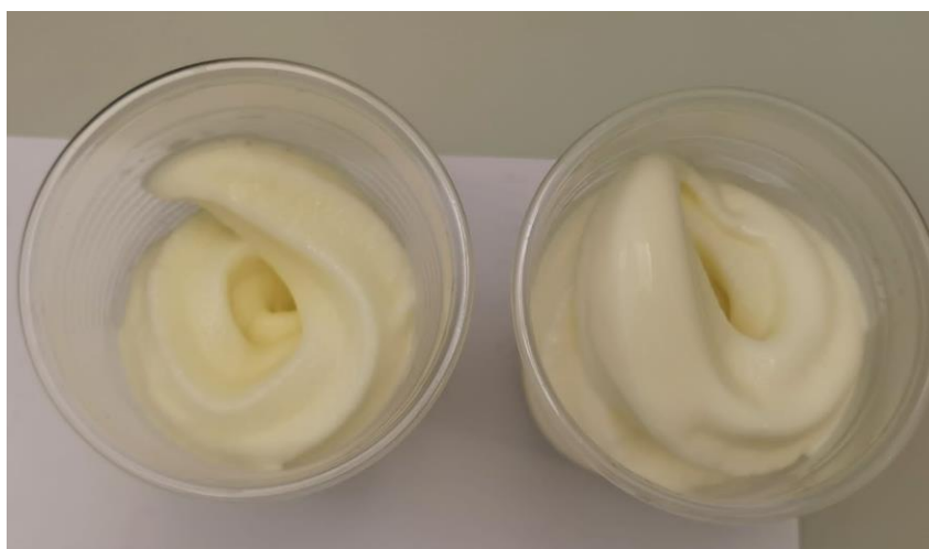
Slika 3.1.5. Sladoled