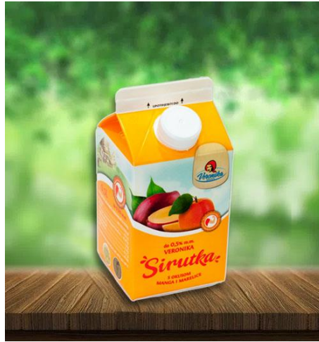
Slika 2.2.4. Sirutka s okusom manga i marelice

U Hrvatskoj aromatizirane sirutke proizvode mljekara Meggle i Veronika. Problem korištenja sirutke u proizvodnji napitka duljeg roka trajanja je stvaranje taloga zbog denaturacije proteina sirutke i taloženja mineralnih tvari (Tratnik, 2012.).