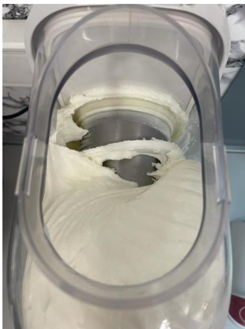
Slika 3.1.4. Smrzavanje sladoledne smjese