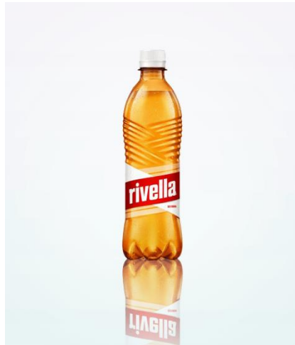
Slika 2.2.3 Rivella