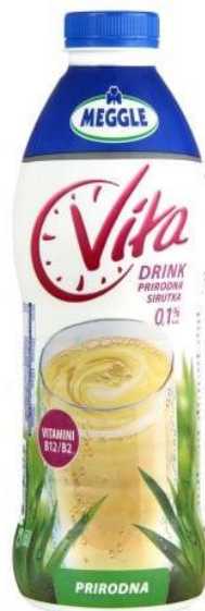
Slika 2.2.5. Meggle Vita sirutka