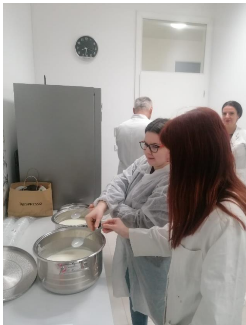
Slika 3.1.1. Miješanje sastojaka

Prvi korak u pripremi sladoledne smjese čini miješanje suhih sastojaka (obrano mlijeko u prahu, guar guma, šećer) koji su potom dodani u posudu s vodom te homogenizirani štapnim mikserom pri čemu je dodano kiselo vrhnje (slika 3.1.1.). Nakon toga pristupljeno je pasterizaciji smjese na 80°C/10 min uz stalno miješanje. Temperatura pasterizacije mjerila se ubodnim termometrom uranjanjem u posudu sa sladolednom smjesom (slika 3.1.2.). Po završetku postupka pasterizacije pristupilo se postupku hlađenja smjese do temperature od 15°C (urananjem posude sa smjesom u ledenu vodu) nakon čega je smjesa homogenizirana štapnim mikserom uz dodavanje jogurta odnosno sirutke pri čemu je omjer miješanja dijela sladoledne smjese i jogurta odnosno sirutke bio 1 : 1. Slijedio je postupak zrenja sladoledne smjese u hladnjaku na 4°C/ 12h.