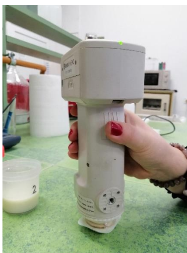
Slika 3.3.1. Određivanje boje sladoledne smjese

Analize viskoznosti i boje sladolednih smjesa provedene su u Laboratoriju za tehnologiju mlijeka i mliječnih proizvoda na Zavodu za prehrambeno- tehnološko inženjerstvo na Prehrambeno- biološkom fakultetu u Zagrebu. Za mjerenje viskoznosti korišten je rotacijski reometar RM-180 Rheometric Scientific (Rheometric, Inc., Piscataway, SAD). Utvrđen je napon smicanja T (Pa), prividna viskoznost \mu (mPas), koeficijent konzistencije (mPas) te indeks tečenja pri različitim brzinama smicanja ( s^{-1} ) prema metodi Krešić i sur. (2008). Analize su provedne u duplikatu. Određivanje boje sladolednih smjesa (slika 5.3.1.) provedeno je kolorimetrom CM-3500d (Konica Minolta, Japan). Korištena je maska otvora 8 mm, a mjerenja su bila provedena u SCE (Specular Component Excluded) modu. Mjerila se reflektancija uzoraka u vidljivom području ( L^* , a^* i b^* vrijednosti). Analize su provedene u triplicatu.