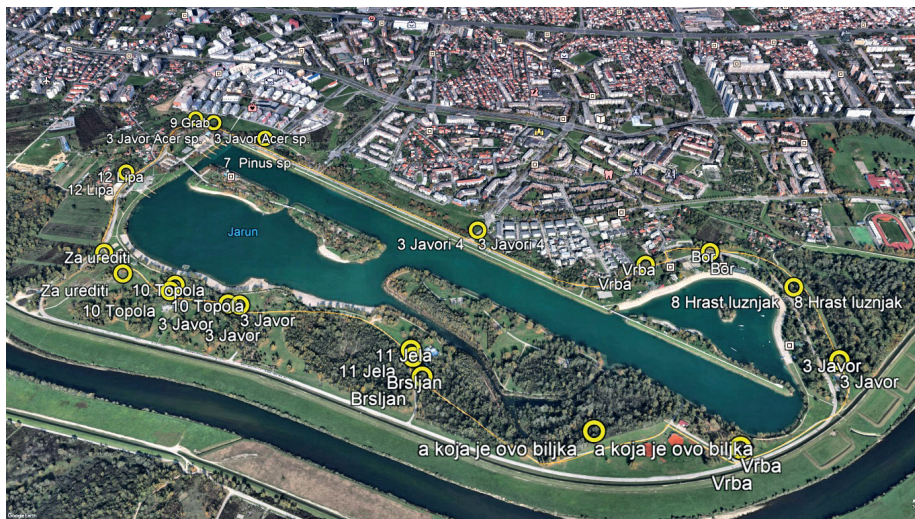
Slika 2. Orijeatcijska karta s ucrtanim drvenastim biljkama uz rolersku stazu na Jarunu (Martinis, 2018.)