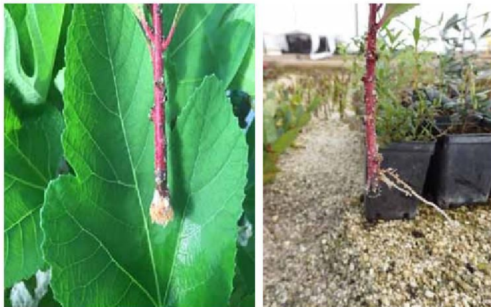
Slika 4. Stvaranje kalusa i ožiljavanje reznice planike Image 4. Callus development and rooting of the strawberry tree cuttings

Reznice uzete krajem siječnja (VU1) dobro su kalusirale, ali su slabo razvile korijen (Slika 4), a postotak ožiljavanja je iznosio 30% (Graf 1). Kod reznica koje su uzete krajem ožujka (VU2) korijen se dobro razvio (Slika 5) na 58% reznica (Graf 1) koje su uspješno nastavile s rastom nakon presađivanja u kontejnere (Slika 6).