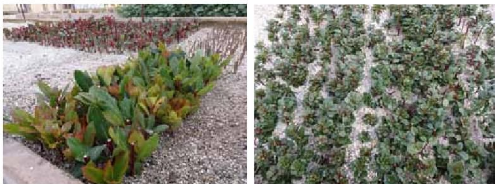
Slika 3. Reznice planike u postupku ožiljavanja Image 3. The strawberry tree cuttings in the process of rooting