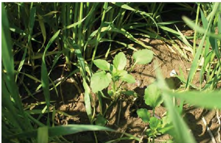
Slika 8. Korovna vrsta V. arvensis (poljska ljubica) u usjevu pšenice

Bodendorfer, 1998; Degenhardt i sur., 2004). Kod V. arvensis važnije su neizravne štete (Bachthaler i sur., 1986) jer problem nastaje pri žetvi usjeva kad je prisutno oko pet sjemenaka po jednoj biljci V. arvensis u žetvi, a osim sjemena kombajnom zahvaćeno biljno tkivo V. arvensis može utjecati na povećanje vlage sjemena žitarica.