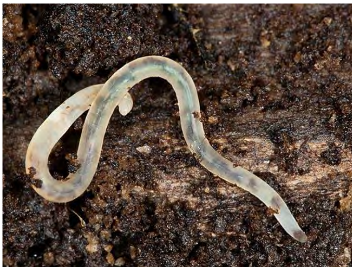
Slika 2. Gujavica iz porodice Enchytraeidae