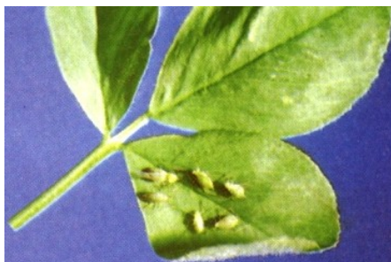
Slika 7. Zelena lucernina uš. Figure 7. Aphididae.

Kukci dužine 2 do 3 mm, najčešće zelene, ali mogu biti smeđe, žute i crne boje (Slika 7.). Imago mogu imati krila, ali mogu biti i bez njih. Imaju dugačke noge i ticala te dobro razvijen usni aparat. Na bokovima imaju izraslinu kroz koju izlučuju voštanu tvar, dok tekućinu "mednu rosu" izbacuju kroz analni otvor. Tijekom godine mogu imati i do 10 generacija. Najveći napad ovog štetnika se javlja tijekom lipnja kada uši prekriju cijelu biljku i sisanjem sokova sprječavaju njezin daljnji razvitak. Prate se žutim pločama (Maceljski 2002.).