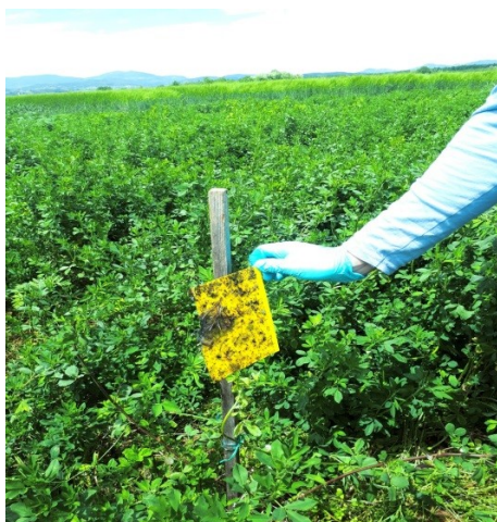
Slika 12. Postavljena žuta ljepljiva ploča.

Na polje lucerne postavljane su četiri žute ljepljive ploče na jednaku udaljenost po sredini usjeva. Za postavljanje žutih ljepljivih ploča bili su potrebni drveni štap koji je bio uboden u zemlju i same žute ljepljive ploče koje su postavljane na sredinu štapa (Slika 12.). Prilikom prikupljanja kukaca ploče su skidane s drvenog štapa. Na njih je potom stavljana aluminijska folija da bi se zaštitili kukci te da bi ostali neoštećeni do identifikacije. Nova žuta ljepljiva ploča stavljana je na drveni štap svakih tjedan dana.