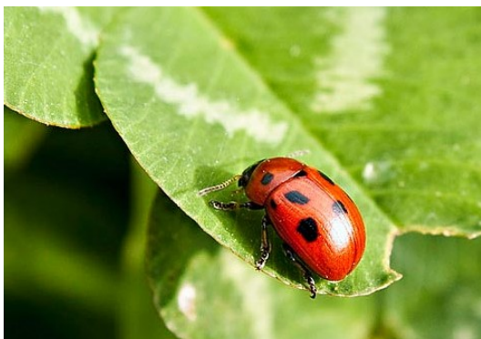
Slika 2. Lucernina zlatica