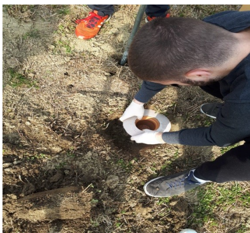
Slika 10. Postavljanje pitfall mamca. Figure 10. Setting the pitfall trap.

U usjevu lucerne bilo je postavljeno šest pitfall mamaca. Prva dva mamca su bila postavljena na samom početku usjeva lucerne, dva u sredini i dva na suprotnom kraju. Pitfall mamac se sastoji od plastične kalenice i okruglog cementiranog okvira, odnosno prstena. Prvi korak postavljanja pitfall mamca je iskopati rupu dubine oko 15 do 20 cm. Zatim se okrugli cementirani prsten ukopava u zemlju tako da bude na njenoj površini te se unutar prstena stavlja plastična kalenica koja također mora biti postavljena u razini površine zemlje kako bi se osigurao siguran put ulova entomofaune (Slika 10.). Rupa zajedno s mamcem se zatrpava zemljom do vrha tako da je na kraju vidljiv cementirani okvir i vrh kalenice te se mamac ispuni smjesom vode i soli čija je zadaća usmrtiti ulovljene kukce. Pitfall mamac se mijenjao tako da bi se kalenica vadila iz zemlje, voda zajedno s kukcima koja je bila unutar kalenice prelijevala se u plastične posudice koje su bile označene brojem, datumom sakupljanja uzoraka, lokacijom provođenja pokusa. Na kraju se kalenica vraćala u zemlju te se punila smjesom vode i soli.