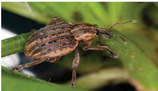
Slika 1. Lucernina lisna pipa.

Figure 1. The alfalfa weevil.