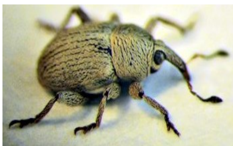
Slika 3. Pipa lucernina sjemena. Figure 3. Tychius flavus.

Tijelo je ovalno izduženoga oblika, ima povijenu rilicu koja je kraća od vratnoga štita (Slika 3.). Tijelo je dugačko 2 do 3 mm. Ličinka je valjkastoga oblika, mliječnoblijede boje i prekrivena je bijelim kratkim dlačicama. To je važan štetnik u sjemenskoj proizvodnji lucerne. Odrasli (imago) se javlja u proljeće kada temperatura poraste iznad 12 °C. Hrane se lišćem i cvatovima. Ženka odlaže više od desetak jaja na sjeme kroz zelenu mahunu. Razvoj ličinke traje 10 do 20 dana, svaka ličinka ošteti 2 do 4 sjemenke. Odrasle ličinke se kukulje u tlu i izlaze iz tla iduće godine. Pipa lucernina sjemena ima jednu generaciju godišnje. Praćenje ovog štetnika se obavlja kečerom. Prag odluke za primjenu insekticida se smatra kada se svakim zamahom kečera uhvati jedna pipa tijekom cvatnje. Zaraza ovim štetnikom se može smanjiti pravovremenom košnjom (Maceljčki, 2002).