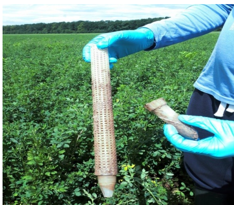
Slika 11. Endogejski mamac.

Figure 11. Endogeic trap.