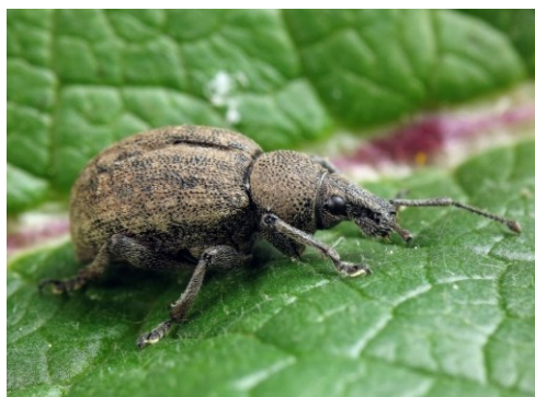
Slika 4. Lucernina velika pipa. Figure 4. Otiorhynchus ligustici.

Tijelo lucernine velike pipe je dugačko 10 do 14 mm, nema krila pa ne leti (Maceljčki, 2002). Smeđe je boje i pokrile joj je sraslo (Slika 4.). Odrasli oblici se javljaju u travnju. Hrane se noću, a tijekom dana se zakopavaju u tlo. Hrane se vršnim dijelovima stabljike i tako čine štete na odraslim biljkama. Ženke odlažu 200-400 jaja u površini tla. Ličinke prezime prvu godinu, a iduće godine nastavljaju s ishranom te se iste godine kukulje u tlu, dok odrasli oblici iz tla izlaze idućeg proljeća. Razvoj jedne generacije lucernine velike pipe traje dvije godine. Ličinke se hrane korijenom biljke pritom čineći jako velike štete. Praćenje se obavlja lovnim posudama (Maceljčki, 2002).