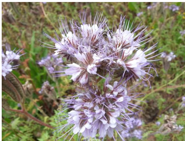
Slika 3. Cvat facelije

Zbog atraktivnih cvjetova (Slika 3) te čvrste i žilave stabljike facelija se može koristiti kao svježe rezano cvijeće jer u vazama s vodom prilično dugo ostaje svježija (Gilbert, 2003), ali se može iskoristiti i kao sušena dekoracija. Visoka dekorativna vrijednost facelije može se upotrijebiti pri izradi kamenjara, cvjetnih gredica, cvjetnih otoka, te za cvjetne rubove (Wróblewska, 2010). Uzgojem facelije na rubnim dijelovima prometnica, na nasipima i drugim površinama koje su obično zapuštene i zakorovljene postigao bi se estetski i zaštitni učinak (Hulina, 1993).