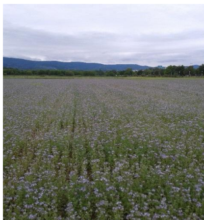
Slika 1. Usjev facelije

Facelija je biljna vrsta porijeklom iz jugozapadnog dijela Sjeverne Amerike (Kalifornija, Meksiko) koja je uvedena u Europu u 19. stoljeću kao medonosna, ukrasna i krmna biljka (Hulina, 1993; Gilbert, 2003; Hulina, 2011; Popović et al., 2017b). Osim u Americi danas je prisutna i u Europi i Australiji. Facelija se može koristiti za različite namjene: za zelenu gnojdbu, kao zaštitni i pokrovni usjev, kao krmna kultura za proizvodnju zelene krme, silaže i sijena, kao antierozivna vrsta, nematocidna vrsta, te kao odlična pčelinja paša, ljekovita, ali i ukrasna vrsta (Petanidou, 2003; Svečnjak, 2007; Popović et al., 2020) (Slika 1).