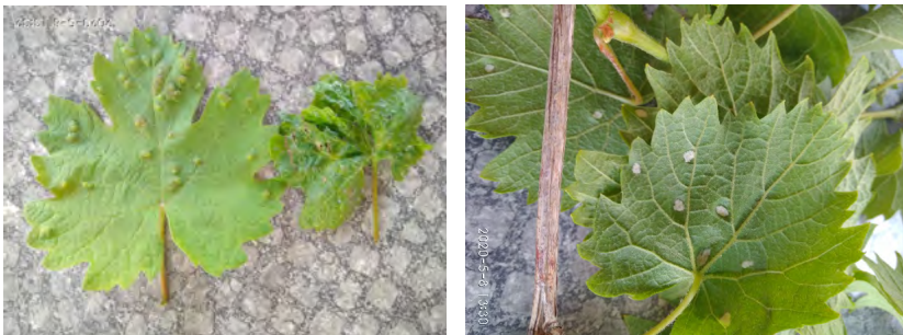
Slika 2. Erinoza (prvi list) i akarinoza (drugi list) na licu lista (lijevo) i erinoza na naličju lista (desno)