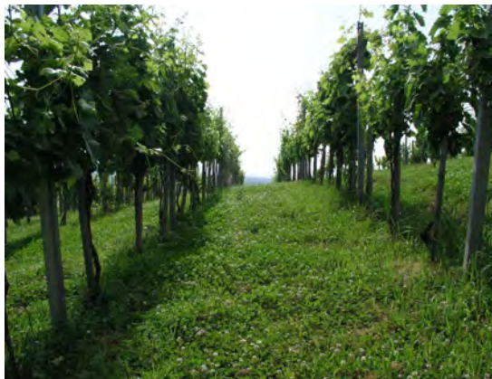
Slika 4. Primjer zatravljivanja ukupne površine spontanom florom i primjer cvatnje djeteline (privlači pčele) neposredno nakon košnje

Treba spomenuti da brojni autori preporučuju smjesi dodati određene leguminoze (bijelu djetelinu, zvjezdan), što sigurno ima velike prednosti (osobito s gledišta dužine trajanja zelenog pokrova, vezanja atmosferskog dušika i sl.), a s ekološkog se gledišta općenito procjenjuje da ih nije dobro dodavati u smjesu trava. Naime, bez obzira na čestu košnju, pojedine cvjetne glavice djetelina i zvjezdana izmaknu zahvatu noža kose ili malčera (slika 4).