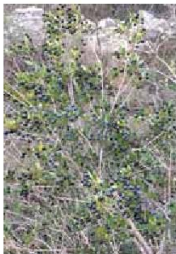
Slika 1. Grm mirte u prirodi / Picture 1. Myrtle shrub in nature

U tablici 1 prikazan je osnovni kemijski sastav plodova mirte. Plodovi mirte sadržavaju eterična ulja koja su razlog njihovog jakog aromatičnog mirisa (Usai i sur., 2018). U nezrelim plodovima prevladava gorki i adstringentni okus koji se javlja zbog sadržaja tanina, a dozrijevanjem plodovi postaju tamniji slatkasti i gorčina se gubi (Slika 2). Zbog dobrih antioksidativnih svojstava, Tuberoso i sur. (2010), preporučuju korištenje ekstrakta plodova u prehrambene i medicinske svrhe. U narodnoj medicini mirta se koristi za liječenje raznih bolesti, kao što su bolesti probavnog trakta te urinarnih i kožnih oboljenja. Plodovi djeluju protuupalno, antitumorno te imaju antitrombotično djelovanje (Giamipieri i sur., 2020). Plodovi sadrže oko 1,41-1,28% ukupnih šećera, 0,006-0,33% ukupnih kiselina, sadržaj proteina se kreće od 4,17 do 9,02%, dok sadržaj ugljikohidrata i celuloze čini oko 79,78% (Fadda i Mulas, 2010; Şan i sur., 2015; Haciseferoğulları i sur., 2012; Aydin i Özcan, 2007; Corredu i sur., 2019). Od organskih kiselina, u plodovima su u najvećoj mjeri zastupljene limunska, askorbinska, vinska, taninska te jabučna kiselina. Značajan sadržaj ima limunska kiselina koja u plodovima iznosi oko 120,00-1104,85 mg/100g (Giampieri i sur., 2020; Haciseferoğulları i sur., 2012; Fada i sur., 2016). U najvećem udjelu u plodovima nalazimo fenolne spojeve, flavanoide i antocijane (Sumbul i sur., 2011), koji su esencijalni kako za biljku tako i za ljudsko zdravlje.