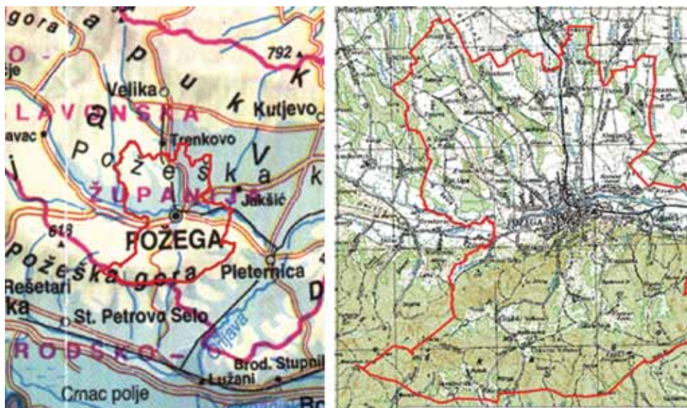
Slika 1. Položaj administrativnog područja grada Požege na topografskim kartama

Područje Grada Požege zauzima površinu od 13 343 ha te administrativno pripada u Požeško-slavonsku županiju, a smješteno je u Središnjoj panonskoj poljoprivrednoj podregiji. Prostire se između živopisnih zelenih južnih obronaka Papuka i sjevernih obronaka Požeške gore, a na prostoru između njih prema prikazu na sl. 1 nalazi se dolina rijeke Orpljave.