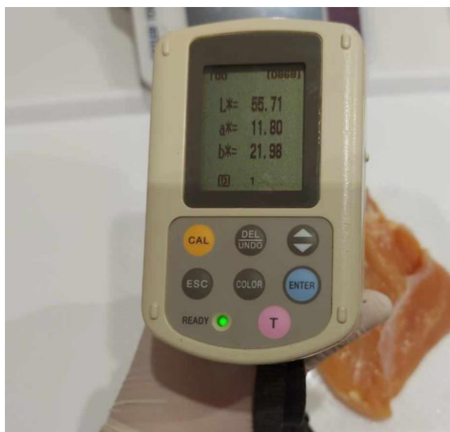
Slika 3.4. Mjerenje boje mesa ( L^* , a^* i b^* ) pomoću Minolta kolorimetra s 50 mm dijametarskim područjem mjerenja