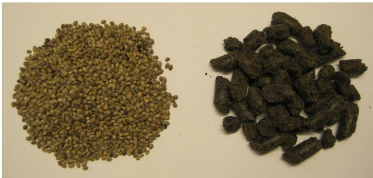
Slika 2.3. Sjeme (lijevo) i pogača (desno) konoplje