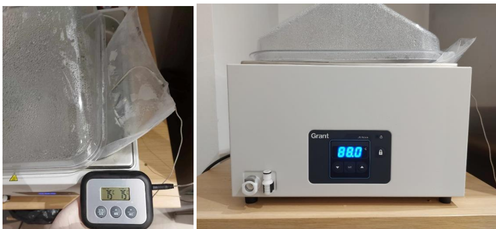
Slika 3.2. Termička obrada pilećih prsa u kupelji (kalo kuhanja)

Klanje i klaonička obrada pokusnih jedinki obavljeno je prema standardnim postupcima obrade. U svrhu određivanja sposobnosti zadržavanja vode (SZV), vrijednosti pH i boje mesa iz svake skupine izuzeta su po tri uzorka prsnog mišićja ( m. pectoralis superficialis ). Svaki od uzoraka je izvagan, označen i skladišten na -20 °C do provedbe analiza. Prije provedbe analiza uzorci su prebačeni u rashladni uređaj u kojem su bili podvrgnuti postupku odmrzavanja u konvencionalnim uvjetima (+ 4 °C tijekom 24 sata). SZV je je izražena kroz kalo odmrzavanja i kalo kuhanja (slika 3.2.) metodom po Honikel-u (1998.). Vrijednosti pH su izmjerene ubodnom elektrodom pomoću prijenosnog pH-metra IQ 150 (slika 3.3.), a pokazatelji boje mesa su izmjereni pomoću Minolta kolorimetra s 50 mm dijametarskim područjem mjerenja (slika 3.4.).