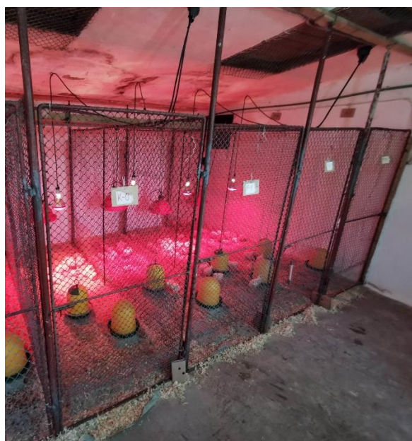
Slika 3.1. Jednodnevni pilići podijeljeni u četiri skupine (K-0, P-1, P-2 i P-3)

Istraživanje je provedeno na 100 Ross muških pilića, podijeljenih u 4 pokusne skupine s 25 pilića u svakoj (slika 3.1.). Jednodnevni pilići su izvagani te smješteni u odjeljke odvojene žičanom mrežom. Objekt je prethodno pripremljen i dezinficiran sredstvom Vadesept u koncentraciji od 3%. Pilići su bili držani podno, u boksovima, prema tehnološkim normativima (33 kg/m 2 ). Na betonski pod stavljena je prostirka od suhe blanjevine, debljine cca 10 cm koja je također dezinficirana, a nakon što se posušila preko nje je navučen papir za prijem jednodnevne peradi. Papir je imao ulogu smanjenja konzumacije sitnih dijelova prostirke i rastepa krmne smjese u prvih sedam dana tova. Uvjeti držanja bili su za sve skupine ujednačeni. Ventilacija je u objektu bila prirodna (gravitacijska), a pilići su grijani infracrvenim žaruljama jačine 250 W. Objekt je dodatno grijan s dva električna radijatora. Temperatura u zoni boravka pilića iznosila je 32 °C na početku pokusa, te je postepeno snižavana u skladu s tehnološkim normativima.