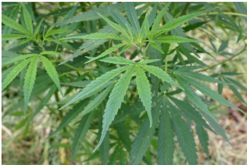
Slika 2.1. List konoplje

List konoplje je prstastog oblika i sastoji se od peteljke i plojke. Prvi par listova je jednostavan i po obodu nazubljen, sastoji se od jednog segmenta. Drugi par listova sastoji se od 3 segmenta, a svakom idućem paru listova raste broj segmenata prema principu 1 – 3 – 5 – 7 – 9 – 11. Broj listova i veličina plojke su sortna svojstva, dok boja može varirati od svijetlo do intenzivno zelene boje (Pospišil, 2013.). Dužina i širina segmenata također može varirati, a u prosjeku su dugi od 5 do 18 cm, a široki od 0,5 do 2,5 cm. Listovi ženskih biljaka sadrže više segmenata i veći su od listova muških biljaka (Butorac, 2009.).