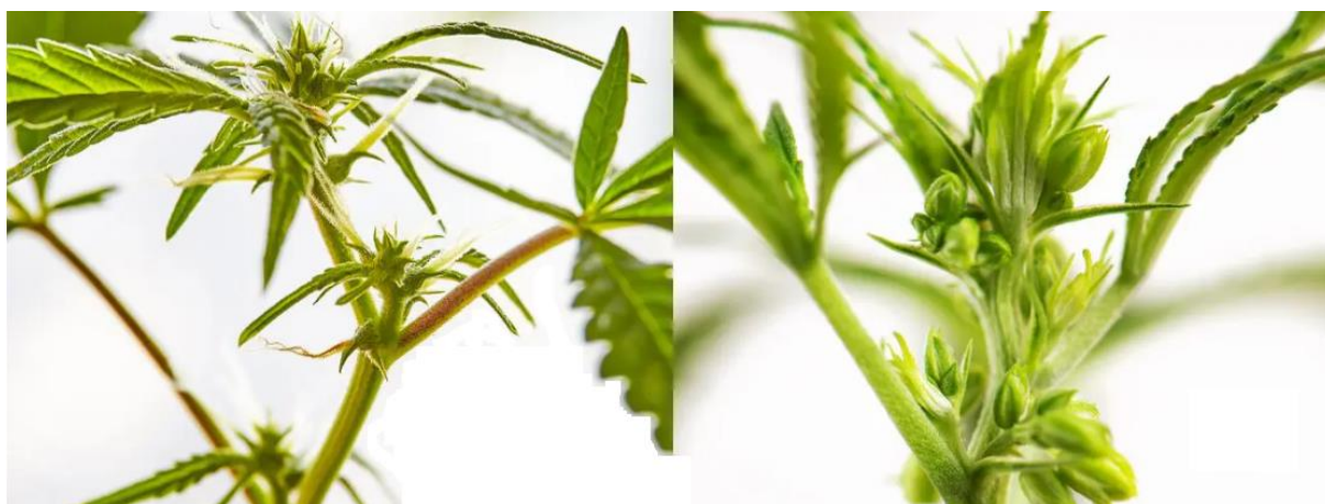
Slika 2.2. Cvijet ženske (lijevo) i muške (desno) biljke konoplje

Konoplju ubrajamo u dvodomne biljke, što znači da se dijeli na muške i ženske biljke koje se međusobno razlikuju. Muške biljke, također poznate kao bjelojke, imaju manje listova i svjetliju stabljiku u usporedbi s ženskim biljkama. Njihov cvijet je rahao i žute boje, ima dugu stapku te se sastoji od pet prašnika i perigona koji rastu na vrhovima biljke. Ženske biljke, poznate kao crnojke, imaju cvjetove smještene u pazušcima listova koji zauzimaju gornju trećinu stabljike i tvore cvat. Cvijet je sastavljen od ovojnog listića, perigona i tučka s dvije njuške (Butorac, 2009.). Muške biljke cvatu tijekom 15 do 35 dana, dok ženske biljke cvatu do 30 dana. Sazrijevanje sjemena traje 30 do 40 dana (Pospišil, 2013.).