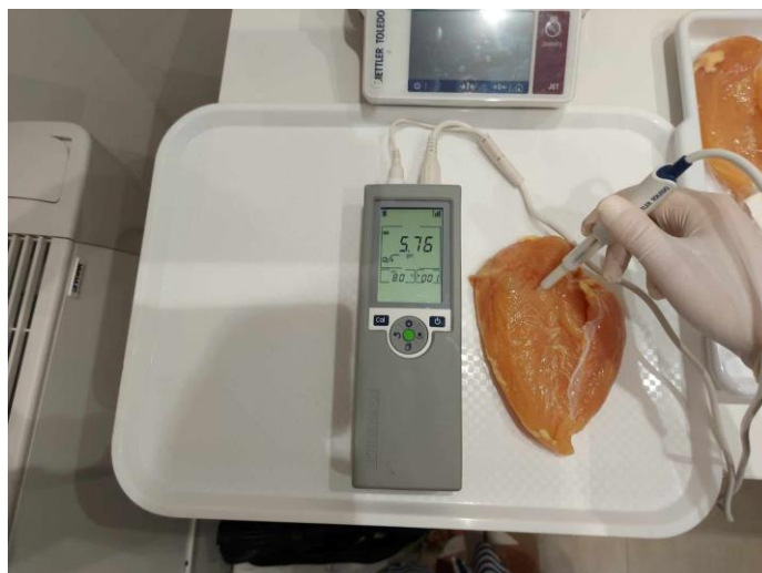
Slika 3.3. Mjerenje pH vrijednosti ubodnom elektrodom pomoću prijenosnog pH-metra IQ 150