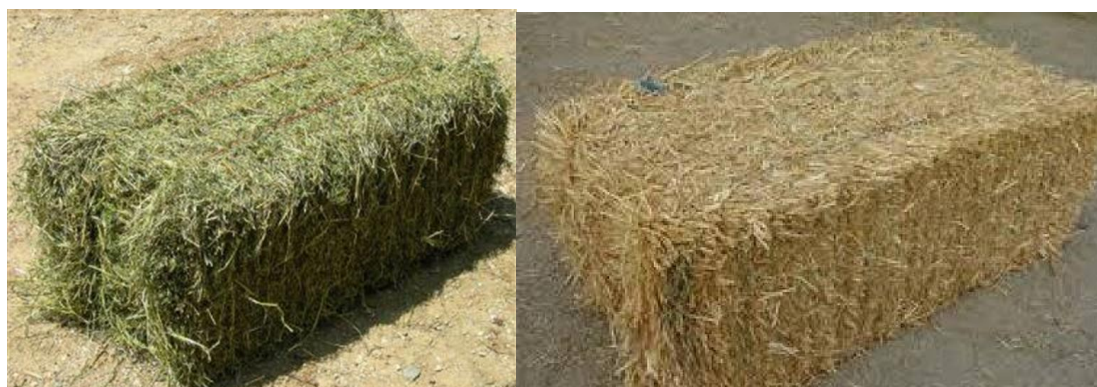
Slika 4. Prikaz razlike između sijena (lijevo) i slame (desno)