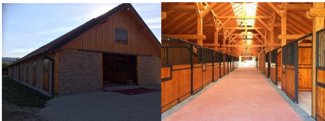
Slika 3. Prikaz kvalitetno napravljene staje za konje