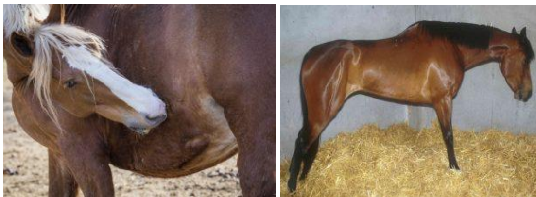
Slika 5.8. Prikaz nekih od simptoma kolika

Jaka abdominalna bol: profuzno znojenje, konstantno valjanje, stalno kretanje, naglo ustajanje i lijeganje