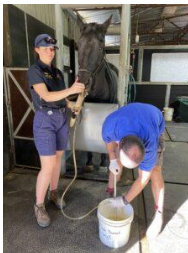
Slika 5.9. Sondiranje konja

Veterinari često rade rektalni pregled jer im sadržaj crijeva i njihov položaj mogu sugerirati postojanje ili odsutnost pasaže, kao i mjesto začepa ili implikacije. Sondiranje veterinaru pruža dodatne informacije o ozbiljnosti problema: nalaz plina ili tekućine. Herak- Perković, Grabarević, Kos (2012.)