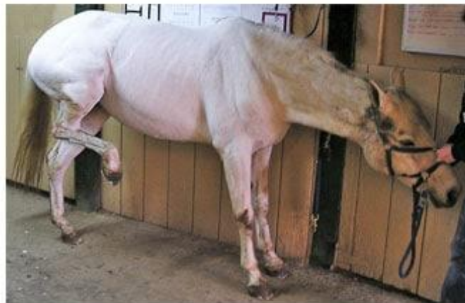
Slika 5. Prikaz konja s kolikom

Uzroci kolika su mnogobrojni, od nepravilne hranidbe, nedostatka vode, neadekvatnog iskorištavanja, vremenskih promjena dopotpuno nepoznatih uzroka. U kolike konja ubrajamo crijevni grč, akutno proširenje želuca, kronično proširenje želuca, nadam crijeva, začep crijeva i zapetljaj crijeva.