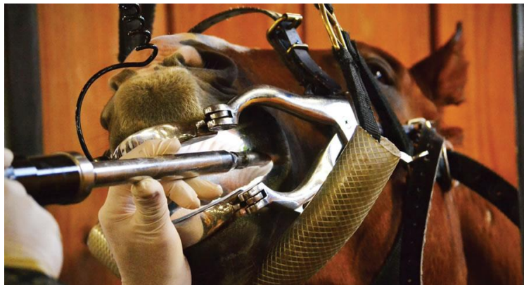
Slika 5.12. Korekcija zuba kod konja

Učestalost pojavnosti kolika možemo spriječiti pravilnim držanjem i hranidbom konja. Važno je konjima omogućiti redovito kretanje, socijalizaciju s drugim konjima, omogućiti ispašu, redovite godišnje preglede i prema potrebi korekcije zubala (slika 5.12.), redovitu primjenu antiparazitika uz održavanje pašnjaka, omogućiti stalan pristup čistoj, svježoj vodi. Također potrebno je konjima postaviti i solni kamen u blizini vode, jer na taj način potičemo konja da pije veće količine vode.