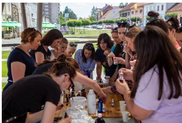
Slika 4.10. Radionica izrade prirodne kozmetike