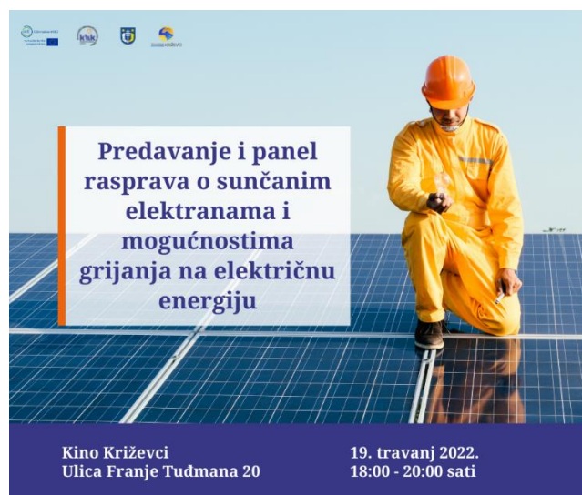
Slika 4.7. Vizual predavanja i panel rasprave o sunčanim elektranama i mogućnostima prelaska na električnu energiju

Slika 4.7. u nastavku prikazuje poziv na predavanje i panel raspravu o grijanju na električnu energiju, ovim se vizualom događaja energetska zadruga koristila prilikom oglašavanja predavanja u medijima te na vlastitim stranicama (službena web stranica, Facebook, Instagram).