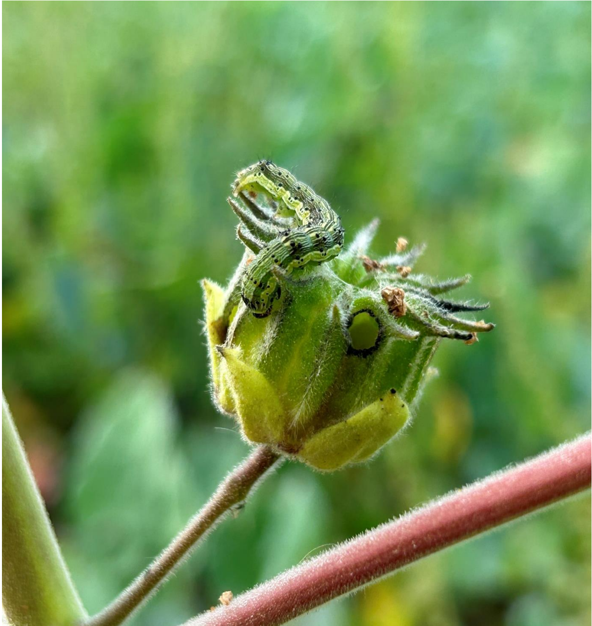
Slika 5.3.9. Karakteristični okrugli otvori nastali ubušivanjem vrste Heliopsis armigera u tobolac europskog mračnjaka