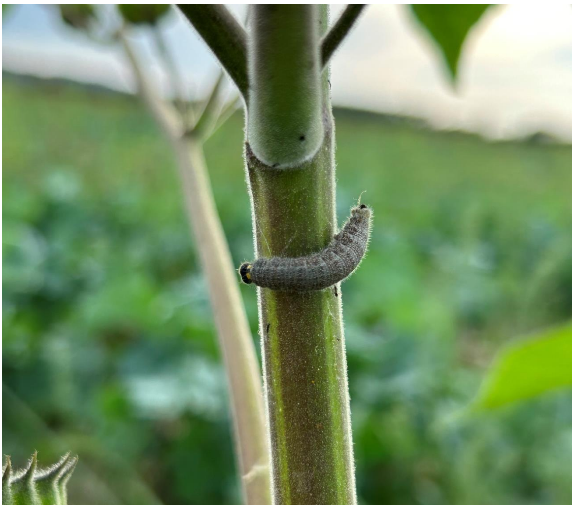
Slika 5.3.7. Gusjenica vrste Carcharodus alceae Esp. na stabljici europskog mračnjaka