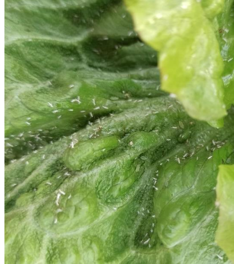
Slika 2.2.3.2. Krilati oblici lisnih uši

Za praćenje prisutnosti lisnih ušiju koriste se žute posude i ljepljive ploče, kao i vizualni pregled biljaka. U cilju prevencije, poduzimaju se sljedeće mjere: eliminacija korova koji mogu biti domaćini lisnim ušima unutar ili oko nasada, te postavljanje mreža na otvorima u zaštićenim prostorima (Beljan i Župić, 2002.). Kako navodi Maceljski (1999.), za suzbijanje lisnih uši važni su i prirodni neprijatelji koji se koriste za kontrolu pojave i širenja lisnih uši. Neki od njih su bogomoljke ( Mantodea ), zlatooke ( Chrysopidae ), božje ovčice (slika 2.2.3.3.) vrsta Coccinella septempunctata i Adalia bipunctata , trčci ( Carabidae ), te grabežljive stjenice.