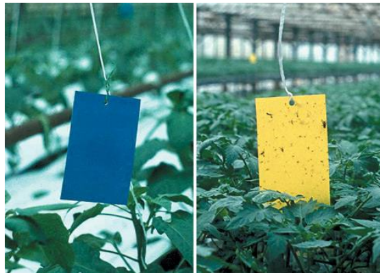
Slika 2.2.5.1. Ljepljive ploče za kontrolu tripsa

Kalifornijski trips ( Frankliniella occidentalis ) predstavlja značajnog štetnika u uzgoju salate. Učinkovito suzbijanje ovog štetnika zahtijeva pažljivo razmatranje niza faktora. Prvo, važno je uzeti u obzir vremenske uvjete i okolne usjeve i korove domačine jer to može utjecati na brojnost tripsa. Toplo vrijeme obično povećava brojnost tripsa, pa se preporučuje redovito praćenje pomoću plavih i žutih ljepljivih ploča, a s njima je također moguće i smanjiti populaciju u zaštićenim prostorima (slika 2.2.5.1.).