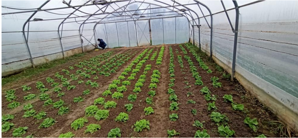
Slika 2.1.5.1. Uzgoj salate u plasteniku