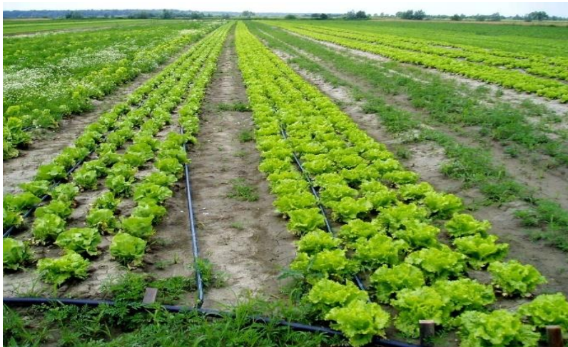
Slika 2.1.4.1. Uzgoj salate na otvorenom

Rokovi sjetve i sadnje za uzgoj na otvorenom ovise o mnogim čimbenicima, uključujući klimatske uvjete, duljinu vegetacije potrebnu do tehnološke zrelosti kultivara i potrebe tržišta. Važno je pažljivo planirati sjetvu i sadnju kako bi se osigurala uspješna berba i zadovoljstvo potrošača (Parađiković, 2002., Lešić i sur. 2016.).