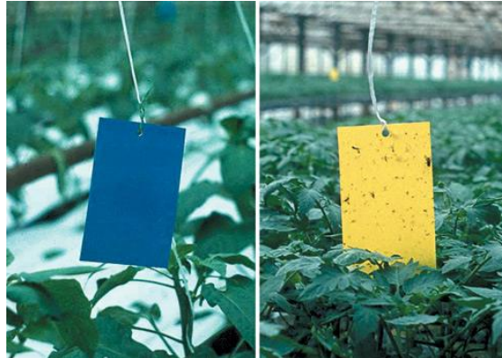
Slika 2.2.5.1. Ljepljive ploče za kontrolu tripsa

Kalifornijski trips ( Frankliniella occidentalis ) predstavlja značajnog štetnika u uzgoju salate. Učinkovito suzbijanje ovog štetnika zahtijeva pažljivo razmatranje niza faktora. Prvo, važno je uzeti u obzir vremenske uvjete i okolne usjeve i korove domačine jer to može utjecati na brojnost tripsa. Toplo vrijeme obično povećava brojnost tripsa, pa se preporučuje redovito praćenje pomoću plavih i žutih ljepljivih ploča, a s njima je također moguće i smanjiti populaciju u zaštićenim prostorima (slika 2.2.5.1.).