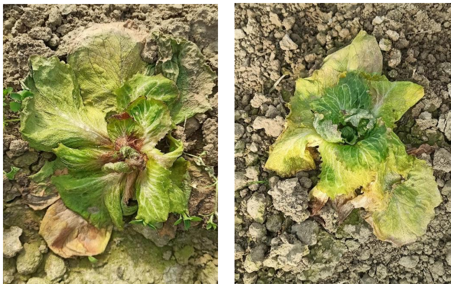
Slika 2.2.1.1. i 2.2.1.2. Simptomi plamenjače salate.