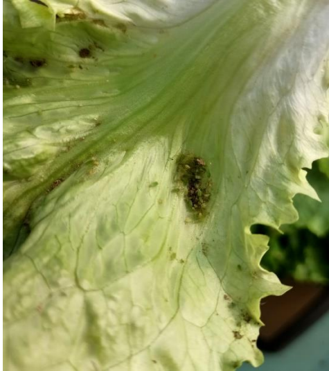
Slika 2.2.3.1. Beskrilni oblici lisnih uši

omogućuje da koloniziraju nove biljke domaćina. Ovaj ciklus razmnožavanja i širenja čini lisne uši potencijalno značajnim štetnicima za usjeve salate. Stoga je važno poduzeti mjere suzbijanja kako bi se ograničio njihov utjecaj na usjev i očuvala njegova produktivnost (Subbarao i sur., 2017.).