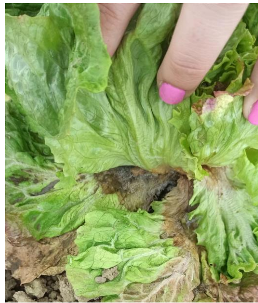
Slika 2.2.2.1. i Slika 2.2.2.2. Simptomi sive plijesni salate