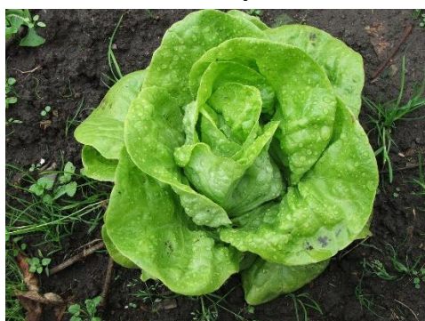
Slika 2.1.2.2. Salata maslenka

Drugi tip salate je kristalka, prepoznaje se po naboranoj površini lista, nazubljenom rubu i hrskavoj strukturi. Kristalka (slika 2.1.2.3.) se obično uzgaja tijekom kasnog proljeća, ljeta i rane jeseni, i to na otvorenom polju zbog njene dobre tolerancije na visoke temperature (Matotan, 2004.). Ovaj tip salate idealan je izbor za toplija razdoblja godine kada su visoke temperature prisutne, jer zadržava svoju kvalitetu i teksturu čak i pod takvim uvjetima. Ova raznolikost u tipovima salate omogućuje poljoprivrednicima prilagodbu uzgoja ovisno o sezoni i okolišnim uvjetima.