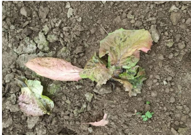
Slika 4.2.1. Uginule presadnice.

koja je odgovorna za trulež korijena i polijeganje klijanaca i mladih presadnica. Ova pojava odumiranja presadnica odmah nakon sadnje ističe važnost brige o tlu kako bi se spriječila kontaminacija patogenima i očuvala zdravlje biljaka. Redovita rotacija usjeva, uklanjanje biljnih ostataka i primjena odgovarajućih mjera zaštite mogu značajno doprinijeti prevenciji ovakvih problema i osigurati zdrav i uspješan rast salate.