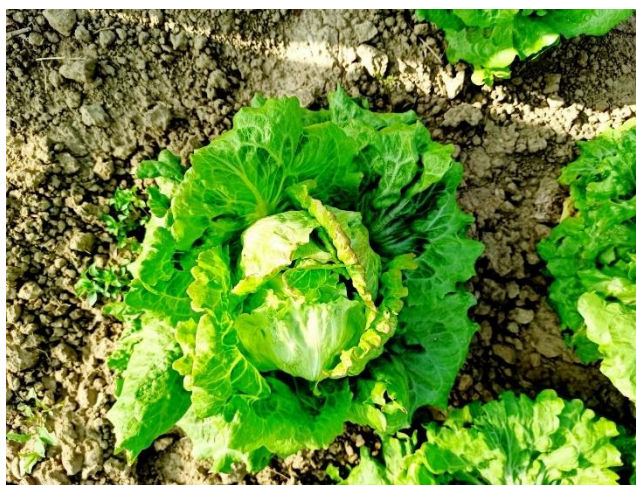
Slika 3.1.1. Salata Posavka

'Posavka' je domaća i autohtona sorta salate koja spada u kategoriju zimskih salati tipa kristalka. Odlikuje se krhkim, hrskavim listovima koji su poznati po svojoj kvaliteti. Uzgoj 'Posavke' obično započinje tijekom rujna i listopada, što je idealno vrijeme za sadnju kako bi se postigle najbolje karakteristike ove salate. Tijekom rasta, ova salata razvija velike, čvrste i zelene atraktivne glavice (slika 3.1.1.). Često se cijeni zbog svoje sposobnosti da izdrži hladnije zimske uvjete.