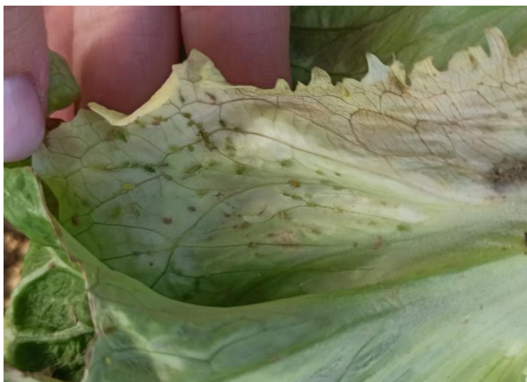
Slika 4.2.2. Lisne uši na salati