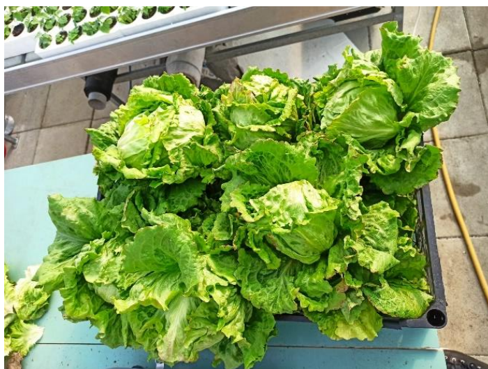
Slika 2.1.6.2. Slaganje salate u gajbe