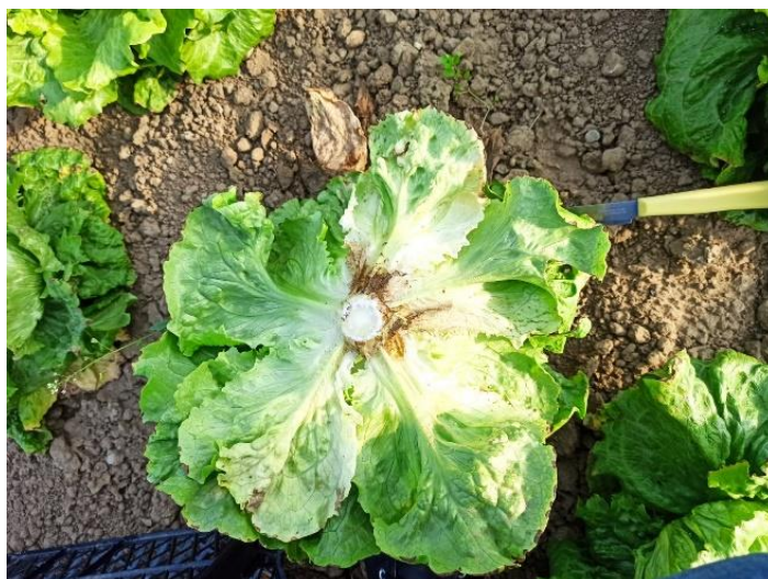
Slika 2.1.6.1. berba salate