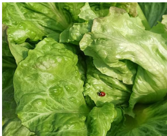
Slika 2.2.3.3. Božja ovčica na salati

Za praćenje prisutnosti lisnih ušiju koriste se žute posude i ljepljive ploče, kao i vizualni pregled biljaka. U cilju prevencije, poduzimaju se sljedeće mjere: eliminacija korova koji mogu biti domaćini lisnim ušima unutar ili oko nasada, te postavljanje mreža na otvorima u zaštićenim prostorima (Beljan i Župić, 2002.). Kako navodi Maceljski (1999.), za suzbijanje lisnih uši važni su i prirodni neprijatelji koji se koriste za kontrolu pojave i širenja lisnih uši. Neki od njih su bogomoljke ( Mantodea ), zlatooke ( Chrysopidae ), božje ovčice (slika 2.2.3.3.) vrsta Coccinella septempunctata i Adalia bipunctata , trčci ( Carabidae ), te grabežljive stjenice.