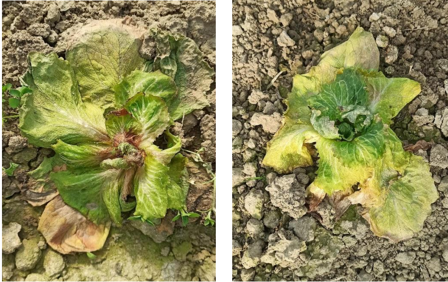
Slika 2.2.1.1. i 2.2.1.2. Simptomi plamenjače salate.