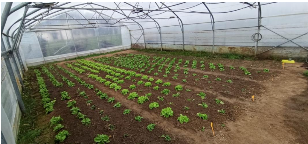
Slika 3.2.1. Pokus postavljen u negrijanom plasteniku

Statistička analiza prikupljenih podataka provedena je analizom varijance (ANOVA), čime je omogućena identifikacija statistički značajnih razlika između različitih varijanti pokusa u smislu, biomase, tržne mase, randmana i tržnog prinosa. Prosječne vrijednosti su testirane Least Significant Difference (LSD) testom na razini signifikantnosti p \leq 0,05 .