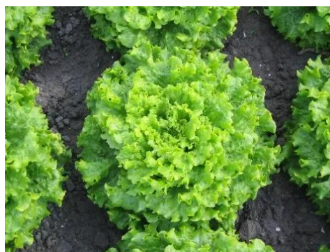
Slika 2.1.2.3. Salata kristalka