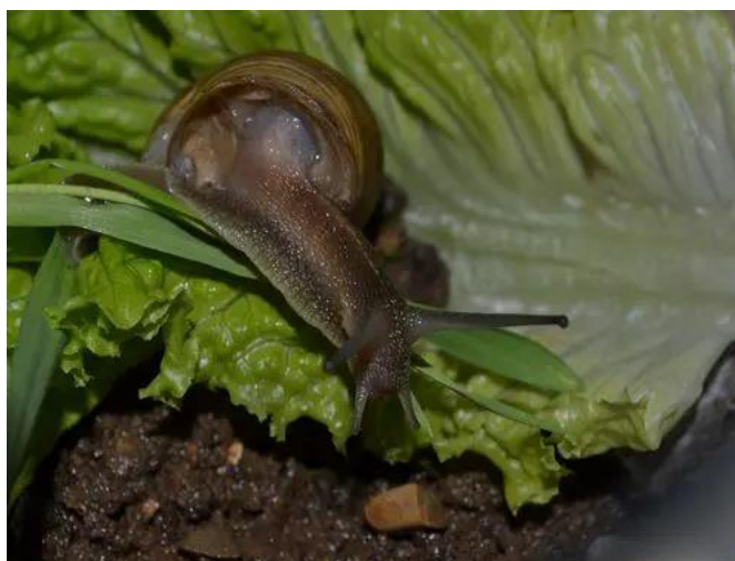
Slika 2.2.6.1. Puž na salati

Ako populacija puževa u usjevima salate postane prevelika, postaje nužno provesti mjere za njihovo suzbijanje. Kao sredstvo biološke kontrole protiv puževa, mogu se koristiti trčci, prirodni neprijatelji koji obitavaju u prizemnom sloju tla. Osim što se hrane štetnim organizmima poput puževa, trčci također doprinose očuvanju plodnosti tla (Maceljski i sur., 2004.).