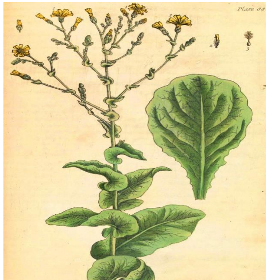
Slika 2.1.1.2 Cvijet salate