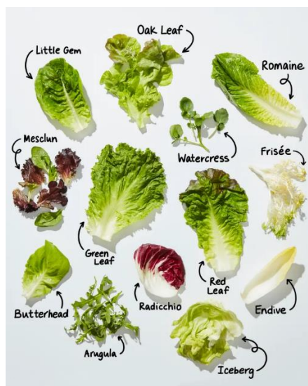
Slika 2.1.2.1. Varijeteti i tipovi salate