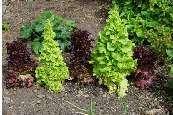
Slika 2.1.1.1. Salata u generativnoj fazi

Listovi koji se nalaze unutar glavice su svijetložute boje, dok su listovi s vanjske strane glavice znatno veći i imaju tamnozelenu boju.