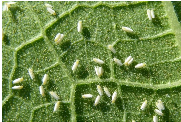
Slika 2.2.4.1. Bemisia tabaci na listu

Odrasli štitasti moljci su sitni kukci s izgledom sličnim malim snježnobijelim moljcima. Često se nastanjuju na donjoj strani listova. Njihov životni ciklus uključuje različite stadije, uključujući puzavce u prvom stadiju nakon izlaska iz jaja, te sesilne stadije u drugom i trećem stadiju, dok se četvrti stadij naziva puparij (Rajna, 2022.).