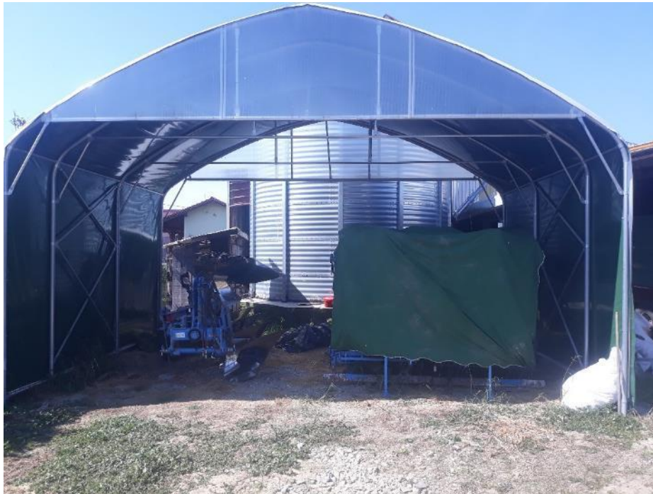
Slika 3.11. Natkriveni i nezatvoreni dio za spremanje strojeva od vanjskih utjecaja.