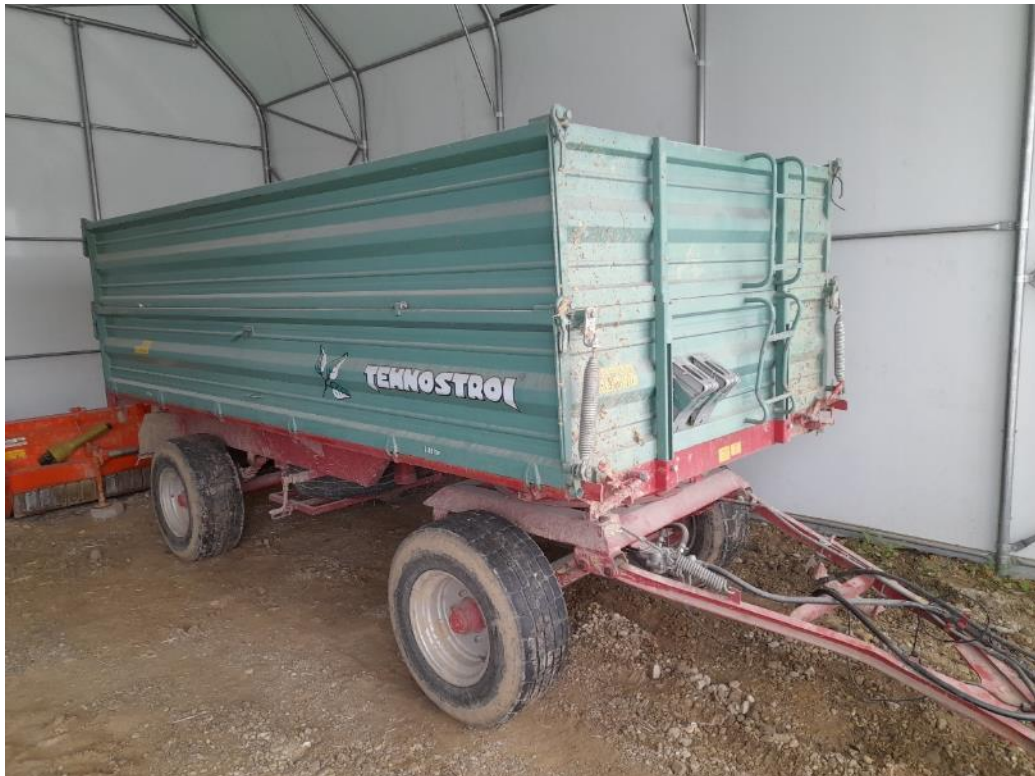
Slika 3.9. Prikolica Tehnostroj Dp 800