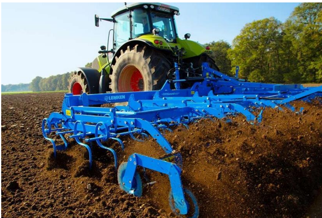
Slika 3.5. Sjetvospremač Lemken Korund 600K u radu