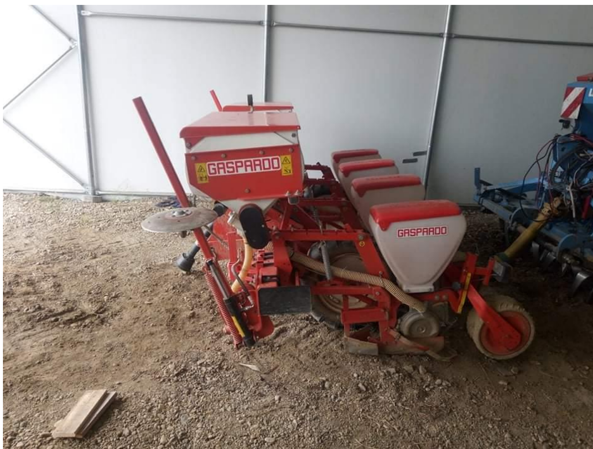
Slika 3.7. Sijačica Gaspardo Sp 540

Sijačica Gaspardo Sp 540 je 4-redna pneumatska sijačica za preciznu sjetvu s međurednim razmakom od 75 cm. Brazdicu za sjetvu pravi raonik, a dubina sjetve se određuje paralelogramskim sustavom postavljenim između okvira i stražnjeg kotača koji se može podesiti mehaničkom dizalicom. Posjeduje 2 hidraulična markera za ravnomjeren razmak kod spajanja prohoda. Pritiskujući kotači na stražnjoj strani služe za bolju interakciju sjemena s tlom. Volumetrijski dozator može raspodijeliti količine gnojiva u rasponu od 40 do 400 kg/ha. Prednosti su ravnomjerna raspodjela gnojiva, brzo pražnjenje i lako čišćenje. Sijačica Gaspardo Sp 540 se koristi za sijanje kukuruza na oko 45 ha godišnje, a prikazana je na slici 3.7. Tablica 3.8. prikazuje specifikacije različitih modela sijačica Gaspardo Sp 540.