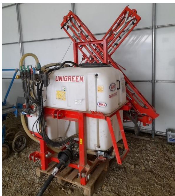
Slika 3.8. Prskalica Gaspardo Sauro 800