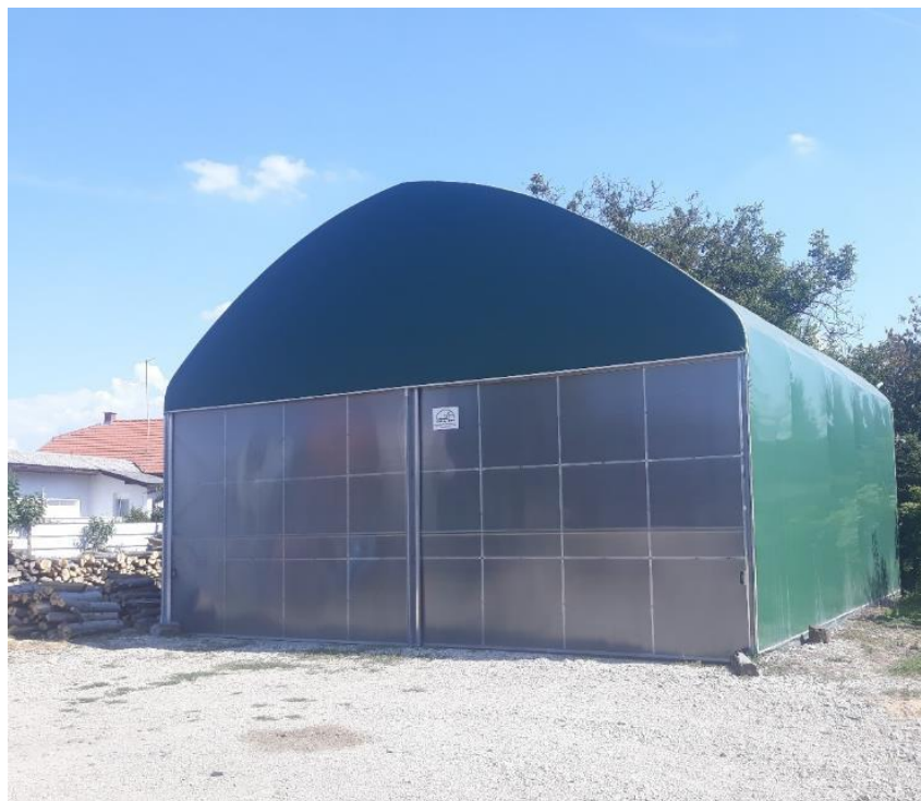
Slika 3.12. Zatvoreni i natkriveni dio za spremanje mehanizacije.