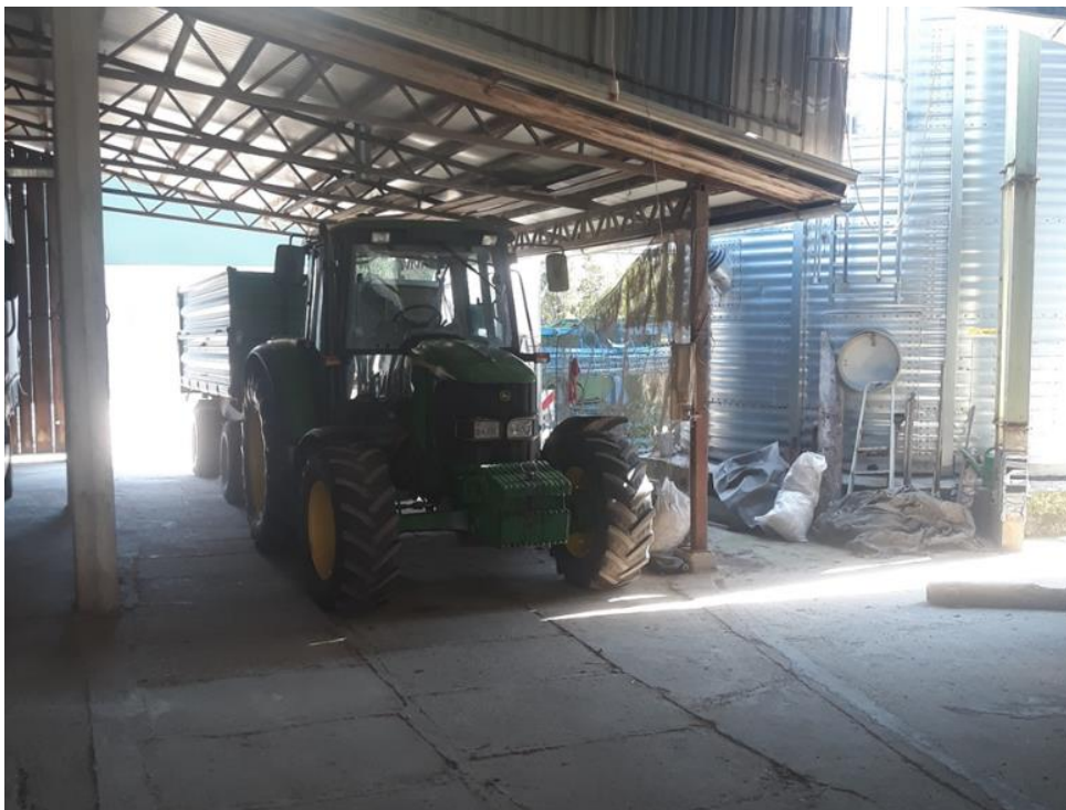
Slika 3.10. Traktor John Deere 6420 u poluzatvorenome dijelu natkrivenog objekta.

pružnu radionicu koja služi za brzu i ponekad hitnu intervenciju oko popravka određenih manjih kvarova koje vlasnik može sam kvalitetno popraviti i stroj brzo opet osposobiti za rad. Radionica služi za manje popravke, održavanje strojeva i slabo je opremljena specijalnim alatima za rad. Izrađena je od betonskih zidova i poda, no pod nema finu podlogu pa dolazi do nakupljanja prašine. Zidovi radionice nisu toplinski izolirani kako bi bila ugodnija za rad prilikom hladnijih dana i također nema nikakav oblik grijanja prostorije. U radionicu nije moguće ući strojevima samo služi za spremanje alata i rad, dok se rad na strojevima obavlja u natkrivenim prostoru OPG-a. Radionica ima samo 1 prozor, pa je uvijek potrebno koristiti umjetnu rasvjetu. Radionica bi trebala posjedovati mjesto za pranje ruku, aparat za gašenje požara i pribor za prvu pomoć, ali vlasnik ima u vidu uvesti to u radionicu. U radionicu bi trebalo montirati još nekoliko nosećih ploča za alate, ormar i masivni radni stol s željeznim okovom. Radionica posjeduje standardne alate kao što su različiti setovi ključeva, različite vrste kliješta, odvijača, pila, turpija, sjekača i brusnača. Od električnih alata posjeduju nekoliko bušilica, stupnu bušilicu, kutnu brusilicu i to su sve alati na izmjeničnu struju. Radionica nema nikakav aparat za zavarivanje, pa te poslove za vlasnika obavljaju zaposlenici za to specijaliziranih radionica.