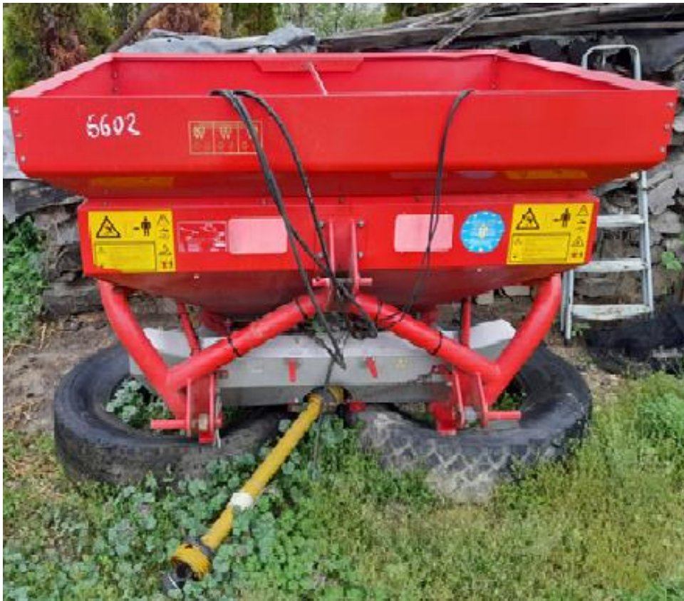
Slika 3.6. Raspodjeljivač mineralnog gnojiva Kverneland Exacta EL