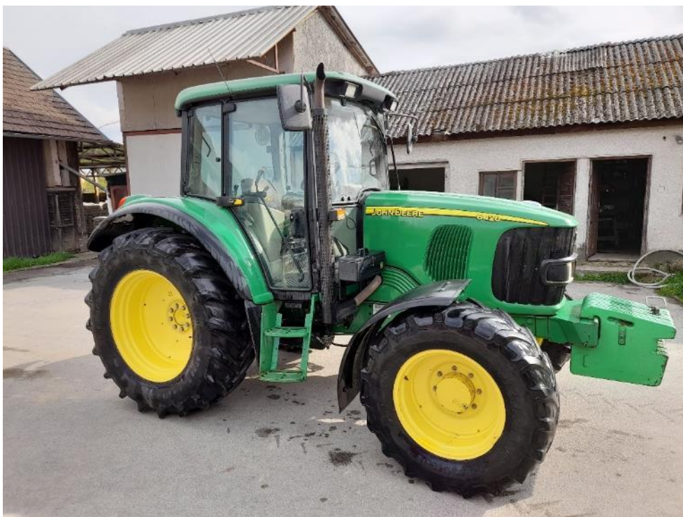
Slika 3.3. Traktor John Deere 6420.