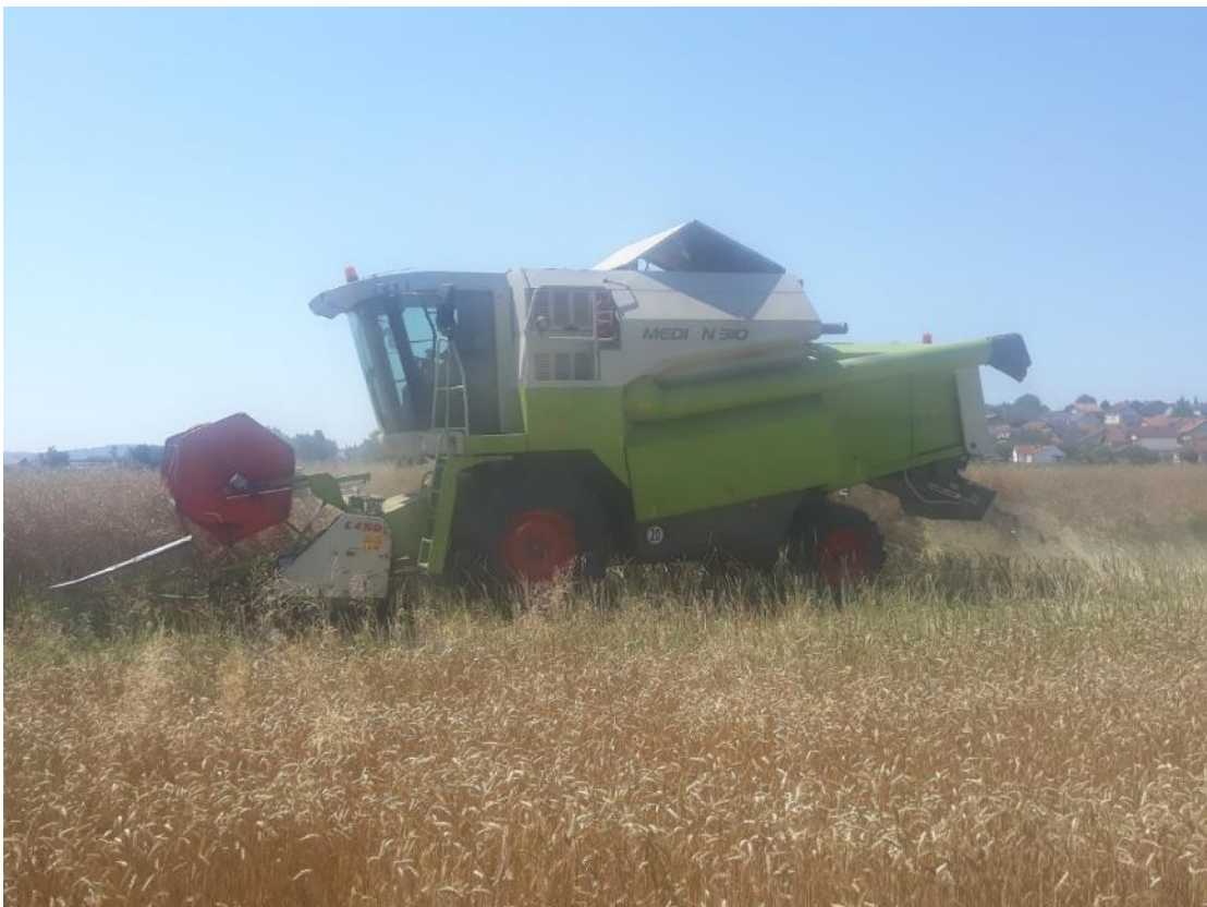
Slika 3.4. Kombajn Claas Medion 310 u žetvi uljane repice.

Kombajn Claas Medion 310 nabavljen je 2018. godine, a u trenutku kupnje bio je star dvanaest godina. U kombajn je ugrađen šesterocilindrični vodom hlađeni motor Mercedes-Benz zapremine 6,4 L. Duljina kombajna je 4,4 m, volumen spremnika za zrno iznosi 5.000 L, a ukupna masa iznosi 10.000 kg. Uz kombajn se koriste i 2 adaptera koji služe za žetvu, Claas C450 radne širine 4,5 m za žetvu pšenice i uljane repice i Olimac 5-redni za kukuruz. Kombajn posjeduje razne senzore koji omogućuju lakše praćenje rada kombajna i sprječavanje raznih začepljenja, rastepa kao i kvarova koji se mogu prouzročiti. Ima ugrađen spremnik goriva od 400 L, a sadrži 5 slamotresa ( www.konedata.net ). Kombajn se koristi za žetvu pšenice i uljane repice i berbu kukuruza, a godišnje odradi 250-300 radnih sati. Na slici 3.4. je prikazan kombajn Claas Medion 310 u žetvi uljane repice.