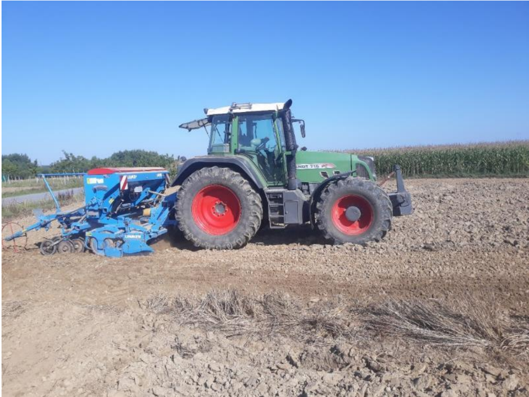
Slika 3.2. Traktor Fendt 716 Vario obavlja sjetvu uljane repice sa sjetvenom kombinacijom